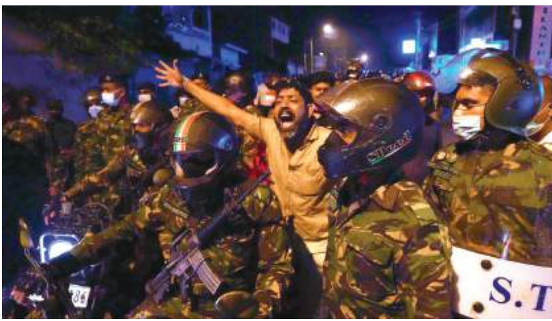
ستوكهولم - (د ب أ) -

بجروح، حسبما ذكرت قناة «إس في تي» في وقت متأخر من مساء الأحد. والقى القبض على ما مجموعه ٢٥ شخصا. وأكدت الشرطة أنها تعرضت لهجوم وفي مدينة مالمو، شبت النيران في حافلة بعد أن ألقى مجهولون شيئا مشتعل على المركبة، حسبما ذكرت قناة «إس في تي». وتمكن الركاب من الفرار من الحافلة قبل أن يصاب أحد بانئي. كما تم أضرار النيران في