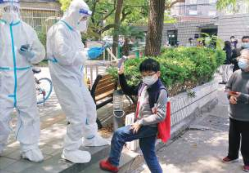
بكين - (د ب أ) -

سجلت مدينة شنغهاي الصينية أول ٣ حالات وفاة بكوفيد -١٩ في أحدث تفشي للجائحة في المدينة الساحلية شرقي الصين. وقالت حكومة المدينة يوم الاثنين إن الأشخاص الثلاثة الذين توفوا كانوا من كبار السن ومصابين بأمراض. يشار إلى أنه تم تسجيل حالتها وفاة في منتصف شهر آذار/ مارس الماضي في مقاطعة جيلين شمال - شرقي الصين، والتي كانت تعتبر الأولى في البلاد منذ أكثر من عام. وشكك خبراء مستقلون في دقة الأعداد الرسمية للإصابات بفيروس كورونا وأرقام الوفيات المعلنة من بكين، والتي كانت قد حددت في تلك المرحلة تاريخ آخر حالة وفاة مسجلة بكوفيد -١٩ في ٢٥ كانون الثاني/يناير ٢٠٢١. وتعتبر شنغهاي حاليا مركز أكبر