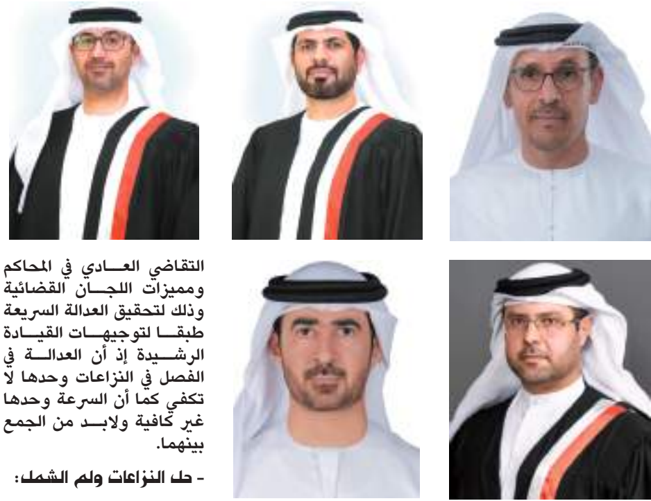
أعضاء السلك القضائي في دبي يشيدون بإنشاء محكمة متخصصة لدعوى الشركات

- مكّنات تشريعية وقضائية وتقنية: من جانبه، قال سعادة