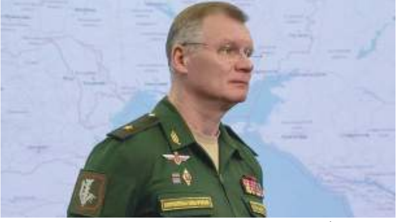
موسكو - (د ب أ) -

أعلنت وزارة الدفاع الروسية يوم الاثنين تدمير مستودعات ومعدات عسكرية في أماكن تجمع جنود أوكرانيا. وجاء في بيان لوزارة الدفاع نقلته اليوم قناة « آر تي عربية » إنه تم إسقاط مقاتلتين أوكرانيتين من طراز «ميج-٢٩» في إيزيوم، وواحدة من طراز «سو-٢٥» في منطقة أفدييفكا الليلية الماضية. وأشار البيان «دمرت صواريخ جوية ١٦ منشأة عسكرية أوكرانية ليلا، بما في ذلك خمسة مواقع قيادة، ومستودع تخزين الوقود، وثلاثة مستودعات للمخبرة والأسلحة في مناطق بارفينكوفو، وجوليبي بو، وكاميشيفكا، وزيلينوي القطب، فيليكومخايلوفكا، ميكولايف وأوضح البيان أنه «تم تنفيذ