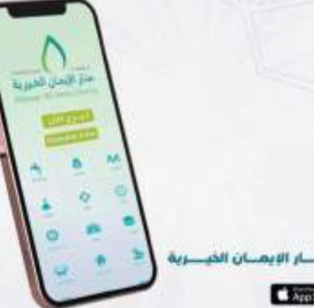
تطبيق مؤسسة منار الإيمان الخيرية

ومن أهم مميزات وخدمات هذا التطبيق الذكي، سهولة التبرع، وسرعة عرض المحتويات، وعرض البيانات الكاملة لمشاريع المؤسسة وفرز المشاريع التي تنفذها المؤسسة. وأوضحته المؤسسة، أنه يمكن التبرع عبر تطبيق