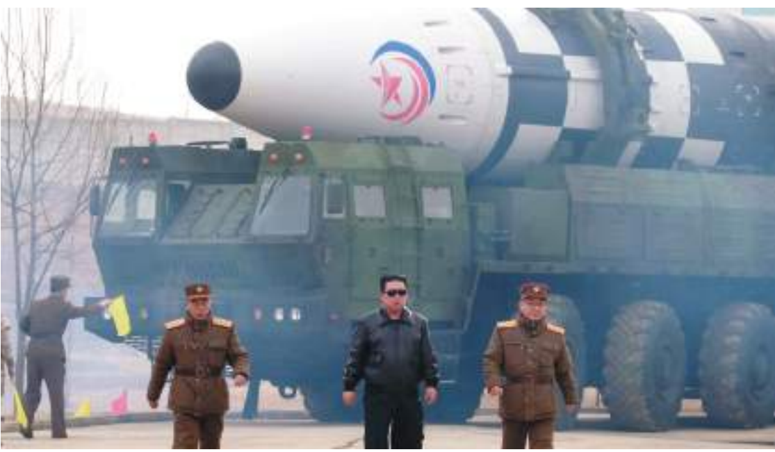
سول - (د ب أ) -

يونهاب الكورية الجنوبية أنه من المقرر أن تستمر زيارة السفير سونج كيم خمسة أيام وسط توترات متصاعدة بعد إجراء كوريا الشمالية تجربة سلاح تكتيكي موجه يوم الأحد. ولا تزال هناك مخاوف من أن تقوم بيونج يانغ بأعمال استنزافية، بما في ذلك تجربة نووية، في الذكرى التسعين لتأسيس الجيش القوي الشعبي الكوري في ٢٥ نيسان/ أبريل.