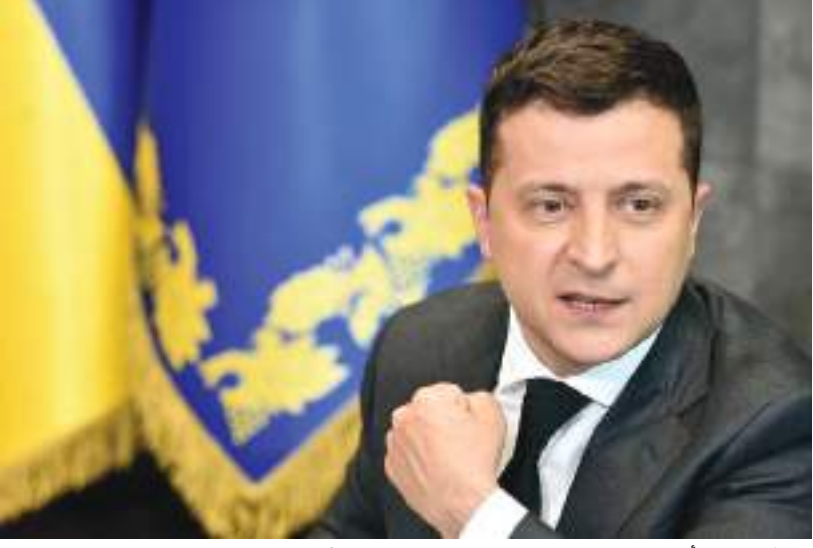
كييف - (د ب أ) -

انتقد الرئيس الأوكراني فولوديمير زيلينسكي تأخر وصول السلاح إلى بلاده. وقال زيلينسكي في كلمته اليومية عبر الفيديو ليل الأحد « كل تأخير في السلاح، كل تأخير سياسي هو بمثابة تصريح لروسيا بإزهاق أرواح الأوكرانيين. ويجب ألا يكون الحال هكذا في الواقع». ويعتقد خبراء عسكريون أن أوكرانيا ستحتاج إلى المزيد من الأسلحة الثقيلة وحز زيلينسكي من أن الجيش الروسي يستعد لشن عمل عدائي في إقليم دونباس الصناعي