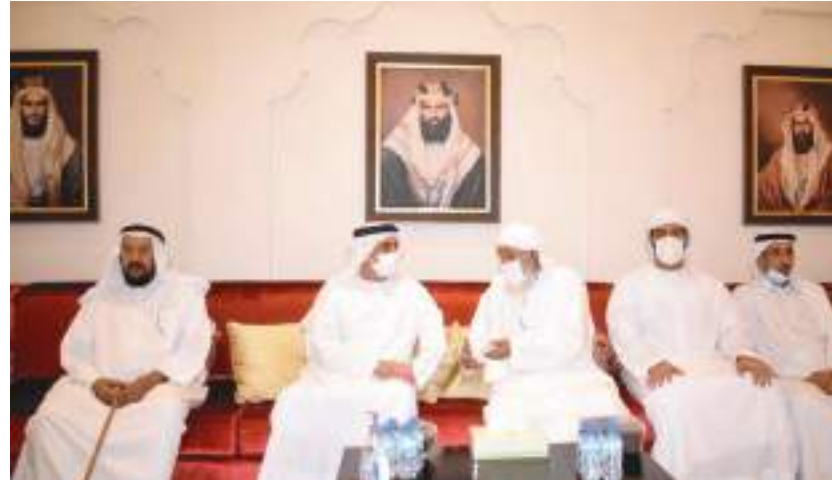
سيف بن زايد خلال تقديم واجب العزاء في وفاة سيف مبارك المنصوري

العزاء - وام : سالمين المنصوري - وأعر سموه، لدى زيارته مجلس العزاء بالمرخانية، عن صادق تعازيه لأسرة ونوي الفقيدي، داعياً الله العلي القدير أن يتغمده بواسع رحمته وأن يسكنه فسيح جناته ويلهم أهله وذويه الصبر والسلوان.