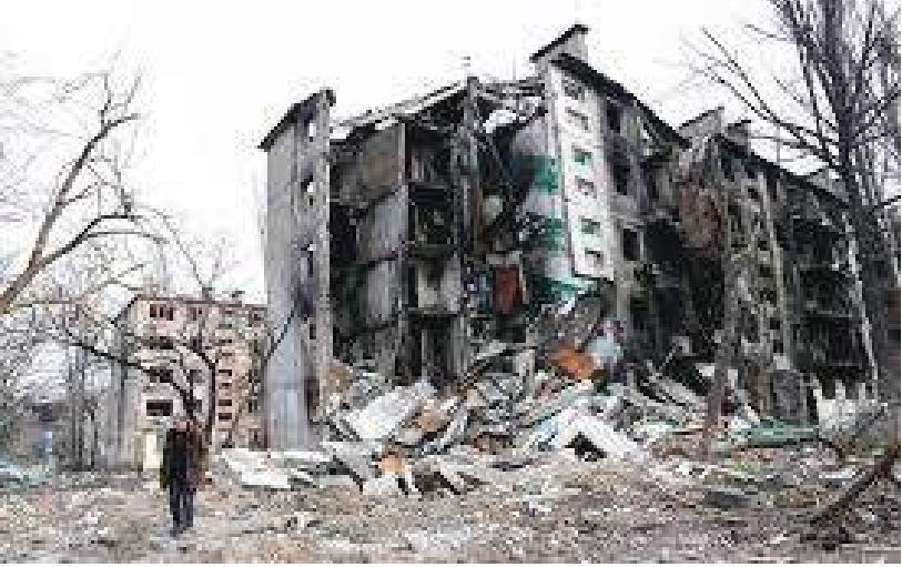
لندن - (د ب أ) -

وصف تقييم استخباراتي لوزارة الدفاع البريطانية، بشأن التطورات في أوكرانيا، يوم الاثنين، ما تفعله القوات الروسية في مدينة ماريوبول الأوكرانية بأنه يشبه ما سبق أن فعلته في الشيشان وسوريا. وجاء في التقييم، المنشور على صفحة الاستخبارات البريطانية على تويتر: «ينسجم استهداف المناطق المأهولة