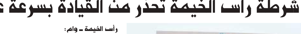
رأس الخيمة - وام :

أكدت إحصائيات مرورية أن أكثر من نصف الحوادث الطرق التي وقعت في شهر رمضان المبارك خلال الأعوام الماضية كانت قبيل وقت الغروب والإفطار، نتيجة السرعة الزائدة وعدم الالتزام بقوانين السير والمرور، وتجاوز الإشارة الضوئية الحمراء، وذلك لاستعجال السائقين في العودة لمنزلهم قبل وقت الإفطار. وقال العميد الدكتور محمد سعيد الحميدي مدير عام العمليات المركزية بشرطة رأس الخيمة إن هناك 10 أخطاء رئيسية يرتكبها مستخدمو الطريق أثناء القيادة في شهر رمضان تتسبب في حدوث الحوادث المرورية المهلكة وهي: القيادة