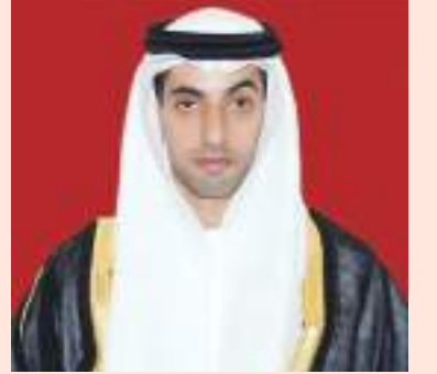
خالد بن زايد: