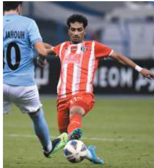
الرياض - وام:

حسم التعادل السلبي نتيجة لقاء الجزيرة ومومباي سيتي الهندي ضمن منافسات الجولة الرابعة لمجموعة الثانية من دوري أبطال آسيا، والذي أقيم على استاد الملك فهد الدولي بالعاصمة السعودية الرياض. وبهذه النتيجة رفع الجزيرة رصيده إلى 4 نقاط، فيما رفع مومباي سيتي رصيده إلى 4 نقاط أيضاً.