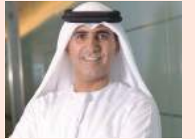
سالم بن سلطان القاسمي