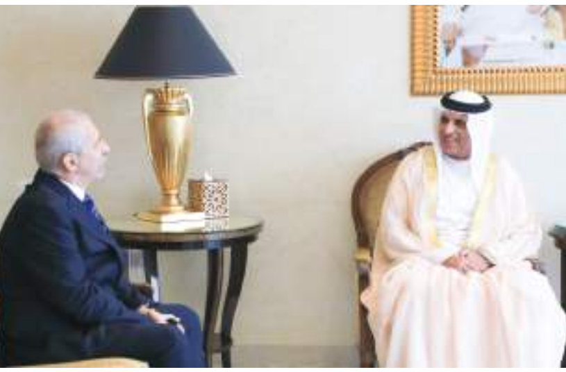
حاكم رأس الخيمة خلال استقباله سفير رومانيا