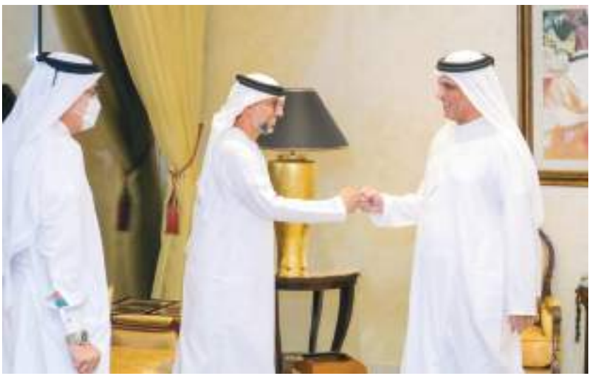
..وسموه خلال استقباله وزير الطاقة والبنية التحتية