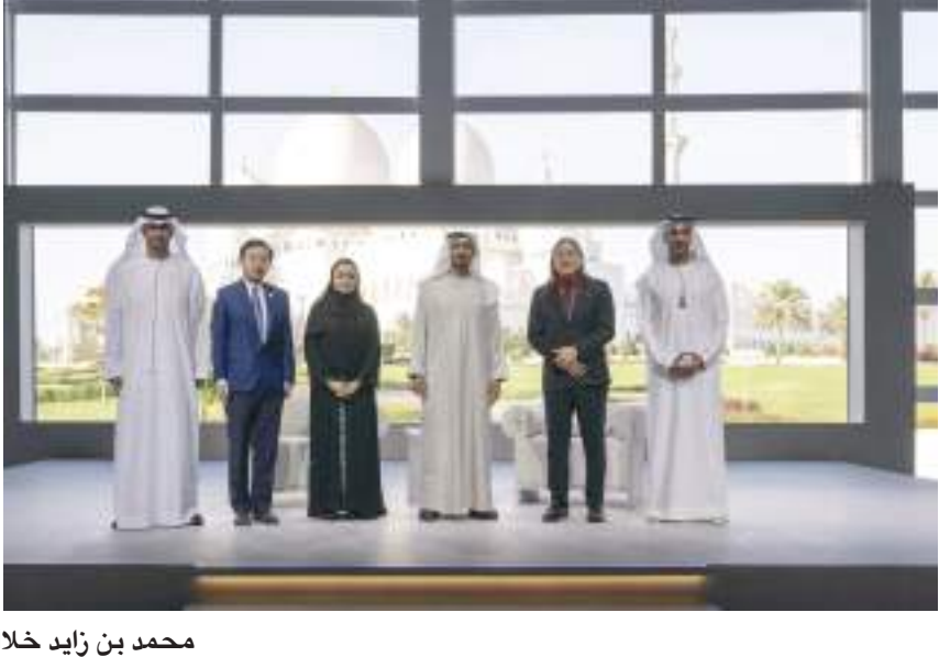
محمد بن زايد خلال حضوره المحاضرة

والموضوعية والحياد. وعقب التوقيع، تجول سموه في مختلف أركان وأجنحة المعرض الذي يضم عدداً من المشاركات من دور النشر المحلية المتخصصة في نشر الكتاب الإماراتي، متفقاً ما تحتويه من إصدارات حديثة ومختلفة تقدم مؤلفات الكتاب المحليين في مختلف المجالات الأدبية والثقافية والعلمية وغيرها. واطلع سموه على ما يضمه جناح اتحاد كتاب وأدباء الإمارات من كتب متنوعة في مختلف المجالات الثقافية والأدبية، حيث تعرف سموه على ما يضمه الجناح من إصدارات جديدة لمجموعة من المؤلفين والكتاب أعضاء الاتحاد، ومجهودات الاتحاد لدعم وتحفيز المؤلفين من أبناء الدولة وتطوير موهبة الكتابة والتأليف لديهم. وتجول صاحب السمو حاكم الشارقة في بقية أجنحة المعرض، حيث تفصل بزيرة دار مجموعة كلمات، وجمعية الناشرين الإماراتيين مشروع منصة، ودار مدار، ودار الهدد ودار كتاب.