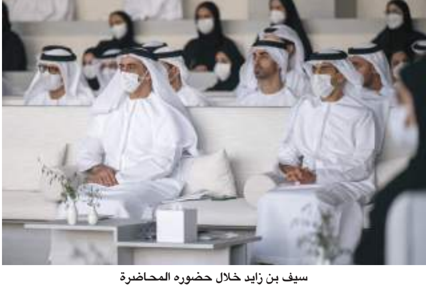
سيف بن زايد خلال حضوره المحاضرة

وأشار إلى أن الإمارات تمتلك تجربة مهمة في مجال استقطاب المبدعين والمفكرين من مختلف دول العالم، معتبراً أن الأشخاص المميزين هم من يصنع التحولات الكبرى خصوصاً إذا ما