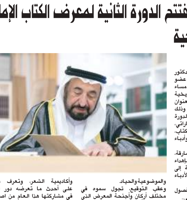
حاكم الشارقة خلال تفقده المعرض

ويعد سموه في هذا الكتاب التاريخي الجديد على سرد وقائع التاريخ وتناولها بالدرس والتحليل بغية اكتشاف ما تنطوي عليه من قيمة علمية وتاريخية، ومرتكزات قوية وخصائص فارقة، إذ تقوم على منهجي المقارنة والمقابلة بين الروايات التاريخية والأحداث، والاعتماد على الوثائق الصحيحة في إعادة بناء الحدث التاريخي وقرارة الماضي بعين فاحصة وقلم جاد ينشد الصدق