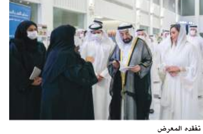
حاكم الشارقة خلال تفقده المعرض