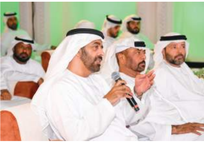
الإيمان بوحدة المصير الإنساني والمسؤولية تجاه الشعوب دون اعتبار لعرق أو دين أو معتقد.

وسيتخلل الملتقى توزيع الجوائز التشجيعية السنوية على الفائزين بها من أعضاء الهيئة