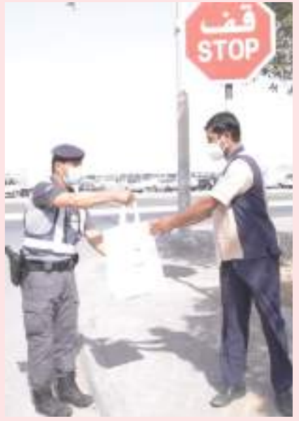
أبوظبي - الوحدة :

نفذت مديرية المرور والدوريات بقطاع العمليات المركزية في شرطة أبوظبي مبادرة توزيع الهدايا على العمال تزامناً مع «يوم زايد للعمل الإنساني» الذي يصادف ١٩ رمضان من كل عام.