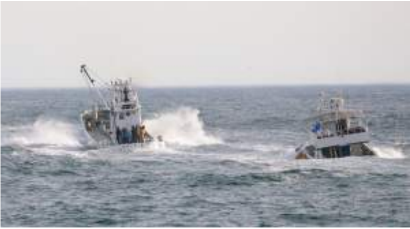
طوكيو - (د ب أ)-

أكدت وسائل إعلام محلية يابانية يوم الاثنين وفاة ضحية أخرى في حادث الزورق السياحي في شمالي اليابان، ما يرفع إجمالي الوفيات المؤكدة إلى ١١ شخصاً. وكانت الطفلة أحد طفلين اثنين فقدوا بعد انقلاب زورق سياحي على متنه ٢٦ شخصاً يوم السبت. ونكرت هيئة الإذاعة اليابانية يوم الاثنين أن أطمع الانقاذ انتشلت الفتاة من المياه الساحلية المجمدة. وكانت الطفلة فاقدة للوعي وتم نقلها إلى المستشفى، حيث تم إعلان وفاتها. ولا يزال ١٥ راكباً في عداد المفقودين، وتتواصل الجهود من أجل العثور على بقية الركاب بالإضافة إلى الزورق «كازو ١». ونكرت وكالة أنباء كيودو اليابانية أن الحادث وقع أثناء وجود الزورق في المياه قبالة شلالات كاشوني، وهو موقع شهير