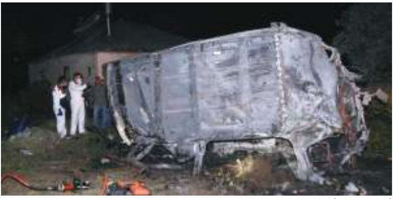
أنقرة - (د ب أ)-

لقي شخصان حتفهما وأصيب ١١ آخرون جراء انقلاب حافلة تقل مهاجرين غير نظاميين في ولاية آغري شرقي تركيا.