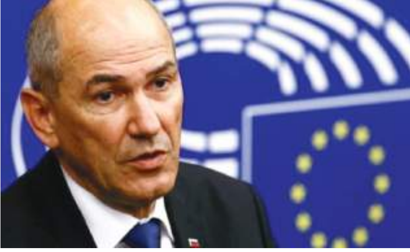
ليوبليانا، (د ب أ)-

أظهرت نتائج أولية للانتخابات البرلمانية في سلوفينيا أن رئيس الوزراء السلوفيني يانيز يانشا، وهو قومي يميني، قد خسر على ما يبدو محاولته لإعادة انتخابه لصالح حزب معارض ليبرالي من الخضر تم تشكيله حديثاً بقيادة الوافد السياسي روبرت جولووب. وحصل حزب «حركة الحرية» الليبرالي المعارض بزعامة جولووب على ٣٤٪ من الأصوات وهو ما يمثل ٤٠ مقعداً من إجمالي مقاعد البرلمان البالغ عددها ٩٠ مقعداً بعد فرز ٩٨٪ من الأصوات في الانتخابات التي جرت يوم الأحد، وفقاً للجنة الانتخابات الحكومية. وبهذه النتيجة، فإن جولووب / ٥٥ عاماً / سيكون في طريقه ليصبح رئيس الوزراء المقبل للدولة العضو بالاتحاد الأوروبي. وحصل يانشا من من الحزب الديمقراطي السلوفيني على ٢٤٪ من الأصوات. وعند هذه المرحلة من فرز الأصوات، فإنه في طريقه للحصول على ٢٨ مقعداً في الجمعية الوطنية» البرلمان». وتجاوز ٣ أحزاب أخرى فقط، حزب «سلوفينيا الجديدة» من التيار المحافظ، والحزب الاجتماعي الديمقراطي والحزب اليساري «لافيتكا»، نسبة الـ ٤٪ الضرورية لدخول البرلمان.