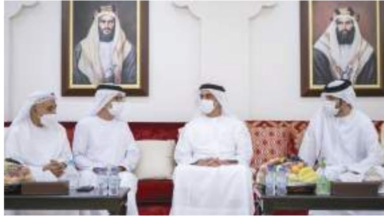
سيف بن زايد يقدم واجب العزاء في وفاة سالم الجنبلي

عبدالله الجنبلي. وأعرب سموه لدى زيارته مجلس العزاء عن صادق تعازيه لأسرة وذوي الفقيد داعياً الله العلي القدير أن يتغمده بواسع رحمته، وأن يسكنه فسيح جناته، ويلهم أهله وذويه الصبر والسلوان.