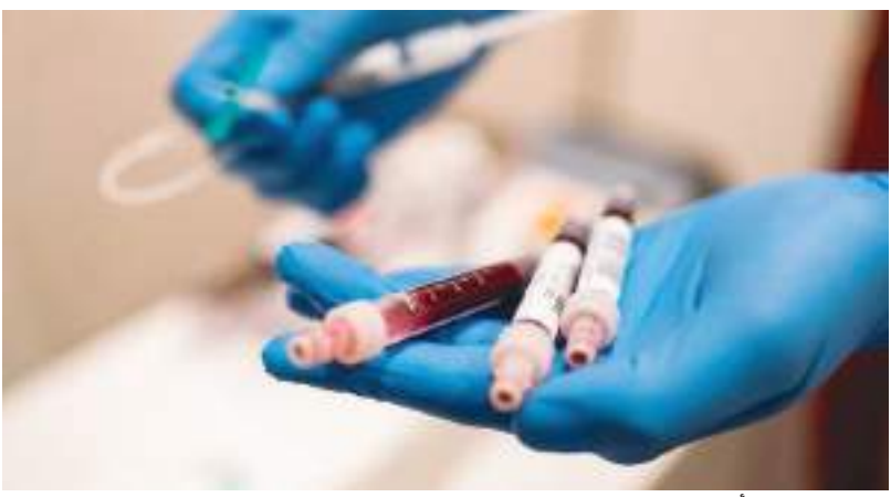
باسادينا