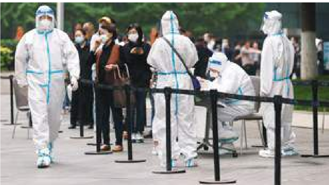
بكين - (د ب أ)-

أغلقت العاصمة الصينية بكين أجزاء من منطقة شاويانج على الجانب الشرقي من الطريق الدائري الثاني الشرقي وجنوب منطقة