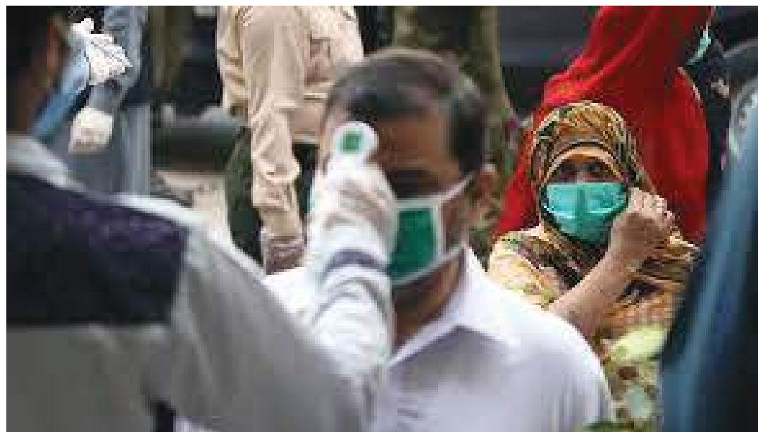
إسلام آباد - (د ب أ)-

أعلنت السلطات الصحية الباكستانية يوم الاثنين تسجيل ١٠٠ حالة إصابة جديدة بفيروس كورونا خلال الـ ٢٤ ساعة الماضية، وبذلك يبلغ إجمالي حالات الإصابة بالفيروس مليون و ٥٢٧ ألفاً و ٩٥٦ حالة. ونقلت صحيفة ذا نيشن الباكستانية عن السلطات القول إنه لم يتم تسجيل