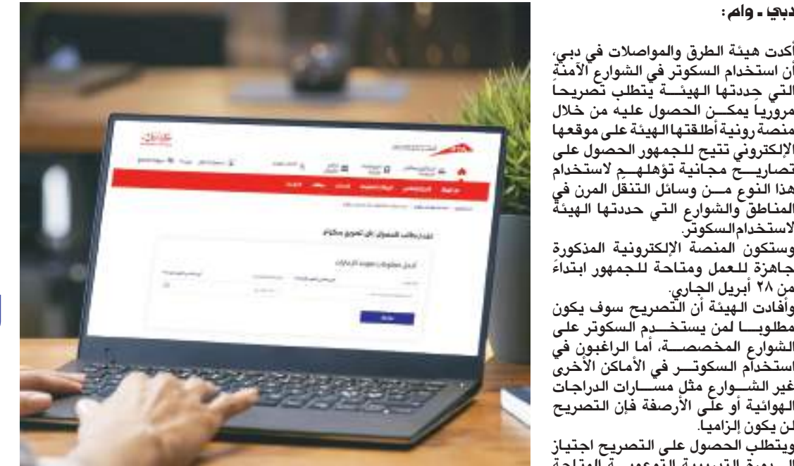
ديجا - وام :

أتى هذه الخطوة، تماشياً مع إصدار سمو الشيخ حمدان بن محمد بن راشد آل مكتوم، ولي عهد دبي رئيس المجلس التنفيذي لإمارة دبي، قرار المجلس رقم ١٣/ لسنة ٢٠٢٢ بشأن تنظيم استخدام الدراجات في إمارة دبي، الذي يهدف إلى دعم الجهود الرامية لتحويل إمارة دبي، إلى مدينة صديقة للدراجات، وتشجيع السكان والزوار على استخدام وسائل التنقل البديلة، كما يأتي تويجا للنجاح الكبير الذي حققه التشغيل التجريبي للسكوتر الكهربائي، الذي بدأ في أكتوبر عام ٢٠٢٠. الجدير بالذكر أن التشغيل الفعلي للمرحلة الأولى للسكوتر الكهربائي كان قد بدأ في ١٠ مناطق في دبي، وعلى مسارات الدراجات الهوائية المخصصة لها في ١٣ إبريل الجاري. والمناطق هي