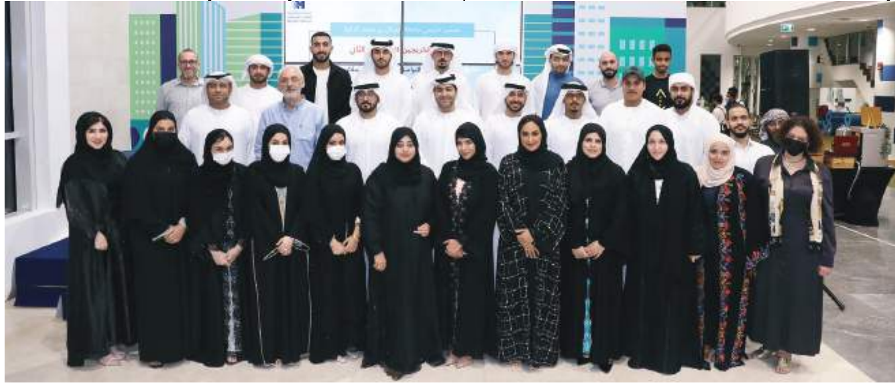
ديجا - وام :

بعد التخرج وتعزيز ثقافة المنفعة المتبادلة، والمشاركة في تطوير ورعاية منصة اتصال تساعد الخريجين على المشاركة والتواصل والتطور والنمو، والمساهمة في تحقيق رسالة الجامعة ودعم توجهاتها الاستراتيجية ٢٠٢١-٢٠٢٣، الرامية إلى توسيع دائرة انتشار برامج التدريب الذكية التي تقدمها الجامعة في العالم العربي، وتطبيق نماذج أعمال مبتكرة لجذب قطاعات جديدة من السوق، واعتماد أحدث التقنيات لتسريع الابتكار في التعلم والجوانب الإدارية، ودعم برامج التحول الرقمي للجامعات في الدولة والعالم العربي، وتطبيق مفهوم التعلم من أجل المهارات في