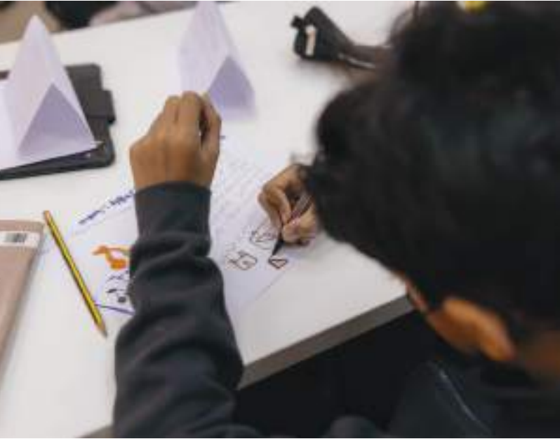
الشارقة - وام :

المعرفية التي تحتويها صفحات الكتب بشتى موضوعاتها» لافتة إلى أن بيئة ثقافية عامة تضع القراءة على قائمة سياساتها كالحالة التي تشهدها الإمارات في هذا الشهر القراني تسهم في نشأة الأطفال واليافعين نشأة فكرية ونفسية سليمة يستطيعون من خلالها قراءة ما يعترضهم في الحياة بوحي وتتكون في عقولهم تجارب معرفية تثري مستقبلهم الأكاديمي والمهني..