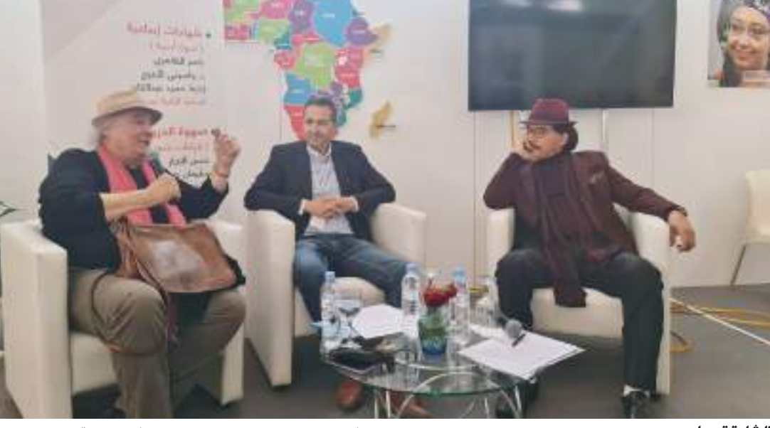
الشارقة - وام :

من كتاب «محاكم التفتيش» لصاحب السمو الشيخ الدكتور سلطان بن محمد القاسمي عضو المجلس الأعلى حاكم الشارقة الصادر عن منشورات القاسمي. واستضاف جناح الهيئة الكاتب والمخرج السينمائي الإماراتي ناصر الظاهري والروائي والأديب الجزائري واسيني الأعرج في جلسة حوارية أدارها الناقد الجزائري حميد عبدالقادر تحت عنوان «شهادات إبداعية» تحدث فيها الضيوف عن بدايات الحس بالكتابة لديهم وكيف شكل المكان الأول مرتكزاً لتلمس خفايا المهوبه والاتفات لمجريات ذلك المكان بما يحيى من شخصيات وعادات وتقاليد كما نظمت الهيئة أمسية شعرية بعنوان «صهوة الحروف» جمعت الشاعر حسن النجار والشاعرة الدكتورة شفيقة وعيل عندما خلاها عددا من قصائدهما.