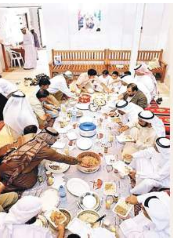
الإفطار بين الجيران