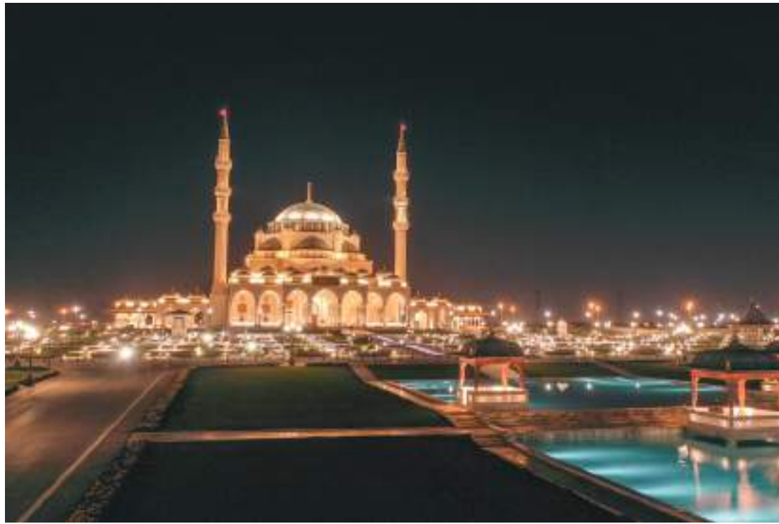
الشارقة - وام :

أعلنت دائرة الشؤون الإسلامية في الشارقة عن برنامجها الرمضاني الحافل بالعديد من الأنشطة والفعاليات الدعوية المتنوعة التي تتناسب مع مكانة الشهر الفضيل، وتسهم في رفع الوعي الديني لدى فئات وشرائح المجتمع بجالياته المختلفة، وذلك انطلاقاً من رسالتها السامية التي تتولاها في تعزيز الثقافة الإسلامية وإعمار المساجد ماديًا ومعنويًا. وأكدت الدائرة على استكمال استعداداتها للشهر الفضيل: حيث قامت فرق الصيانة واللجان المختصة في الدائرة بجولات تفقدية للجوامع والمساجد للاطلاع على مستوى نظافة المساجد واحتياجات المصلين من السجاد، وتفقّد أنظمة التبريد والإضاءة، والأنظمة الصوتية، وعمل توسعة لعدد من المساجد التي تشهد كثافة سكانية: