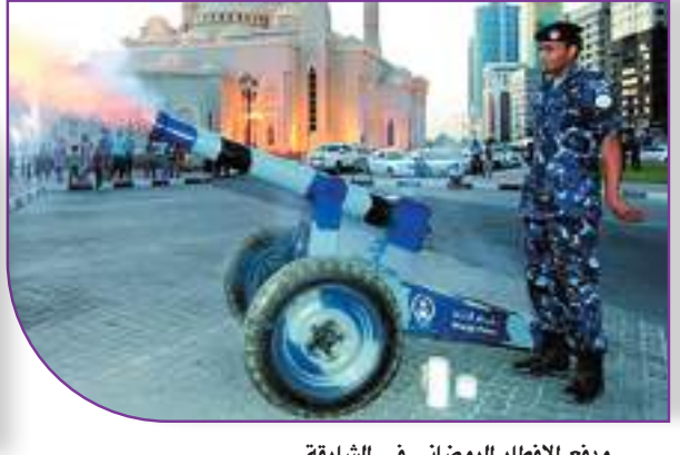
مدفع الإفطار الرمضاني في الشارقة

وأصبح لكل شخص فيلته الخاصة فاقتصر التواصل على قليل من الزيارات واللقاءات في المناسبات وكثرت الرسائل «المسجات» بين الناس وشهر رمضان في الماضي تلك العادات والتقاليد الاجتماعية الطيبة والتي تجدها في أيام وليالي رمضان من حيث التجمع في مكان واحد وأسرة واحدة مع السمر والسوالف والاستذكار