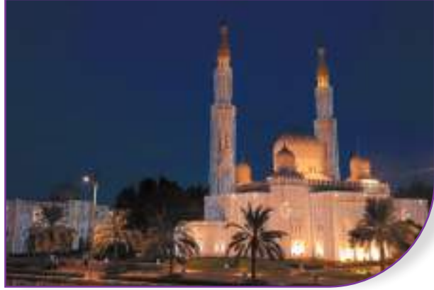
تبادل التهاني بحلول الشهر الكريم