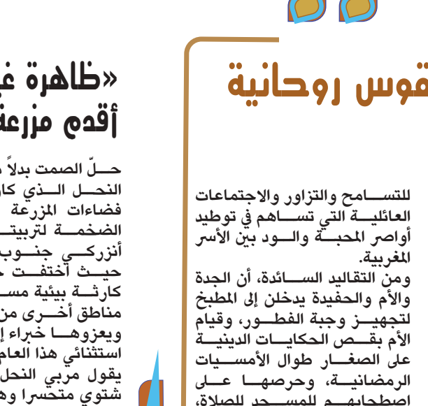
الإفطار بين الجيران