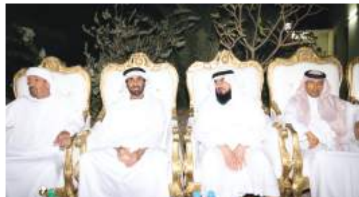
سعيد وذياب وخالد بن زايد والشيوخ خلال تقديم واجب العزاء