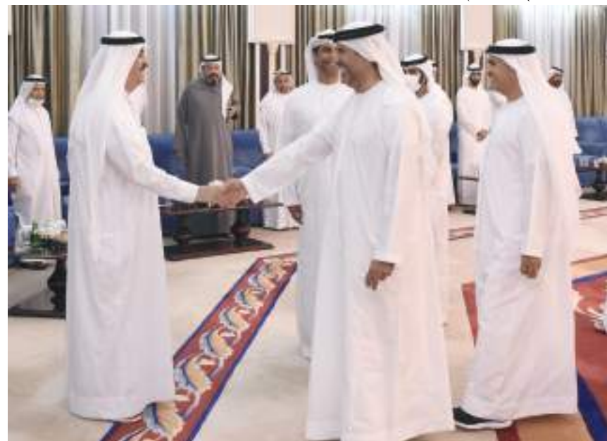
المجلس الأعلى للاتحاد

المجلس الأعلى للاتحاد . كما تقبل سموه التهاني والتبريكات بالشهر الفضيل من الشيوخ والمواطنين وأبناء القبائل ورجال الأعمال والتجار ورؤساء ومدراء الشركات العاملة بالدولة، والذين دعوا الله العلي العظيم أن يمن على سموه بموفقو الصحة والسعادة وعلى شعب الإمارات والأمميتين العربية والإسلامية باليمن والبركات.