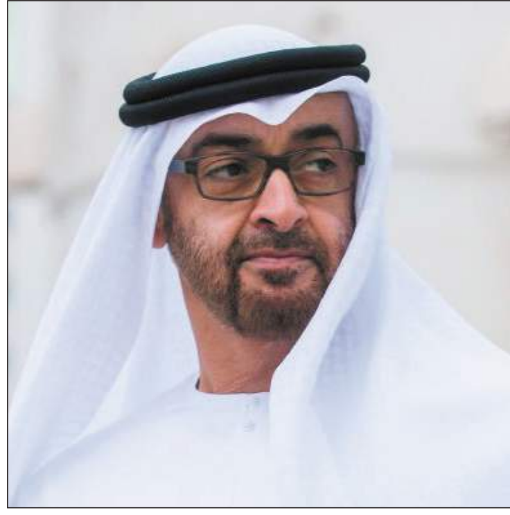
أبوظبي - الوحدة:

جدد صاحب السمو الشيخ محمد بن زايد آل نهيان، ولي عهد أبوظبي، نائب القائد الأعلى للقوات المسلحة، يوم الخميس بمناسبة «يوم الصحة العالمي»، التقدير للعقول والسواعد المخلصة التي وقفت بشجاعة في مواجهة تحدي «كورونا»، وأكد سموه في تغريدة عبر صفحته الرسمية بموقع تويتر على أهمية التعاون الدولي في مواجهة الأمراض والأوبئة، وتعزيز الاستثمار في الصحة، من أجل استدامة التنمية وسعادة البشرية. وقال سموه: «في يوم الصحة العالمي، نجدد التقدير للعقول والسواعد المخلصة التي وقفت بشجاعة في مواجهة تحدي «كورونا».. ونؤكد أهمية التعاون الدولي في مواجهة الأمراض والأوبئة، وتعزيز الاستثمار في الصحة، من أجل استدامة التنمية وسعادة البشرية».