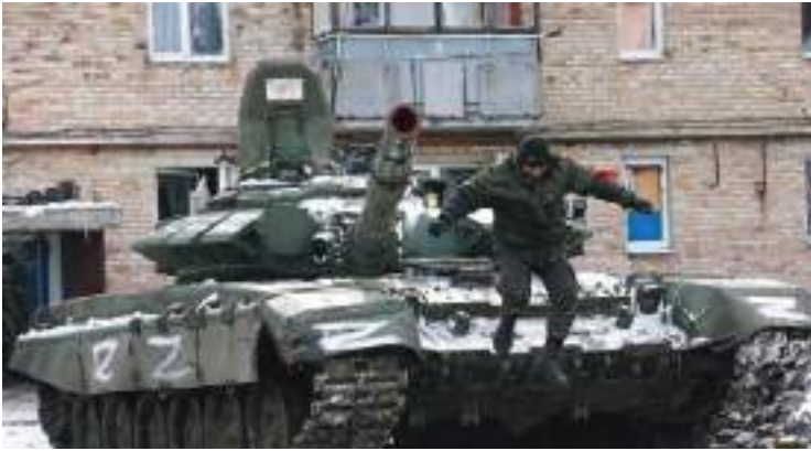
الليلة الماضية تدمير أربع قواعد لتخزين الزيوت ومواد التشحيم في محيط مدن ميكولايف وزابورجيه

وصرح المتحدث باسم الوزارة، إيجور كوناشينكوف، في موجز عقده صباح يوم الخميس، بأن القوات المسلحة الروسية واصلت خلال الليلة الماضية توجيه ضربات إلى مرافق البنى التحتية العسكرية الأوكرانية. ونقل موقع قناة "آر تي عربية" عنه القول: "بصواريخ عالية الدقة مطلقاً من الجو والبحر تم خلال