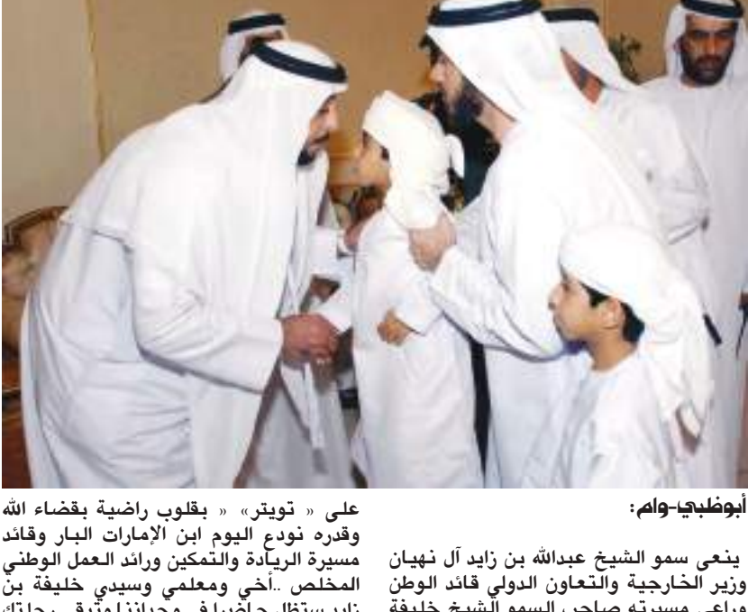
أبو ظبي- وام:

على « تويتر » بقلوب راضية بقضاء الله وقدره نودع اليوم ابن الإمارات البار وقائد مسيرة الريادة والتمكين ورائد العمل الوطني المخلص .. أخي ومعلمي وسيدي خليفة بن زايد ستظل حاضرا في وجداننا وتبقى رحلتك العامرة بالعطاء للوطن والأمة مسيرة خالدة تنير دروبنا لخدمة شعبنا .. تغمّد الله وبواسع رحمته».