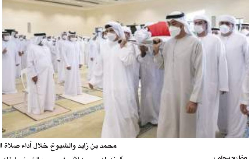
محمد بن زايد والشيوخ خلال أداء صلاة الجنازة على روح فقيد الوطن الشيخ خليفة

الصبر والسلوان في هذا المصاب الجلل « وأنا لله وأنا إليه راجعون » وشيع صاحب السمو الشيخ محمد بن زايد آل نهيان وسمو الشيوخ.. جثمان الفقيد الطاهر إلى مثواه الأخير ووري في مقبرة البطين في أبوظبي.