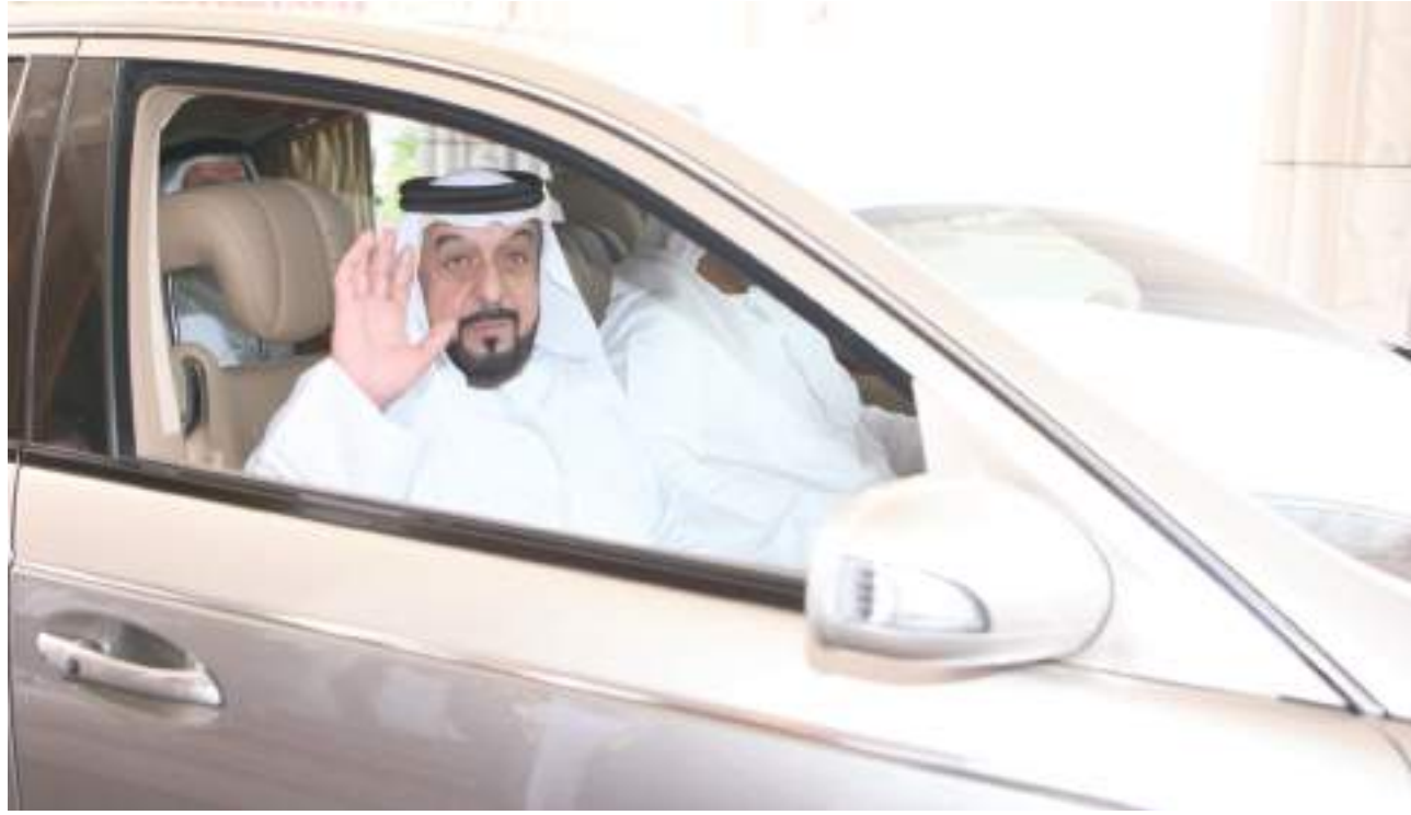
ولي عهد أبوظبي نائب القائد الأعلى للقوات المسلحة وعموم آل نهيان الكرام سائلا الله

وأعلن الديوان الحداد الرسمي وتنكيس الأعلام على المغفور له صاحب السمو الشيخ خليفة بن زايد آل نهيان رئيس الدولة « رحمه الله » مدة ٤٠ يوما اعتبارا من اليوم و تعطيل العمل في الدوائر والمؤسسات الاتحادية والمحلية والقطاع الخاص ٣ أيام اعتبارا من اليوم السبت المقبل « . تغمد الله الفقيد بواسع رحمته وأسكنه فسيح جناته وألهم عموم آل نهيان الكرام وشعب الإمارات جميل الصبر والسلوان .. إنا لله وإنا إليه راجعون . وتقدم صاحب السمو حاكم عجمان بصادق العزاء والمواساة إلى صاحب السمو الشيخ محمد بن زايد آل نهيان