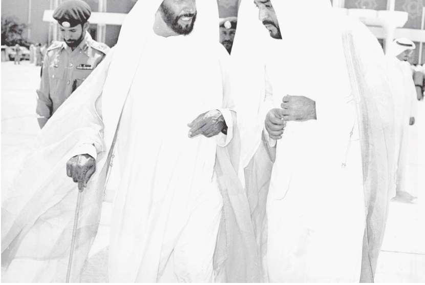
أبو ظبي- وام:

وقال سموه - في كلمة له - رحم الله قائد مسيرتنا ورجل التمكين والتنمية الفاتحة، المغفور له الشيخ خليفة بن زايد آل نهيان كان قامة إنسانية بأسفة، سطر لنا مسيرة بيضاء وقدم إنجازات تاريخية وضعت الإمارات في مقدمة دول العالم، عزأوتنا لوطننا راضيا مرضيا يوم الجمعة 13 مايو.