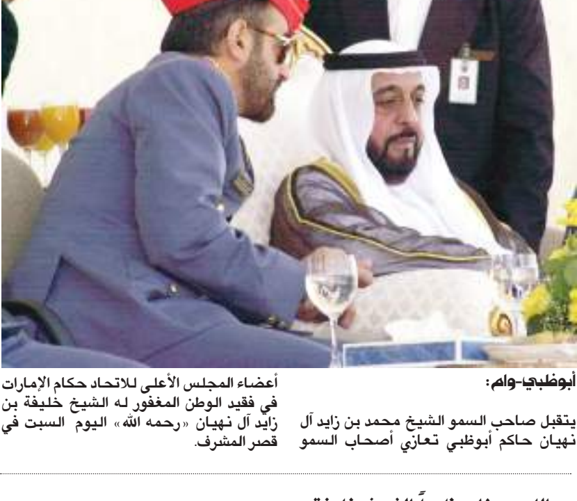
أبو ظبي- وام:

أعضاء المجلس الأعلى للاتحاد حكام الإمارات في فقيد الوطن المغفور له الشيخ خليفة بن زايد آل نهيان « رحمه الله » اليوم السبت في قصر المشرف.