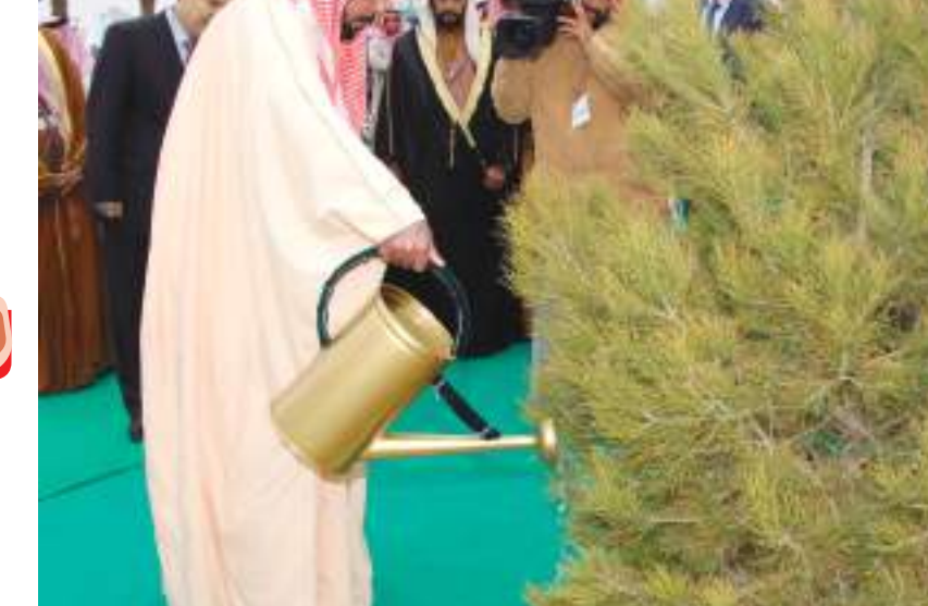
رأس الخيمة- وام:

ينعى سمو الشيخ محمد بن سعود بن صقر القاسمي ولي عهد رأس الخيمة ، قائد الوطن وراعي مسيرته صاحب السمو الشيخ خليفة بن زايد آل نهيان رئيس الدولة ، الذي انتقل إلى جوار ربه راضيا مرضيا يوم الجمعة 13 مايو.