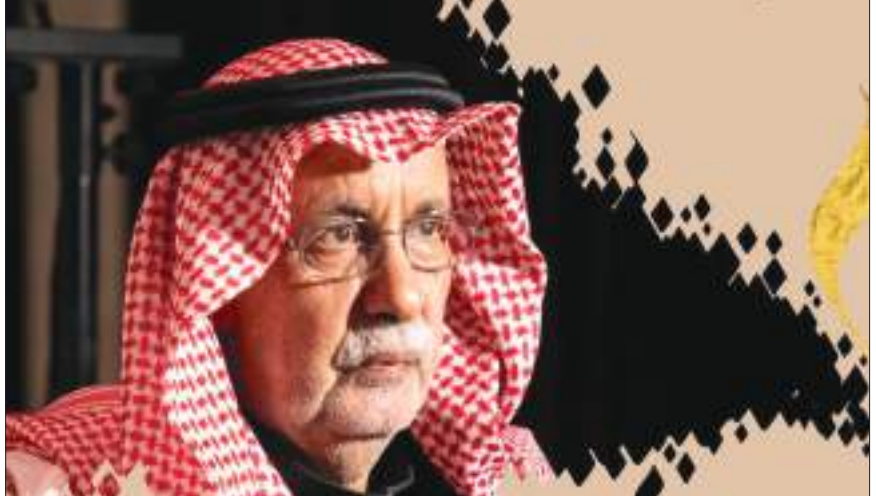
أبوظبي - الوحدة:

الدراسات والمشروعات البحثية المهمة التي أثرت الحراك الثقافي إقليمياً وعربياً. ومنحت الهيئة العلمية للجائزة ومجلس أمنائها الدكتور عبدالله الغدامي جائزة شخصية العام الثقافية نظير جهوده المتميزة في ميدان النقد الثقافي ودراسات المرأة والشعر والفكر النقدي «تمتمة ص 8»