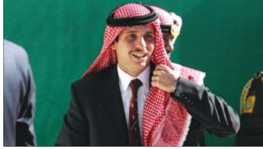
عمان-(د ب أ):

ووفق وكالة الأنباء الأردنية (بترا) يوم الخميس، وجه الملك رسالة للأسرة الأردنية الواحدة أكد فيها أن الأمير حمزة، وبعد عام ونيف من كشف تفاصيل قضية "الفتنة" العام الماضي، استنفذ خلالها كل فرص العودة إلى رشده والالتزام بسيرة أسرتنا».