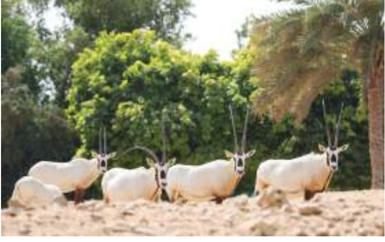
العربي التي أوشك بعضها على الانقراض وانقرض بعضها الآخر من البرية بشكل الانجرار غير المشروع والزحف العمراني بالانقراض.

والصيد الجائر، وفي إحصائية الحديقة للعام المنصرم ٢٠٢١ بلغ إجمالي المواليد ٤٨٤ منها ٢٦٣ مهدد بالانقراض تم إكثارها بمعابر عالمية وبأفضل الممارسات لإدارة ورعاية الحيوانات، حيث تعد حديقة الحيوانات بالعين وهي الأكبر في الشرق الأوسط؛ مركزاً عالمياً لبحوث حماية وإكثار الحيوانات المهددة بالانقراض بالتعاون مع شركات ومؤسسات عدة وتمتد جهود حديقة الحيوانات بالعين في حماية الأنواع المهددة بالانقراض إلى التوعية والتعليم والثقافة من خلال الفعاليات والتجارب والمخيمات الطلابية الموسمية وتدريب طلبة الجامعات والزيارات التعليمية التي تفوق سنويا أربعين ألف زيارة، وتثقيف وتوعية الجمهور بكافة شرائحهم، برفقة مرشدين ومختصين إماراتيين في مجال صون الطبيعة وحماية الأنواع المهددة بالانقراض.