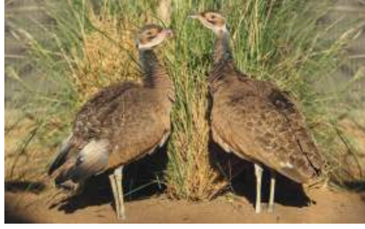
ورعاية فصائل نادرة من الحيوانات المهددة بالانقراض بشكل عالي الخطورة مثل غزال الداما ومها أبوعدس وقط الرمال العربي والنمر العربي ومها أبو حراب والطهر

وكانت انطلاقا من حديقة من خلال برامج حماية المها العربي والحبارى في عام ١٩٦٨ بتوجيهات ورعاية المغفور له الشيخ زايد بن سلطان آل نهيان رحمه الله، رجل البيئة الأول وصاحب الفكر المتقدم في الحفاظ على الحياة البرية، حتى أصبحت الحديقة الآن موطناً آمناً لأكثر من ٤٠٠٠ حيوان ٣٠٪ منها مهدد بالانقراض؛ لا يقتصر إكثارها على زيادة أعدادها فحسب وإنما الحفاظ على الأصول الوراثية لها وتنوعها وتواتر جهود الحديقة في إكثار