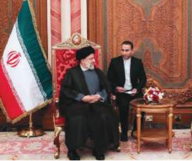
سبل دعم وتعزيز علاقات الصداقة المتينة التي تربط

سافرا للقانون الدولي وقرارات الشرعية الدولية. وطالبت الرئاسة الفلسطينية الإدارة الأمريكية بالتدخل العاجل لوقف الاعتداءات الإسرائيلية على أبناء الشعب الفلسطيني ومقدساتهم، مؤكدة أن القدس "ستبقى فلسطين، وسبقي أهلها بمسيحييه ومسلميه، ويكفانسه ومساجده عنوان الحق والصمود الفلسطيني على أرضه التي لن يتخلى عن ذرة من ترابها الطاهر". وألغت محكمة الصلح الإسرائيلية في القدس اليوم قيوداً مفروضة على عدد من اليهود تشمل أوامر إبعاد عن البلدة