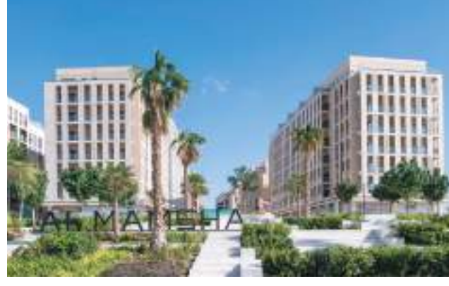
جانب من المشروع

كشفت مجموعة «ألف» الشركة المتخصصة في التطوير العقاري في إمارة الشارقة عن اكتمال إنجاز ٩٢ بالمائة من المرحلة الثانية لمشروع «الممشى» بالشارقة المشروع المتعدد الاستخدامات وذلك بعد انتهاء إنجاز المرحلة الأولى بالكامل بنسبة ١٠٠ بالمائة وتسليم ٨٢ بالمائة منها للمستثمرين حيث تمت المرحلتين الأولى والثانية من «أسواق الممشى» ضمن مشروع «الممشى» على ١,٥٧٦ وحدة سكنية موزعة على ١٥ مبنى.