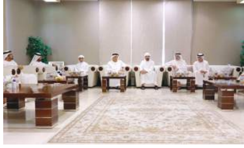
حمدان بن محمد خلال تقديم واجب العزاء في وفاة ميثاء مطر الطاير