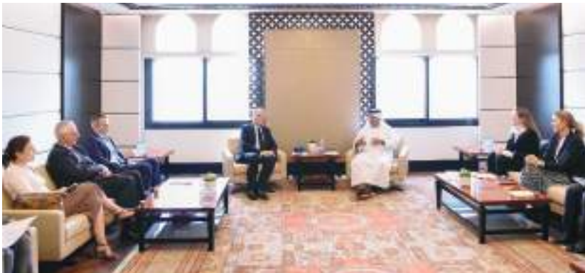
أنور قرقاش خلال لقائه الوفد الدنماركي