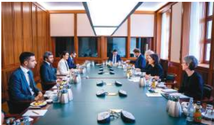
عبدالله بن زايد خلال لقائه وزيرة خارجية ألمانيا في برلين