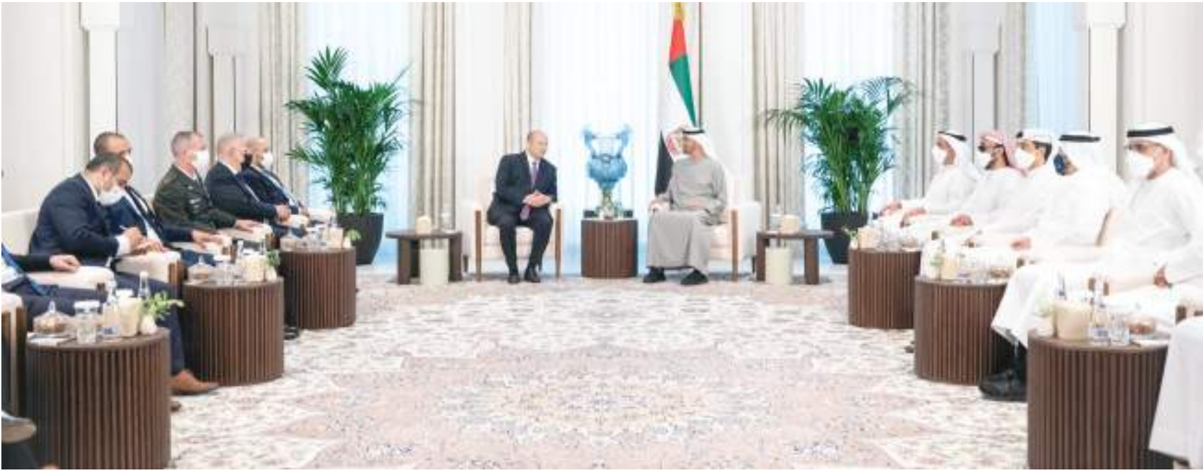
رئيس الدولة خلال استقباله رئيس وزراء إسرائيل