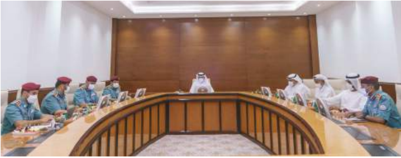
ولي عهد الشارقة خلال ترؤسه اجتماع مجلس أكاديمية العلوم الشرعية

ترأس سمو الشيخ سلطان بن محمد بن سلطان القاسمي ولي عهد ونائب حاكم الشارقة، رئيس مجلس أكاديمية العلوم الشرعية، صباح الخميس اجتماع المجلس، الذي عقد بمقر الأكاديمية في المدينة الجامعية بالشارقة. وأشاد سموه في بداية الاجتماع، بجهود الأكاديمية التي ساهمت في تجديد الاعتماد الأكاديمي من وزارة التربية والتعليم، واهتمامها بالبحث العلمي والمخرجات التدريبية، حيث استطاعت الأكاديمية تحقيق معايير التميز في التعليم والجودة في كافة برامجها. وأثنى سموه على إنجازات إدارة الأكاديمية وهيئاتها التعليمية والتدريبية، وسعيهم الدائم والحديث لتطوير البرامج في مختلف المجالات التعليمية والبحثية والتدريبية والإدارية، وبالمستويات العليا التي حققتها الأكاديمية باعتبارها واحدة من أهم المؤسسات التعليمية الأمانية على مستوى الدولة والمنطقة. وناقش المجلس عدداً من الموضوعات المدرجة على جدول أعماله المعنية بشؤون الأكاديمية في الجوانب الإدارية والأكاديمية والتدريبية، كما طلع على أبرز الإنجازات والمشروعات التي تعمل عليها الأكاديمية. واعتمد المجلس خلال الاجتماع قبول دعة جديدة من الطلبة الضباط في برنامج البكالوريوس في العلوم الشرعية، واطلع على الشروط الجديدة التي استحدثتها الأكاديمية لتسجيل وقبول الطلبة الجدد، بما يتماشى