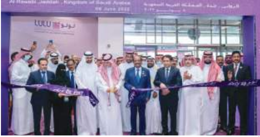
أبوظيجيا - (الوحدة):

أعلنت مجموعة «اللؤلؤ هايبر مارك»، افتتاح أحدث متاجرها في منطقة الروابي بمدينة جدة في المملكة العربية السعودية، وذلك بحضور صالح بن علي التركي، أمين محافظة جدة ومكة المكرمة، ويوسف علي موسليام، رئيس مجلس إدارة مجموعة «اللؤلؤ» وشخصيات أخرى. ويأتي افتتاح الفرع الجديد في إطار سعي المجموعة، لتعزيز حضورها في دول مجلس التعاون الخليجي، ويعتبر الهايبر مارك الجديد الفرع رقم ٢٧ للمجموعة داخل المملكة العربية السعودية ورقم ٢٣٣ عالمياً ويتكون المتجر الجديد البالغ مساحته ١٦٨ ألف قدم مربعة من طابق واحد، ويحتوي على المنتجات الزراعية السعودية، إضافة إلى أسماك البحر الأخرى واللحوم المحلية والقهوة السعودية والمجانج والفواكه والخضروات المزروعة