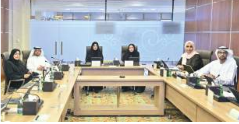
خلال اجتماع اللجنة