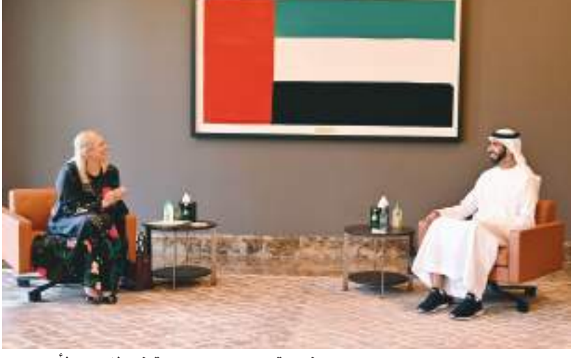
شخبوط بن نهيان خلال استقباله مفوضة الشراكات الدولية في الاتحاد الأوروبي