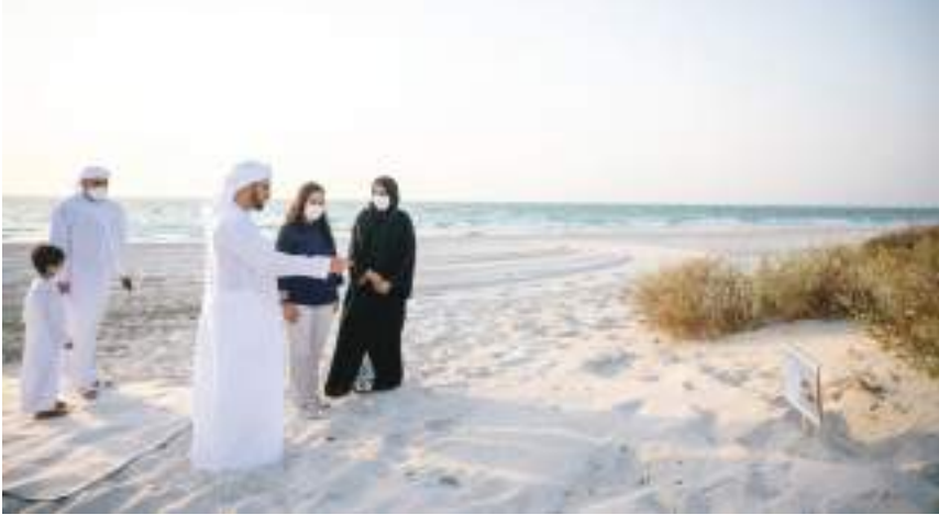
حمدان بن زايد خلال مشاركته في عملية إطلاق السلاحف

عليها في مياه إمارة أبوظبي، حيث أظهرت نتائج الدراسات تحسناً في أعدادها واستقرارها في الإمارة على مدار السنوات الماضية. ويتواجد في مياه أبوظبي نوعان رئيسيان من السلاحف البحرية، وهما سلحفاة «منقار الصقر» والسلحفاة «الخضراء» وتقدر أعدادها معا بنحو ٥٠٠٠ سلحفاة.