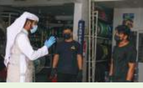
الظفرة - الوحدة:

نفذت بلدية منطقة الظفرة حملة السلامة والوقاية من الحرائق تحت شعار «السلامة والوقاية من الحرائق» في منطقة الظفرة استهدفت الملاك والعاملين في المنشآت والمحلات غير الغذائية. وتم خلالها التفتيش على 108 من المحلات والورش، وإسرفت عن تحرير 16 إنذاراً وتوعية 317 عاملاً. وتهدف الحملة إلى الحفاظ على سلامة العاملين والوقاية من الحرائق وتحفيز الرقابة الفعالة على المظهر العام والصحة العامة.