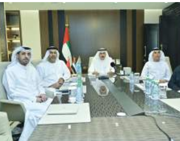
للدساتير الوطنية، والتشريعات لكلا البلدين والتي تعكس تعزيز صيانة حقوق الإنسان.

مختلف المجالات وتبادل الخبرات المعرفية البرلمانية بين الجانبين، وتعزيز التشاور وتبادل الرأي حيال مختلف القضايا ذات الأهتمام المشترك. وأكد الجانبان أهمية تعزيز أطر التعاون البرلماني بين المجلس الوطني الاتحادي لدولة الإمارات العربية المتحدة وبرلمان أمريكا اللاتينية والكاريبي من خلال مشاركة الشعبة البرلمانية الإماراتية «كعضو مراقب» لدى برلمان أمريكا اللاتينية والكاريبي. وشدد على الالتزام المشترك للطرفين بتقوية الحوار والتشاور البرلماني، للاستفادة من الفرص والإمكانيات المتاحة لتطوير أوجه العلاقات الثنائية بين الجانبين تأكيداً على مذكرة التفاهم الموقعة بين الجانبين في ديسمبر ٢٠١٦ وما تضمنته من أهداف سبغية إلى تطوير العلاقات البرلمانية، وتبادل الخبرات البرلمانية المشتركة ترسيخاً لأسس الاحترام المتبادل والواجب