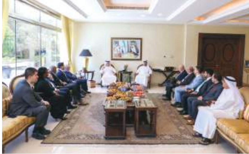
حاكم رأس الخيمة خلال الاستقبال

ونص المرسوم على أن يرقى سعادة الشيخ ماجد بن سلطان بن صقر القاسمي إلى درجة رئيس دائرة على نظام الوظائف الخاصة في حكومة الشارقة. ويعين رئيسا لدائرة شؤون الضواحي والقرى، ويكون عضواً في المجلس التنفيذي لإمارة الشارقة. من ناحية ثانية أصدر صاحب السمو الشيخ الدكتور سلطان بن محمد القاسمي عضو المجلس الأعلى حاكم الشارقة المرسوم الأميري رقم ٤١/ بشأن نقل وتعيين مستشار بمكتب سمو الحاكم. ونص المرسوم على أن يُنقل سعادة خميس بن سالم السويدي من دائرة شؤون الضواحي والقرى إلى مكتب سمو الحاكم ويعين مستشاراً بدرجة رئيس دائرة.