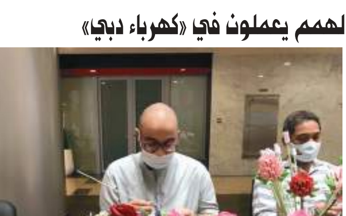
مكان للجميع» التي أطلقها سمو الشيخ حمدان بن محمد بن راشد آل مكتوم ولي عهد دبي رئيس المجلس التنفيذي والتي تهدف إلى تحويل دبي بالكامل إلى مدينة

السمو الشيخ محمد بن راشد آل مكتوم نائب رئيس الدولة رئيس مجلس الوزراء حاكم دبي «رعاه الله» بهدف إيجاد مجتمع وادعج خال من الحواجز يضمن التمكين والحياء الكريمة لأصحاب الهمم وأسرمهم ومبادرة «مجتمعي»