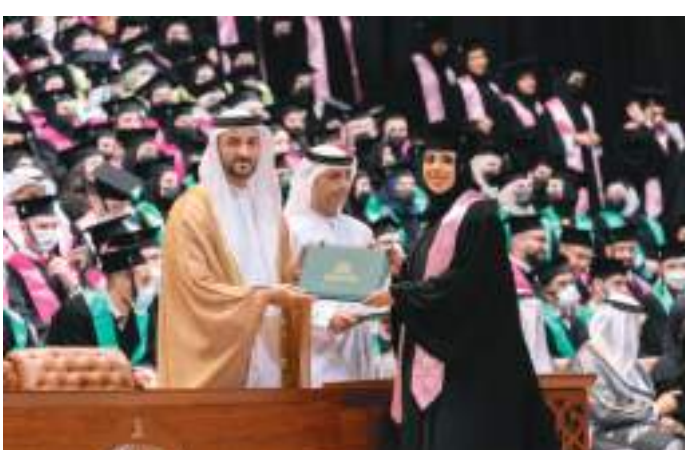
سلطان بن أحمد القاسمي خلال حضوره حفل التخرج

المؤسسات التي ستحتضن أمثالكم من المخلصين // وكان حفل التخرج قد أستهل بتلاوة آيات من الذكر الحكيم، ألقى بعدها الدكتور حميد مجول النعيمي مدير الجامعة كلمة قدم فيها الشكر والتقدير إلى سمو الشيخ سلطان بن أحمد بن سلطان القاسمي، على كريم تفضله برعاية وتشريف الحفل وتكريم الخريجين والخريجات، وباركاً لسموه تخريج هذه الكوكبة الجديدة من أصحاب المهن الطبية والصحية. وتناول مدير الجامعة خلال كلمته الجهود الكبيرة لصاحب السمو الشيخ الدكتور سلطان بن محمد القاسمي، عضو المجلس الأعلى، حاكم الشارقة، ومؤسس جامعة الشارقة، في وضع الأسس الصحيحة لتأهيل الطلبة في مختلف المهن الطبية والصحية، عبر المجمع الطبي الكبير الذي يحتضن كليات الطب وطب الأسنان