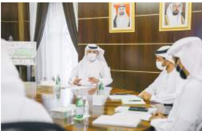
ولي عهد الشارقة خلال ترؤسه الاجتماع

واطلع المجلس على سير العمل في مشروع إعداد الأدلة الإرشادية للتخطيط العمراني والحضري والذي سيسهم في تنفيذ كافة المشروعات بصورة متكاملة وبمواصفات ومعايير