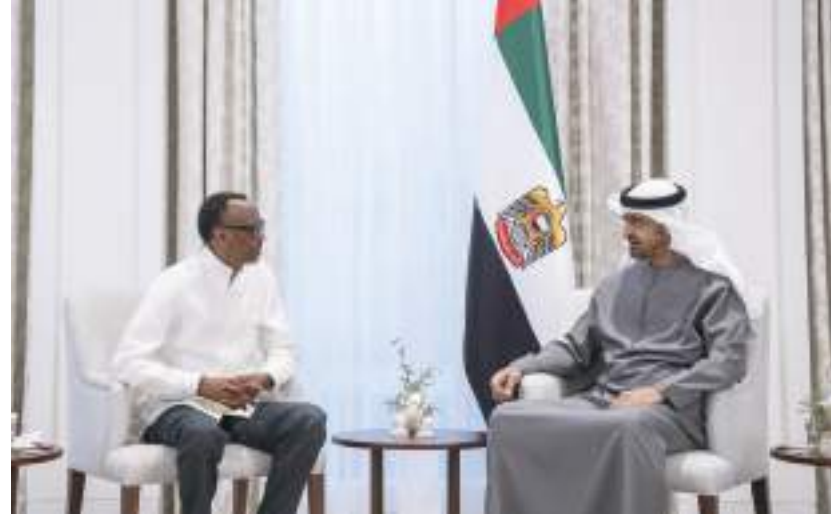
رئيس الدولة خلال استقباله رئيس رواندا

استقبل صاحب السمو الشيخ سعود بن صقر القاسمي، عضو المجلس الأعلى، حاكم رأس الخيمة، في قصر سموه بمدينة صقر بن محمد أمس، أصحاب السعادة رؤساء البعثات الدبلوماسية لأمريكا اللاتينية ومنطقة البحر الكاريبي لدى الدولة، الذين قدموا للسلام على سموه. ورحب صاحب السمو حاكم رأس الخيمة، برؤساء البعثات الدبلوماسية، وتبادل معهم