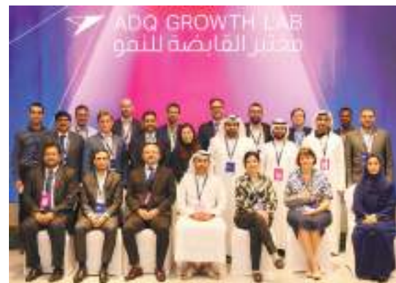
مختبر القابضة للنمو

أطلقت "القابضة" ADQ، وهي شركة استثمارية قابضة في إمارة أبوظبي، يوم الأربعاء "مختبر القابضة للنمو"، وهو مجتمع حديث للمبتكرين من كافة شركاتها، مما يعكس التزام الشركة بالابتكار والبحث والتطوير، ويدعم نهجها في التركيز المباشر على إضفاء القيمة وأحداث أثر مستدام ضمن القطاعات ذات الأولوية في اقتصاد دولة الإمارات العربية المتحدة. وستستثمر "القابضة" ADQ - 100 مليون درهم إماراتي في تمويل مشاريع بحث وتطوير تجريبية في المجتمع الجديد، ضمن إطار مختبر القابضة للنمو، كما ستخصص تمويل إضافية لتسريع تجارب الذكاء الاصطناعي والتمتع واعتمادها، من خلال إثبات المفاهيم المبتكرة والتجريبية. وسيعمل مجتمع مختبر القابضة للنمو على