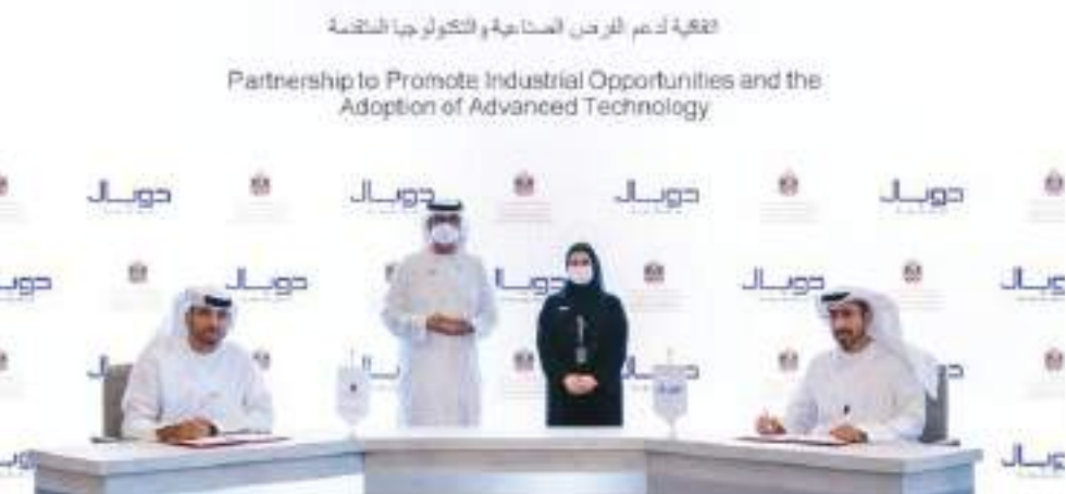
توقيع مذكرة التفاهم بين الفرع الصناعي والتكنولوجيا المتقدمة

Partnership to Promote Industrial Opportunities and the Adoption of Advanced Technology