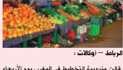
الرباط - (وكالات):

قالت منبوية التخطيط في المغرب يوم الأربعاء إن مؤشر أسعار المستهلكين في البلاد ارتفع ٥,٩ بالمئة على أساس سنوي في مايو أيار. وارتفعت أسعار المواد الغذائية بنسبة ٨,٤ بالمئة، بينما زادت أسعار المواد غير الغذائية ٤,١ بالمئة، وعلى أساس شهري ارتفع المؤشر ٣,٣ بالمئة. وزاد التضخم الأساسي، الذي يستثني أسعار السلع المتقلبة، ٥,٦ بالمئة على أساس سنوي و١,٢ بالمئة على أساس شهري.