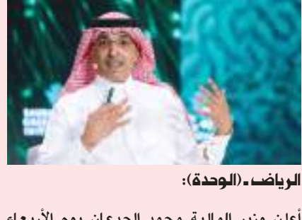
الرياض - (الوعدة):

أعلن وزير المالية محمد الجديعان يوم الأربعاء اختتام الاجتماع الوزاري الثالث والأربعين لصندوق الأوبك للتنمية الدولية بمشاركة وزراء الدول الأعضاء. وأكد الجديعان خلال الاجتماع على أهمية تعزيز الأثر الإنمائي وانتشاره وتعزيز التعاون بين الصندوق والشركاء الآخرين.