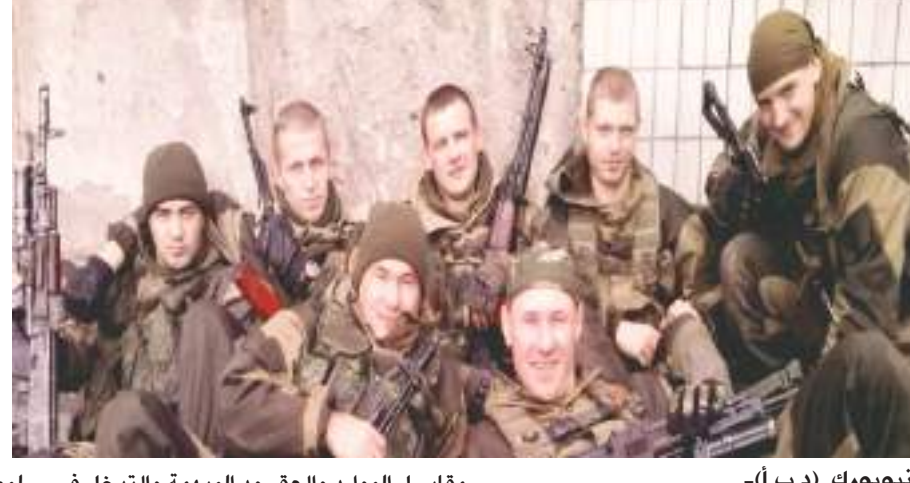
نيويورك (د ب أ) -

مقابل الموارد والعمود المبهمة والتدخل في الانتخابات والتضليل».