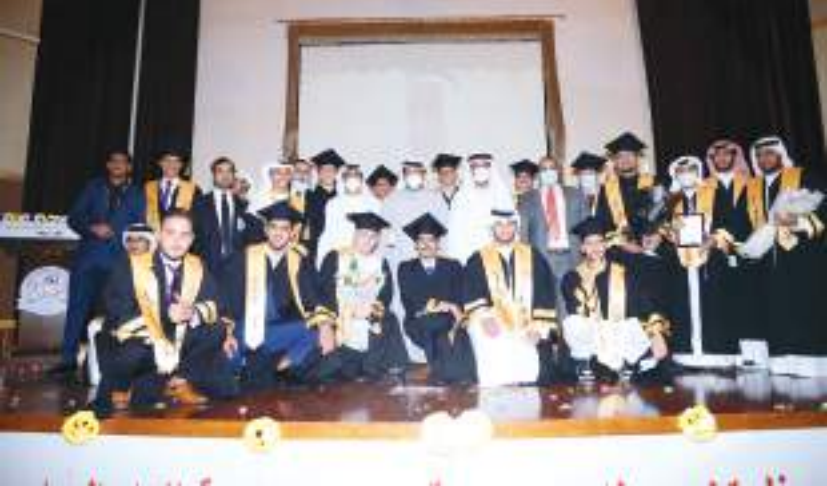
سعيد بن طحنون خلال حضوره احتفال التخريج

ودعمهم المتواصل لتطوير منظومة التعليم في الدولة. وأكد معاليه دور باني نهضتنا المغفور له بان الله تعالى الشيخ زايد بن سلطان آل نهيان - طيب الله ثراه الذي غرس بذور التميز في الأجيال والذي سار على دبره خلفه صاحب السمو الشيخ محمد بن زايد آل نهيان رئيس الدولة خير خلف لخير سلف ليواصل المسيرة في رعاية الإنسان الذي حرص المغفور الشيخ زايد بن سلطان آل نهيان طيب الله ثراه على رعايته من خلال تنشئة هذه الأجيال وبشكل متوازن مع العلم وصناعة المستقبل .. وأن التعليم يضمن حقوق الطلبة في تحقيق حلمهم العملي والمهني، وهنا معاليه الخريجين متمنيا لهم دوام التوفيق والنجاح منيذا بجهود العاملين من الكوادر الإدارية والتربسية التي كان لها أثر عظيم في دفع مسيرة التعليم نحو آفاق التطوير والتجديد.