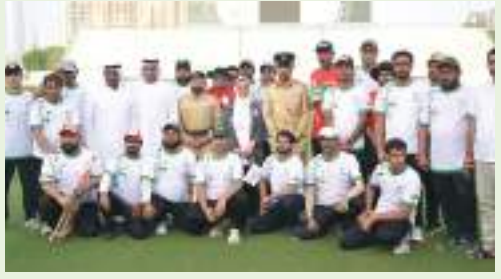
دبي - وام :

شارك 2036 مشاركاً في فعاليات "اليوم الأولمبي" الذي نظّمته اللجنة الأولمبية الوطنية بالتعاون مع القيادة العامة لشرطة دبي ممثلة في نادي ضباط شرطة دبي، والذي استضاف الحدث مساء الخميس الماضي وسط حضور مكثف من جميع فئات المجتمع ومن مختلف الجنسيات الذين شاركوا في العديد من الأنشطة الرياضية، وذلك تزامناً مع الحدث الذي تحتفي به جميع اللجان الأولمبية حول العالم، والذي أقيم هذا العام تحت شعار "الرياضة من أجل السلام".