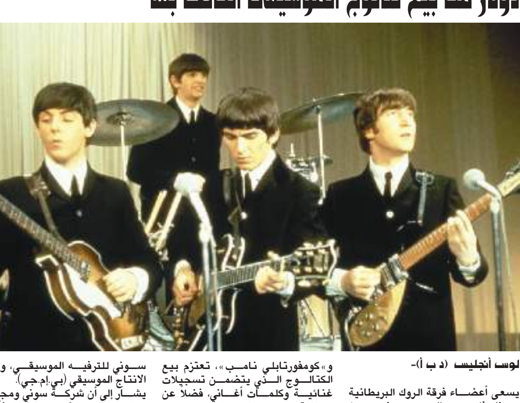
لوس أنجليس (د ب أ) -

«كومفورتابل نامب»، تعزز بيع الكتالوج الذي يتضمن تسجيلات غنائية وكلمات أغاني، فضلاً عن إمكانية تصميم منتجات تحمل اسم الفرقة الموسيقية.