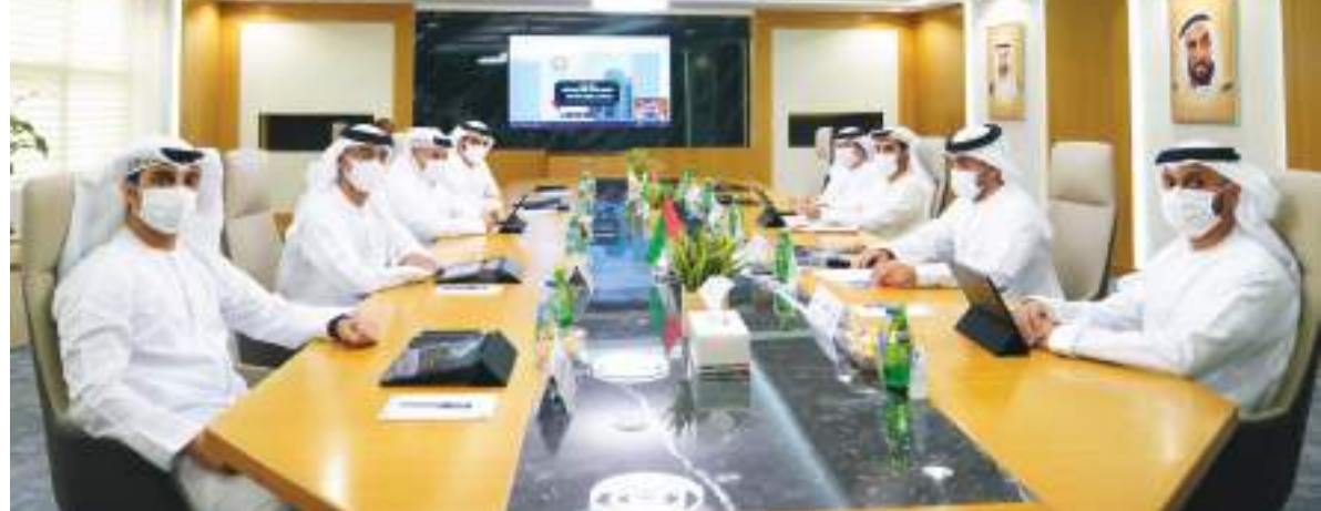
دبي/ وام :

وبطولة اتحاد غرب آسيا التي تستضيفها الدولة في شهر مارس المقبل، ونهائيات كأس آسيا في شهر يونيو المقبل.