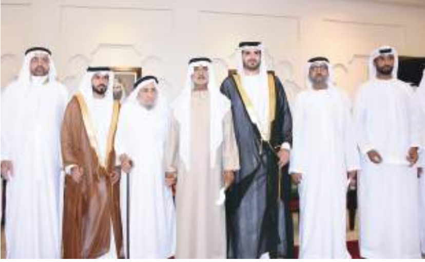
نهيان بن مبارك خلال حضوره أفراح البلوشي والعمور في أبوظبي

أبوظبي-وام: عبد المنان العمور وعلي عبدالله علي كريمة يوسف أحمد البلوشي . كما حضر الحفل الذي أقيم بمجلس المشرف بأبوظبي الشيخ محمد بن نهيان بن مبارك آل نهيان وعدد من كبار الشخصيات وكبار ضباط القوات المسلحة والشرطة وجمع غفير من الأهل والأصدقاء فيما تخلل الحفل فقرات تراثية وشعبية.