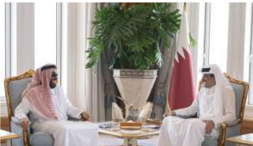
أمير قطر خلال استقباله طحنون بن زايد