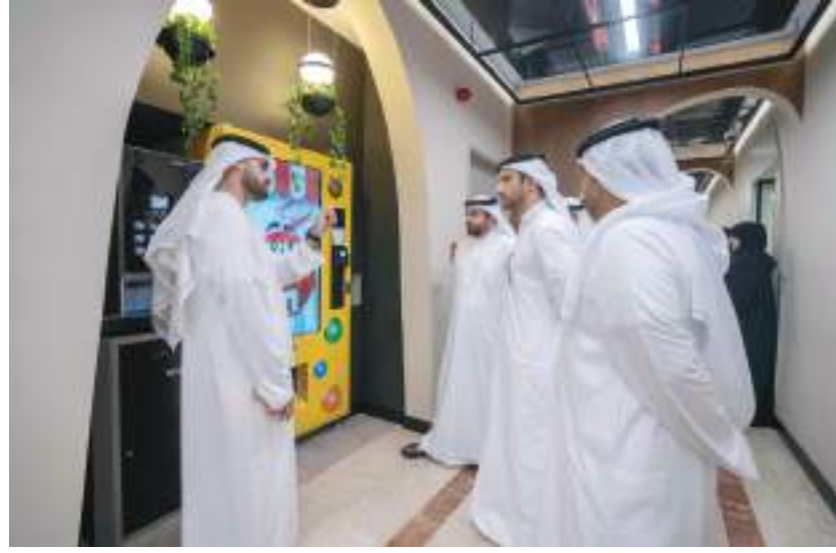
سلطان بن أحمد القاسمي خلال افتتاح المبنى الإداري