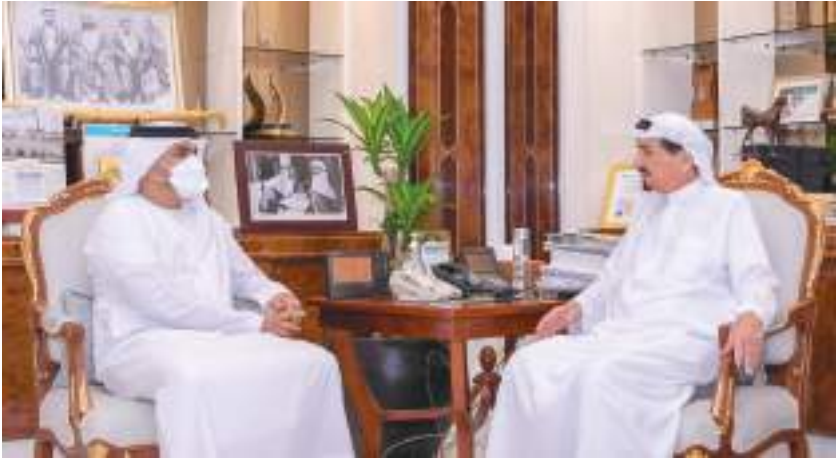
حاكم عجمان خلال اللقاء