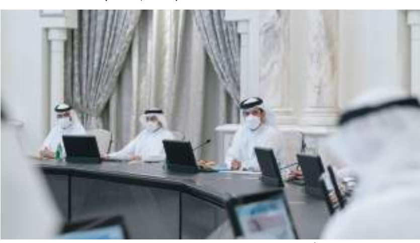
سلطان بن أحمد القاسمي خلال ترؤسه اجتماع المجلس التنفيذي