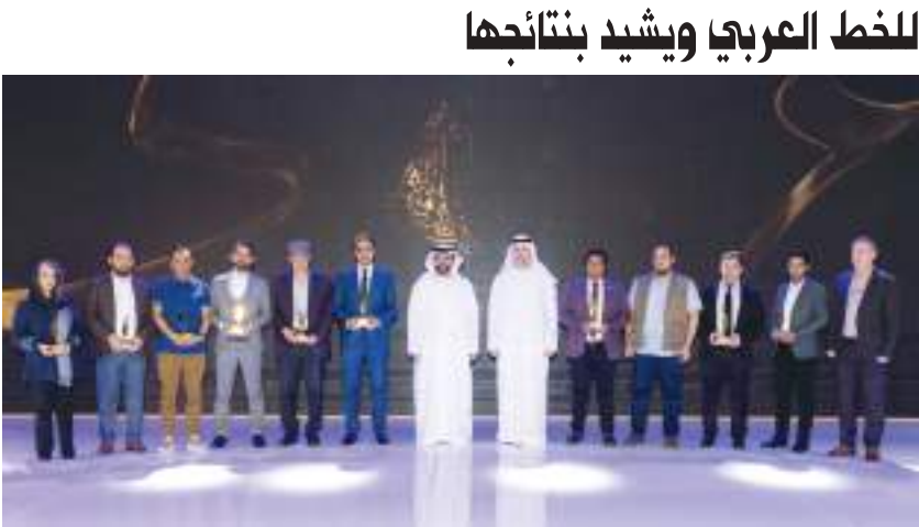
ولي عهد الفجيرة في صورة تذكارية خلال تكريم الفائزين