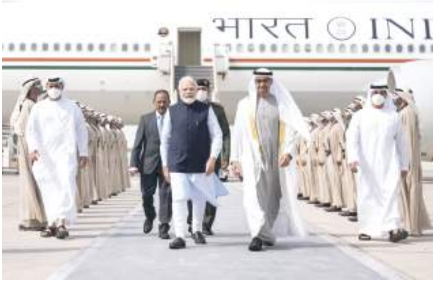
رئيس الدولة خلال استقباله رئيس وزراء الهند

وشعبها وتمنى لبلده الصديق دوام التقدم والازدهار .. منوها بالعلاقات الإستراتيجية