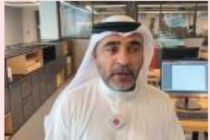
الشارقة - وام :

يستقطب مجمع الشارقة للابتكار يستقطب كبرى الشركات العالمية المتخصصة في الطباعة ثلاثية الأبعاد. وضمن مساعي المجمع ليكون من أكبر منصات تكنولوجيا الطباعة ثلاثية الأبعاد والأكثر تقدماً في المنطقة عمل المجمع وبالتعاون مع كبرى الشركات العالمية المتخصصة على إنشاء وحدة متخصصة بالتصنيع المضاف تضم مختبرات ضخمة متعددة الاختصاصات تحتوي على أفضل التقنيات والمكينات المتخصصة الأكثر تقدماً في مجال الطباعة ثلاثية الأبعاد، وقد استقطب المجمع مؤخراً عدد من الشركات العالمية الرائدة في هذا المجال، حيث تعمل شركة جنرال إلكتريك GE/ ضمن وحدة التصنيع المضاف في المجمع من خلال عدد من الأجهزة المتطورة في هذا المجال وهي شركة صناعية وتكنولوجية أمريكية ضخمة متعددة الجنسيات.