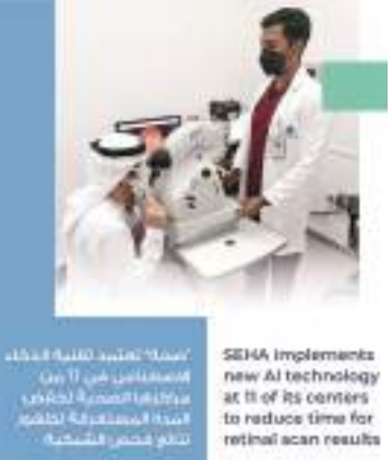
SEHA implements new AI technology at 11 of its centers to reduce time for retinal scan results

تعمد شركة أبوظبي للخدمات الصحية «صحة» تقنيات الذكاء الاصطناعي في ١١ من مراكزها الصحية لتسريع قراءة وتحليل نتائج صور فحوصات شبكية العين.