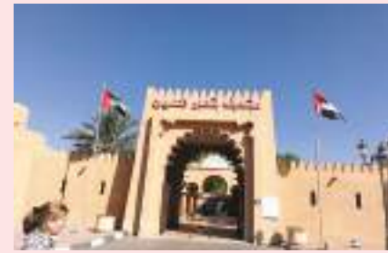
متحف العين .. ذاكرة الإمارات