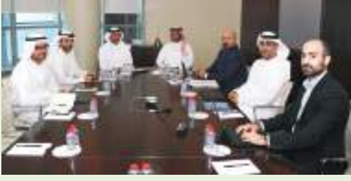
ديجا - وام:

أكد سعادة الشيخ سهيل بن بطي آل مكتوم، المدير التنفيذي لقطاع التنمية الرياضية في الهيئة العامة للرياضة، أهمية تعزيز التعاون مع اتحادات الرياضات ذات الأولوية كونها تمثل شريكا أساسيا في تحقيق أهداف استراتيجية القطاع الرياضي 2032 لتوسيع المشاركة في الألعاب الأولمبية وتعزيز فرص الإمارات في تحقيق إنجازات دولية. جاء ذلك خلال اجتماع عقده سعادته بمقر الهيئة مع الشيخ أحمد بن محمد بن حنتر آل مكتوم، رئيس اتحاد الإمارات للرماية، بحضور بعض مسؤولي الجهاتين.