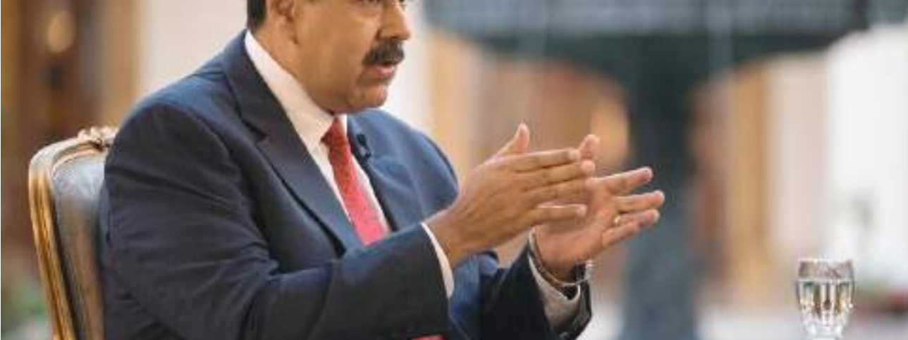
تعد الزيارة هي الخامسة إلى المملكة للرئيس نيكولاس مادورو منذ توليه منصبه في مارس ٢٠١٣ كما أنها تأتي بعد جولة له الشهر الماضي وشملت كلا من قطر والكويت وتركيا والخارج منذ زيارته لروسيا في عام ٢٠١٩.

قال «إن تعزيز العلاقات الثنائية بين البلدين في مختلف المجالات من خلال اللجان المشتركة ستحتل حيزاً مهماً في مناقشات الجانبين».