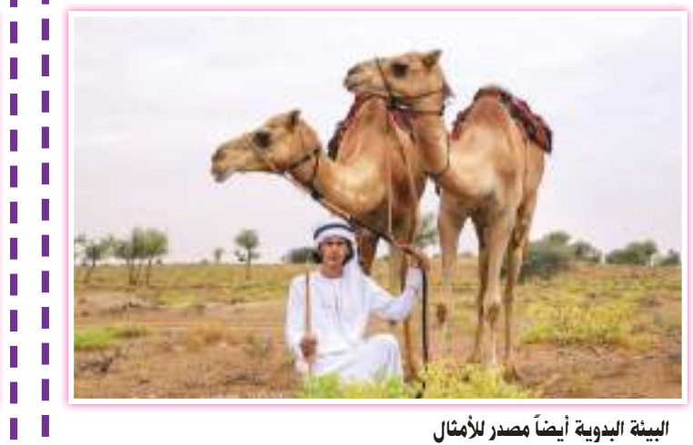
البيئة البدوية أيضاً مصدر للأمثال