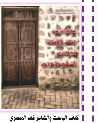
كتاب الباحث والشاعر فهد المعمرى

أعلام وسير بقلم الشاعر والكاتب أنور بن حمدان الزعاجي