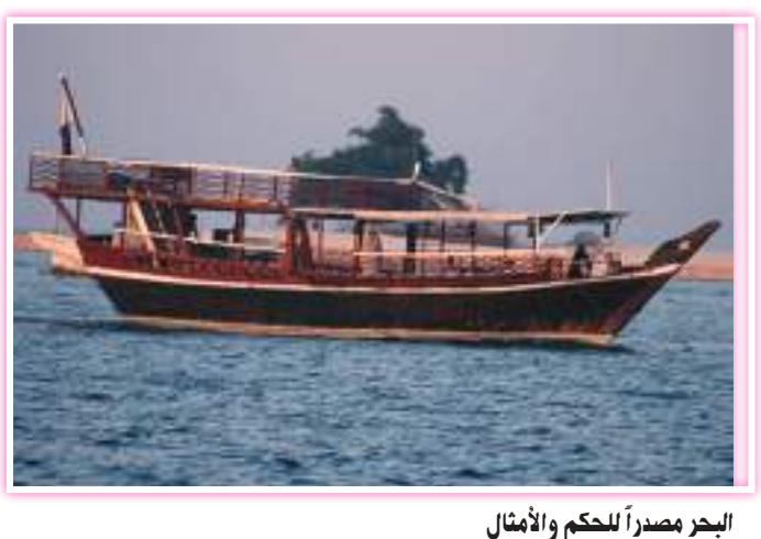
البحر مصدر الحكم والأمثال