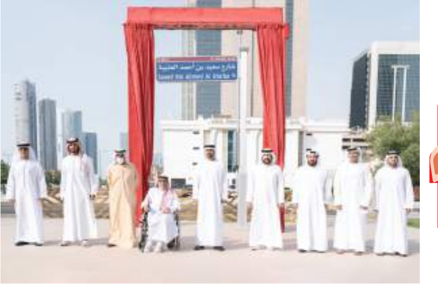
ذياب بن محمد بن زايد خلال تدشين شارع «سعيد بن أحمد العتيبة»