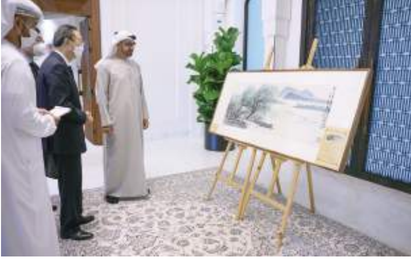
رئيس الدولة خلال استقباله المبعوث الخاص للرئيس الصيني