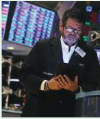
أبوظبي - (وام):

هبطت الأسهم الأمريكية بنحو حاد في تداولات شهر يونيو الماضي بسبب المخاوف من الرفع المستمر في أسعار الفائدة للسيطرة على معدلات التضخم قد يقود الاقتصاد العالمي إلى الركود. ورفع الفيدرالي الأمريكي منتصف الشهر الماضي، سعر الفائدة بمقدار 75 نقطة أساس، في أكبر زيادة منذ عام 1994، وذلك للمرة الثالثة خلال العام الحالي. واتخذت البنوك المركزية حول العالم خطوات مماثلة برفع أسعار الفائدة بما في ذلك بنك إنجلترا الذي رفعها للمرة الخامسة على التوالي، بينما رفعها البنك المركزي السويسري للمرة الأولى منذ 15 عامًا.