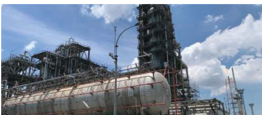
طوكيو - (وكالات):

يوميين، لكن التكتل تجنب مناقشة سياسة الإنتاج بدءاً من سبتمبر أيلول وما بعده. وكان أوبك+ قد قرر زيادة الإنتاج شهريا بمقدار 648 ألف برميل يومياً في يوليو تموز وأغسطس آب في زيادة عن خطة سابقة بزيادة الإنتاج 432 ألف برميل يومياً على أساس شهري. ويقوم الرئيس الأمريكي جو بايدن بزيارة إلى الشرق الأوسط في منتصف يوليو تموز