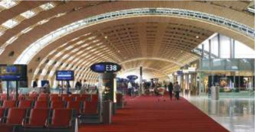
باريس - (وكالات):

تتأثر مطارات فرنسية عدة بينها مطاري شارل ديغول و"أورلي" قرب باريس، يوم الجمعة، وفي عطلة نهاية الأسبوع، بإضرابات جديدة، قبيل بدء موسم الصيف السياحي. وتم إلغاء نحو 17% من الرحلات المغادرة أو القادمة من مطار شارل ديغول وإليه بين الساعة السابعة صباحاً والثانية بعد الظهر، بحسب الإدارة العامة للطيران المدني. وطلبت الهيئة إلغاء رحلات احترازية ستمثل 10% من حركة الطيران في هذا المطار الجمعة، كتدبير احترازي يتعلق بالسلامة بسبب إضراب عناصر الإطفاء منذ الخميس للمطالبة بتحسين الرواتب، ما يفرض إغلاق جزء من المدرج في أكبر مطار في البلاد.