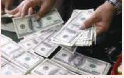
ملوكيو - وكالات:

أدت المخاوف حيال حدوث ركود عالمي إلى ارتفاع اليين الياباني والدولار الأمريكي باعتبارهما ملائمين أمنين يوم الجمعة بينما انخفض الدولار الأسترالي الحساس للمخاطر إلى أدنى مستوى في عامين. وصعد اليين إلى ١٣٥,١٥ مقابل الدولار، مبتعداً عن المستوى المتدني الذي سجله في منتصف الأسبوع عند ١٣٧,١٧، والذي كان أضعف مستوياته منذ ٢٤ عاماً. وارتفع مؤشر حيال حدوث ركود عالمي إلى ارتفاع اليين الياباني والدولار الأمريكي باعتبارهما ملائمين أمنين يوم الجمعة بينما انخفض الدولار الأسترالي الحساس للمخاطر إلى أدنى مستوى في عامين. وصعد اليين إلى ١٣٥,١٥ مقابل الدولار، مبتعداً عن المستوى المتدني الذي سجله في منتصف الأسبوع عند ١٣٧,١٧، والذي كان أضعف مستوياته منذ ٢٤ عاماً. ونزل اليورو ٠,٣١ بالمئة إلى ١,٠٤٤٩ دولار وتراجع الجنيه الأسترالي ٠,٥٣ بالمئة إلى ١,٢١١٤ دولار. وانخفض الدولار الأسترالي ١,١٢ بالمئة إلى ٠,٦٨٢٢ دولار، ولامس ٠,٦٨٢٢ دولار، وهو مستوى لم يشهده منذ يونيو حزيران ٢٠٢٠. وتراجع نظيره النيوزيلندي ١,١٥ بالمئة إلى ٠,٦١٧٥ دولار للمرة الأولى منذ مايو ٢٠٢٠. وكان محللون استراتيجيون في آر.بي. سي كابيتال ماركيتس في مذكرة للعملاء «معلومات الركود المتزايدة» تتدهور في ظل مخاوف الركود المتزايدة» وأضافوا أن احتمالات انزلاق الولايات المتحدة إلى ركود دون جر يقية العالم معها منخفضة جداً. وأضافوا أن الدولار وعملات الملاذ الآمن الأخرى مثل اليين والفريك السويسري ستستفيد على حساب العملات المرتبطة بالسلع والجنيه الأسترالي خلال فترة الانكماش العالمي.