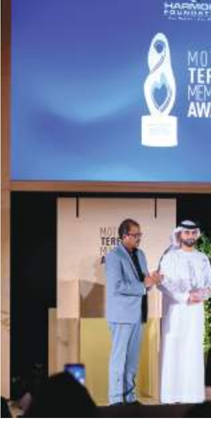
نهيان بن مبارك خلال تكريم الفائزين بالجائزة

بالعلم والمعرفة والتعاون والحوار. وقام معالي الشيخ نهيان بن مبارك آل نهيان بحضور سعادة الريم بنت عبدالله الفلاسي والدكتور أبراهام ماتاي رئيس مؤسسة هارموني بتسليم سمو الشيخ منصور بن محمد بن راشد آل مكتوم نيابة عن صاحب السمو الشيخ محمد بن راشد آل مكتوم نائب رئيس الدولة رئيس مجلس الوزراء حاكم دبي «رعاه الله» جائزة الأم تيريزا للعدالة الاجتماعية تكريماً لأعمال سموه وإنجازاته في حماية البيئة والحفاظ على مواردها الطبيعية وتبنيه لمبادئ التنمية المستدامة كأحد أهم أولوياته وتحقيق التوازن بين التنمية الاقتصادية والاجتماعية وبين حماية البيئة.