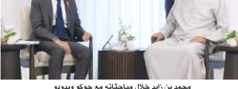
محمد بن زايد خلال مباحثاته مع جوكو ويدودو