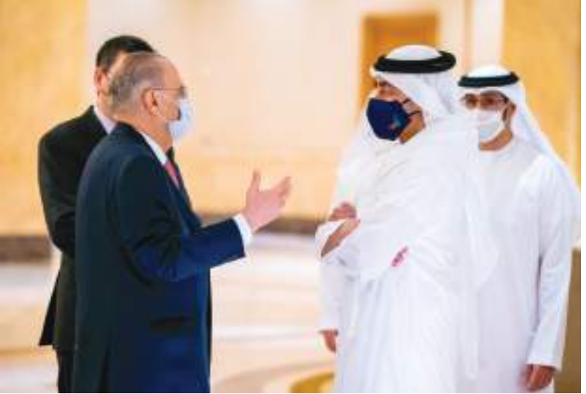
عبدالله بن زايد خلال مباحثاته مع وزير خارجية قبرص