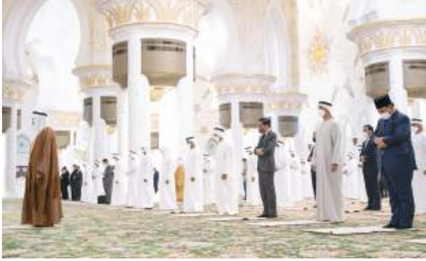
رئيس الدولة والرئيس الإندونيسي خلال أداء صلاة الجمعة في جامع الشيخ زايد الكبير