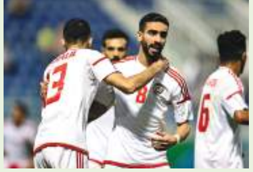
ديجا - وام :

يستعد منتخبنا الأولمبي لكرة القدم للسفر إلى صربيا لإقامة معسكر خارجي خلال الفترة من 3 إلى 17 يوليو في إطار استعداداته للمشاركة في البطولات المقبلة، أهمها بطولة غرب آسيا تحت 23 عاماً بالعراق في الفترة من 1 إلى 18 نوفمبر 2022، وبطولة كأس الخليج العربي تحت 23 عاماً في شهر أغسطس 2023، وتصفيات آسيا تحت 23 عاماً في سبتمبر 2023 والمؤهلة إلى أولمبياد باريس 2024.