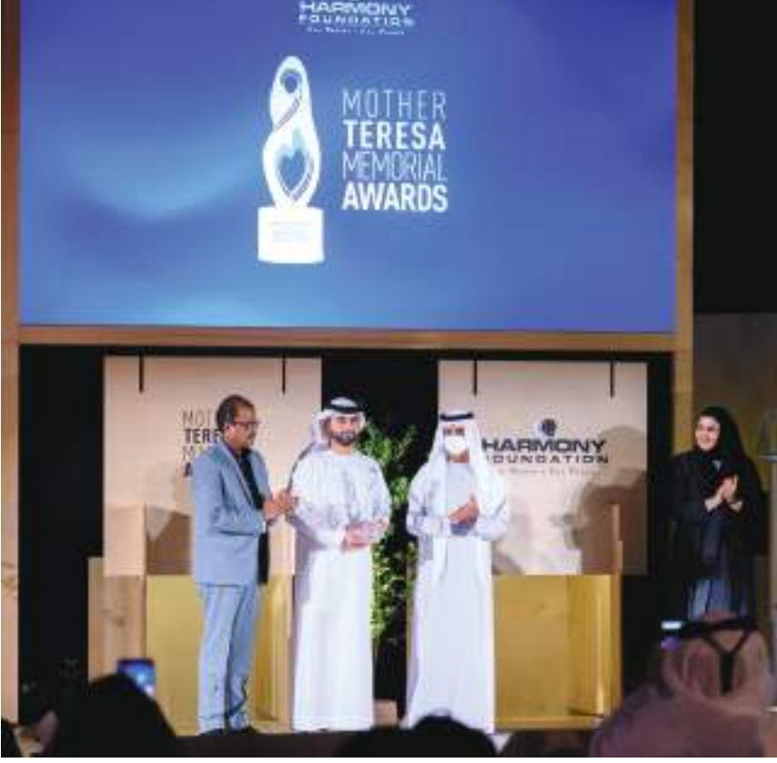
نهيان بن مبارك خلال تكريم الفائزين بالجائزة

وأكدت سمو الشيخة فاطمة بنت مبارك أن الاحتفاء بالفائزين لهذا العام بدولة الإمارات، جاء تعريزاً لقيم التسامح والتعايش التي يتحلى بها المجتمع الإماراتي والذي يستمد نهجه من ديننا الإسلامي الحنيف وقيمه الحضارية والإنسانية وسعى إلى ترسيخها مؤسس الدولة المغفور له الشيخ زايد بن سلطان «طيب الله ثراه»، وبيات الإمارات بيئة حاضنة لمختلف ثقافات العالم وموطناً لشعوب تحيا بمرج من الوثام والاحترام وقبول الآخر.