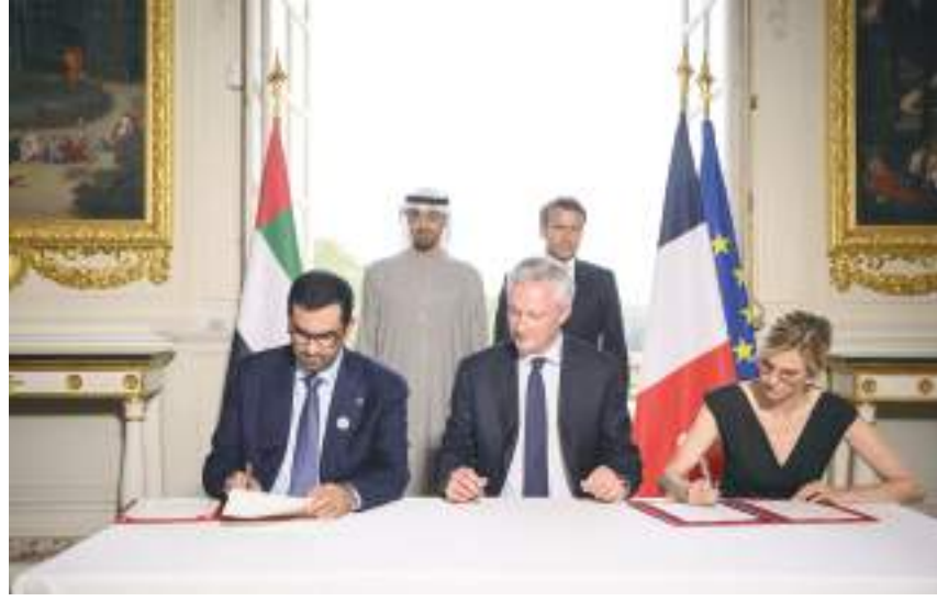
محمد بن زايد وإيمانويل ماكرون خلال حضورهما توقيع اتفاقية شراكة إستراتيجية شاملة في مجال الطاقة بين الإمارات وفرنسا