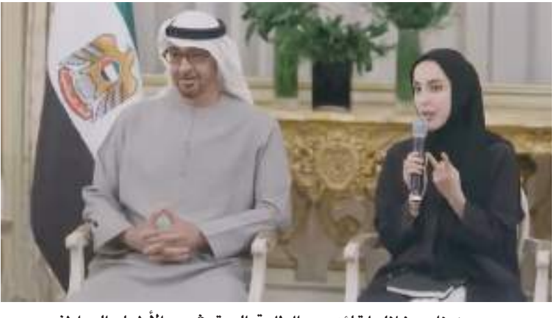
محمد بن زايد خلال لقائه مع الطلبة المتعثين والأطباء المواطنين

الأكاديمية لمواصله مسيرة التقدم في الوطن. وعبروا عن تقديرهم لما توفره لهم الدولة من خدمات ودعم لمواصله مسيرتهم بكل جد واجتهاد. كما التقى صاحب السمو الشيخ محمد بن زايد آل نهيان رئيس الدولة مع عدد من الأطباء الإماراتيين الذين شاركوا مع زملائهم الفرنسيين في الخطوط الأمامية في علاج المصابين خلال عملهم في المستشفيات والمراكز الطبية في فرنسا أثناء جائحة «كوفيد-١٩».