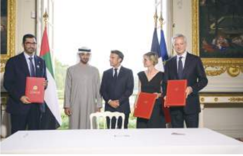
محمد بن زايد وإيمانويل ماكرون خلال حضورهما توقيع اتفاقية شراكة إستراتيجية شاملة في مجال الطاقة بين الإمارات وفرنسا