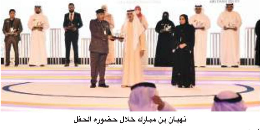
نهيان بن مبارك خلال حضوره الحفل