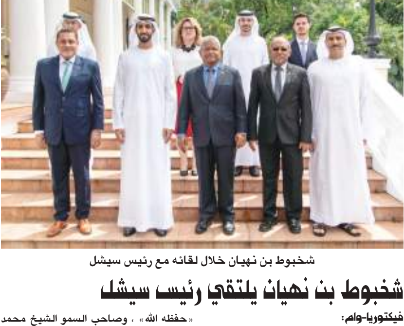
شخبوط بن نهيان خلال لقائه مع رئيس سيشل

التقى معالي الشيخ شخبوط بن نهيان بن مبارك آل نهيان وزير دولة والوفد المرافق له، فخامة اقل رامكالاوان رئيس جمهورية سيشل، بحضور معالي أحمد عفيف نائب رئيس الجمهورية، ومعالي سيلفستر راديغوند وزير الخارجية والسياحة في جمهورية سيشل. ونقل معاليه تحيات صاحب السمو الشيخ محمد بن زايد آل نهيان رئيس الدولة «حفظه الله»، وصاحب السمو الشيخ محمد بن راشد آل مكتوم نائب رئيس الدولة رئيس مجلس الوزراء حاكم دبي «رعاه الله» إلى فخامته، والتهنئة بمناسبة اليوم الوطني لجمهورية سيشل، وتمنياتهما لبلاده وشعبه بالمزيد من التقدم والازدهار. من جانبه حمل فخامته معالي الشيخ شخبوط بن نهيان آل نهيان تحياته إلى صاحب السمو الشيخ محمد بن زايد آل نهيان رئيس الدولة