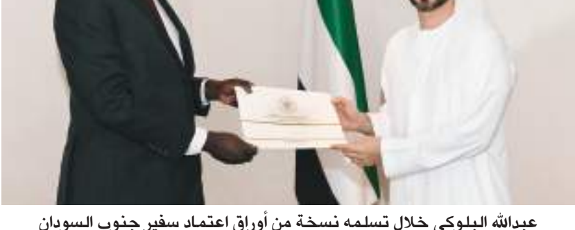
عبدالله البلوكي خلال تسلمه نسخة من أوراق اعتماد سفير جنوب السودان