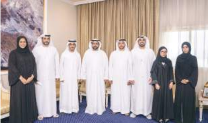
ولي عهد الفجيرة خلال استقباله أعضاء مجلس الفجيرة للشباب