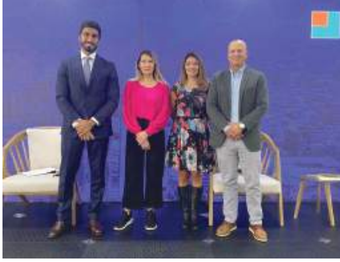
خلال فعاليات الجلسة النقاشية

وأوضح الناهي أن دولة الإمارات تشكل نموذجاً فريداً في مجال الاهتمام بالثقافة مع الاعتراف ببهوتها العربية والمحلية وتقبلها لتنوع الثقافات الأخرى وتعزيز وتطوير واقع الصناعات الثقافية والإبداعية فيها، لافتاً إلى أن حكومة دولة الإمارات اعتمدت مؤخرًا الاستراتيجية الوطنية للصناعات الثقافية والإبداعية بهدف النهوض بالقطاع وتعزيز حجمه وزيادة إمكاناته وتحفيزه ليكون ضمن أهم عشر صناعات اقتصادية بالدولة، والعمل على زيادة نسبة مساهمة الصناعات الثقافية الإبداعية لتصل إلى ٥ في المائة من إجمالي الناتج المحلي وذلك في ظل تقديم الدولة الكثير من الحوافز