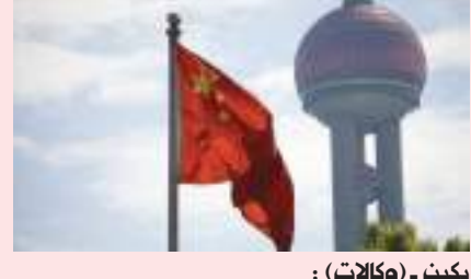
بيكين - وكالات:

تسارع نمو التضخم السنوي في الصين إلى ٢,٧٪ خلال يوليو/ تموز الماضي، صعوداً من ٢,٥٪ بالمتة في يونيو/ حزيران السابق له، وسط زيادة على أسعار السلع الأولية. وقالت الهيئة الوطنية للإحصاء، الأربعة، إن مؤشر أسعار المستهلكين، وهو مقياس رئيسي للتضخم، صعد في يوليو مدفوعاً بزيادة أسعار المواد غير الغذائية بنسبة ١,٩ بالمتة. وذكرت أن مؤشر أسعار المستهلكين الأساسي، الذي لا يشمل أسعار المواد الغذائية والطاقة، ارتفع ٠,٨ بالمتة على أساس سنوي في يوليو، مقارنة بـ ١ بالمتة في يونيو السابق. بينما على أساس شهري، زادت نسبة التضخم ٠,٥ بالمتة، بسبب ارتفاع أسعار اللحوم والخضراوات الطازجة، فضلاً عن العوامل الموسمية. وفي سياق متصل، قالت الهيئة إن مؤشر أسعار المنتجين الذي يقيس تكاليف البضائع عند بوابة المصنع، صعد ٤,٢ بالمتة على أساس سنوي في يوليو. وتباطأ نمو مؤشر أسعار المنتجين من ٦,١ بالمتة في يونيو السابق له على أساس سنوي. وعلى الرغم من ارتفاع أسعار المنتج والمستهلك، إلا أنها نسب تبقى قرب توقعات الحكومة الصينية، وتقل كثيراً عن مستويات غير مسبقة في منطقة اليورو، أو عند قمة ٤١ عاما في الولايات المتحدة.