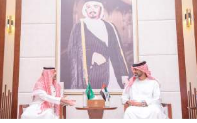
ولي عهد عجمان خلال لقائه القنصل العام السعودي