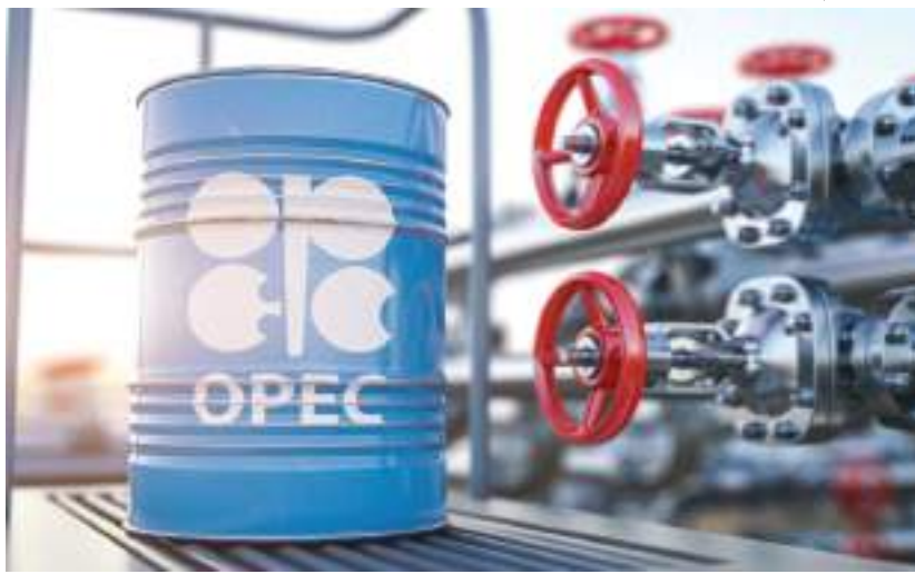
فيينا - (وام):

دولار للبرميل يوم الخميس بعد أن بلغ ٩٥,٧٣ دولار للبرميل في اليوم السابق.