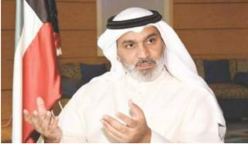
لندن - (وكالات):

أكد الدكتور محمد معيط وزير المالية المصري، أننا ماضون في تنفيذ التكلفة الرئاسية بتعظيم جهود مساندة القطاع الصناعي والتصديري في مواجهة الآثار السلبية للأزمة الاقتصادية العالمية التي اشتدت حدتها مع اندلاع الحرب في «أوروبا»، موضحاً أنه سيتم تدبير ١٠ مليارات جنيه لإطلاق مرحلة خامسة من مبادرة «السداد النقدي الفوري» لدعم الحكومة للمصريين؛ بما يسهم في سرعة سداد المساندة التصديرية للشركات المصدرة، ويساعد في توفير السيولة النقدية الكافية لاستمرار دوران عجلة الإنتاج، والحفاظ على العمالة، وتوسيع القاعدة التصديرية، وتعزيز تنافسية المنتجات المصرية في الأسواق الإقليمية والعالمية، على نحو يؤدي إلى رفع معدلات النمو الاقتصادي، وتحقيق المستهدفات التنموية وأضاف الوزير، أن وزارة المالية تتلقى طلبات المصدريين الراغبين في الاستفادة من المرحلة الخامسة لمبادرة «السداد النقدي الفوري» لمستحقات الشركات المصدرة لدى «صندوق تنمية الصادرات» لافتاً إلى أنه تعدد موعدان لصرف مستحقات المستفيدين الذين يستوفون الشروط المقررة، أحدهما في الأول من أكتوبر المقبل، والأخر في الأول من ديسمبر ٢٠٢٢. وأشار الوزير، إلى أن مجلس الوزراء وافق على إطلاق مرحلة خامسة من مبادرة «السداد النقدي الفوري» لدعم الحكومة للمصريين، استكمالاً لسلسلة النجاحات التي حققتها وزارة المالية بمبادراتها السابقة لسداد متأخرات دعم المصدريين لدى صندوق تنمية الصادرات.