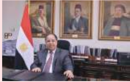
القاهرة - (الوحدة):

أكد الدكتور محمد معيط وزير المالية المصري، أننا ماضون في تنفيذ التكلفة الرئاسية بتعظيم جهود مساندة القطاع الصناعي والتصديري في مواجهة الآثار السلبية للأزمة الاقتصادية العالمية التي اشتدت حدتها مع اندلاع الحرب في «أوروبا»، موضحاً أنه سيتم تدبير ١٠ مليارات جنيه لإطلاق مرحلة خامسة من مبادرة «السداد النقدي الفوري» لدعم الحكومة للمصريين؛ بما يسهم في سرعة سداد المساندة التصديرية للشركات المصدرة، ويساعد في توفير السيولة النقدية الكافية لاستمرار دوران عجلة الإنتاج، والحفاظ على العمالة، وتوسيع القاعدة التصديرية، وتعزيز تنافسية المنتجات المصرية في الأسواق الإقليمية والعالمية، على نحو يؤدي إلى رفع معدلات النمو الاقتصادي، وتحقيق المستهدفات التنموية وأضاف الوزير، أن وزارة المالية تتلقى طلبات المصدريين الراغبين في الاستفادة من المرحلة الخامسة لمبادرة «السداد النقدي الفوري» لمستحقات الشركات المصدرة لدى «صندوق تنمية الصادرات» لافتاً إلى أنه تعدد موعدان لصرف مستحقات المستفيدين الذين يستوفون الشروط المقررة، أحدهما في الأول من أكتوبر المقبل، والأخر في الأول من ديسمبر ٢٠٢٢. وأشار الوزير، إلى أن مجلس الوزراء وافق على إطلاق مرحلة خامسة من مبادرة «السداد النقدي الفوري» لدعم الحكومة للمصريين، استكمالاً لسلسلة النجاحات التي حققتها وزارة المالية بمبادراتها السابقة لسداد متأخرات دعم المصدريين لدى صندوق تنمية الصادرات.