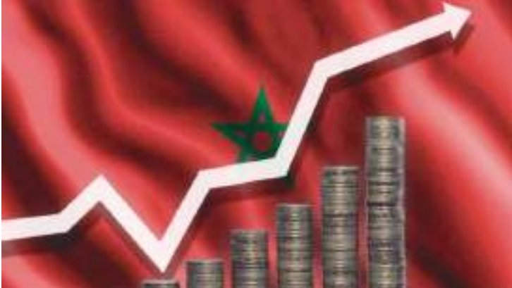
الرباط - (وكالات):

ارتفع مؤشر أسعار المستهلكين في المغرب بنسبة ٧,٧٪ على أساس سنوي في شهر يوليو، مدفوعاً بالزيادة في أسعار الغذاء، ليصل إلى أعلى مستوى منذ عام ١٩٩١. قالت المندوبية السامية للتخطيط في المغرب، يوم الجمعة، إن مؤشر أسعار المستهلكين قد صعد، نتيجة ارتفاع المواد الغذائية بنسبة بلغت ١٢ بالمئة.