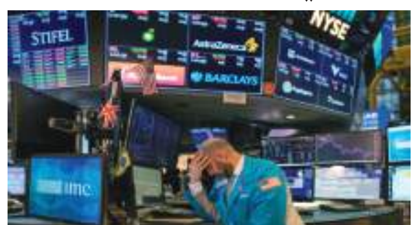
عواصم - (وام):

تراجعت مؤشرات الأسهم في بورصة وول ستريت الأمريكية خلال مستهل تعاملات يوم الجمعة، مع تراجع مؤشر «ناسداك» بنحو ١,٥٪، ووفقاً لبيانات الأسواق الأمريكية، انخفض مؤشر «ستاندرد أند بورز ٥٠٠» بنسبة ٠,٩١٪ أو بما يعادل ٣٨,٨٦ نقطة ليصل إلى ٤٢٤,٨٨ نقطة، وذلك بحلول الساعة ٥:٥٥ مساء بتوقيت الإمارات. وهبط مؤشر «ناسداك»، الذي تغلب عليه أسهم التكنولوجيا بنحو ١٨٩,٣ نقطة أو ما نسبته ١,٥٪، وصولاً إلى ١٢٧٧٣,٨٧ نقطة، في حين نزل مؤشر «داو جونز» الصناعي بنحو ٠,٥٪ توازي ١٩٧,٠٩ نقطة ليبلغ مستوى ٣٣٧٩٨,٥٩ نقطة.