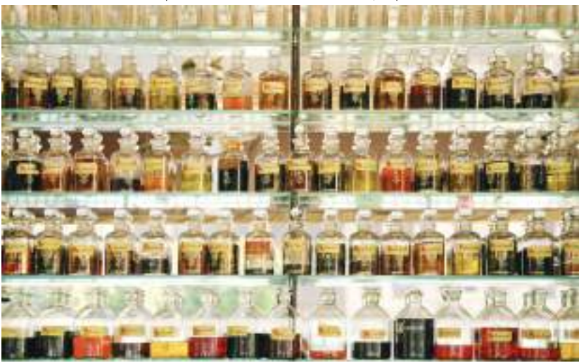
دبي - (الوحدة):

العطور الخليجية تحظى دائماً باهتمام الذوق العربي، حيث أصبحت تستقطب الآن اهتمام قطاعات كبيرة من المستهلكين العالميين، بعد أن تم تطويرها لتناسب مع الذوق والمزاج العامين لقطاع كبير من مستخدمي العطور. ويعد العود واحداً من أهم العطور العربية، والأكثر تفضيلاً بين آلاف أنواع العطور المتوفرة في السوق.