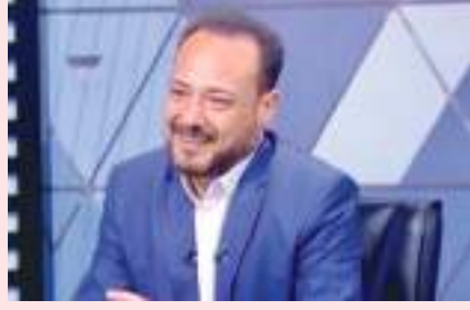
القاهرة - (الوحدة):

خبير مالي: حدوث انتعاش في الاقتصاد المصري بشكل عام بداية لدورة جديدة للأسواق