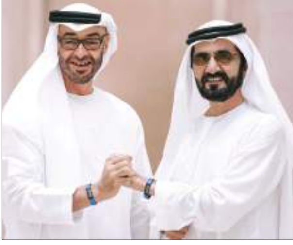
أبوظبي - الوحدة:

أكد صاحب السمو الشيخ محمد بن راشد آل مكتوم نائب رئيس الدولة رئيس مجلس الوزراء حاكم دبي «رعاه الله» أن تجارة الدولة غير النفطية حققت قفزة نوعية خلال النصف الأول من العام 2022 حيث تجاوزت التريليون درهم مسجلة نسبة نمو 17 في المائة عن نصف العام الماضي 2021. وقال صاحب السمو الشيخ محمد بن راشد آل مكتوم: «لأول مرة في تاريخ دولة الإمارات..»