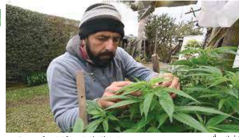
لندن (د ب أ)-

الدول لإضفاء الصبغة الشرعية على استخدام القنب، بسبب ارتفاع تركيز «تي إتش سي» في بعض المنتجات خلال الأعوام الأخيرة.