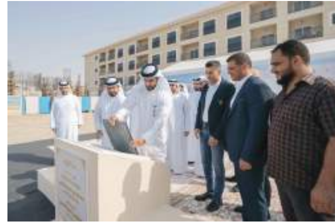
سلطان بن أحمد القاسمي خلال وضع حجر أساس «وقف الأمل الخيري»

ويعد مشروع وقف الأمل أحد المبادرات الرائدة لهيئة الشارقة للإذاعة والتلفزيون ضمن جهودها المتواصلة في تحقيق رسالتها الهادفة في العمل الإعلامي وتعزيز دورها الاجتماعي والإنساني المنبثق من رؤية وتوجهات صاحب السمو الشيخ الدكتور سلطان بن محمد القاسمي عضو المجلس الأعلى حاكم الشارقة ، وسيكون ريع وقف الأمل داعما رئيسيا لعلاج الحالات