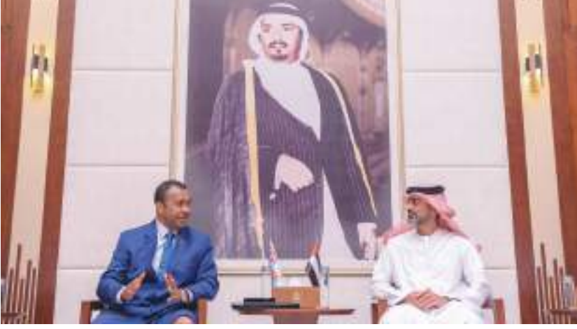
ولي عهد عجمان خلال استقباله سفير فيجي

التي من شأنها تقوية تلك العلاقة بين الشعبين الصديقين في العديد من القطاعات وسبل توطيدها.