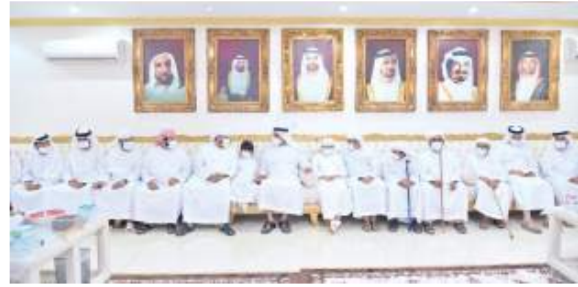
سيف بن زايد خلال تقديم واجب العزاء في وفاة والدته ناصر الكعبي