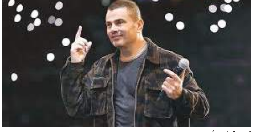
الدوحة (د ب أ)-

قطر ٢٠٢٢. وذكرت اللجنة في بيان صحفي: «يحيي دياب الحفل داخل استاد الأضخم جماهيريا في قطر والذي سيستضيف المباراة النهائية للمونديال المرتقب يوم ١٨ كانون الأول/ديسمبر ٢٠٢٢». وأضاف البيان: ستشهد الفعالية إقبالا جماهيريا من داخل قطر وخارجها، إذ أعلنت اللجنة المنظمة للبطولة عن تسيير رحلات ترددية بين الدوحة والقاهرة والرياض لنقل مشجعي الناديين.