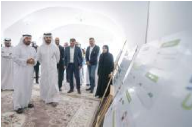
سلطان بن أحمد القاسمي خلال وضع حجر أساس «وقف الأمل الخيري»

وإطلع سموه - خلال وضع حجر الأساس - على المخططات التفصيلية لمشروع وقف الأمل الذي يتكون من بناية تجارية تقع في منطقة مويح وتتكون من أربعة طوابق بما فيها الطابق الأرضي. وستحمل البناية في تصميمها الطابع الكلاسيكي الحديث وستضم ٢٦ وحدة سكنية تم اعتمادها بعد دراسة السوق ضمن المنطقة ذاتها، إضافة إلى ٦ محال تجارية ستخدم القاطنين في البناية والمنطقة المجاورة.