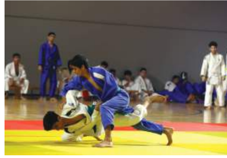
للرجال ومهرجان الصغار للناشئين والشباب في ضيافة الشارقة، وفي نفس اليوم تقام دورة الكاتا للاعبين والمدربين بالفجيرة، ويشهد الرابع