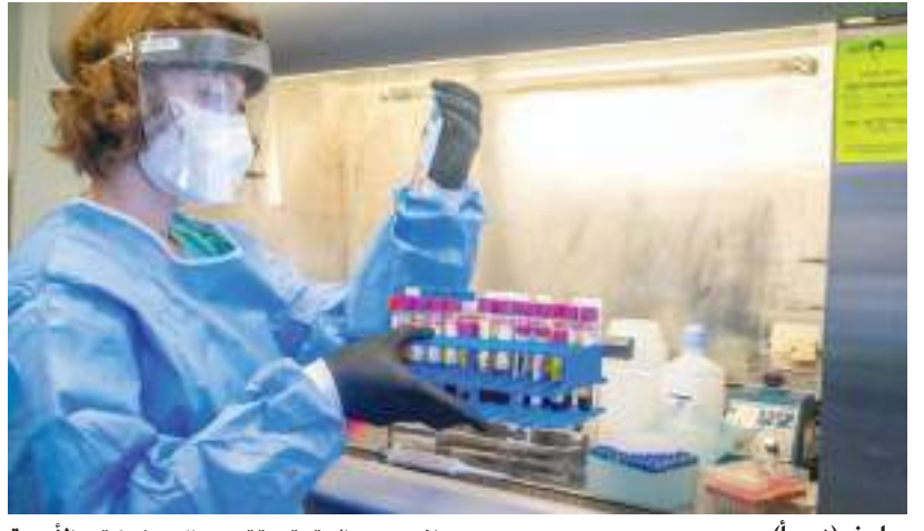
بولينا (د ب أ)-

تخضع فعالية لقاح طورته شركة بيونتك الألمانية للتكنولوجيا الحيوية وعملقة الأدوية الأمريكية فايزر في مقابمة سلالتين فرعيتين من محور كورونا المعروف باسم أوميكرون للتقييم من جانب وكالة الأدوية الأوروبية. وقال المتحدث باسم الوكالة إن اللقاح الذي تم تعديله ليقاوم السلالتين بي إيه ٤ وبي ٥ يخضع لما يسمى بـ «عملية المراجعة الدورية»، ما يعني أنه يمكن البدء في تقييم البيانات المتعلقة بفعاليتيه قبل اكتمال مجموعة البيانات وتقديم طلب رسمي للموافقة. وذكر المتحدث باسم وكالة الأدوية الأوروبية