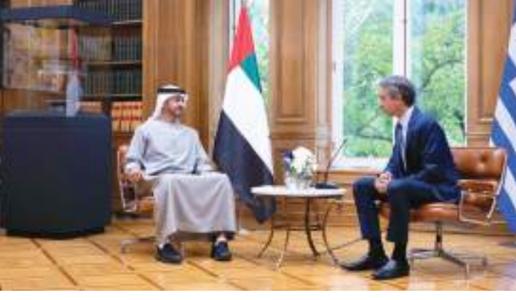
رئيس الدولة خلال مباحثاته مع رئيس وزراء اليونان