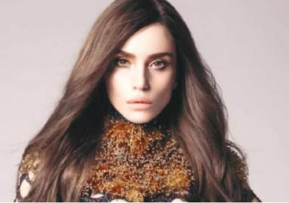
اسطنبول