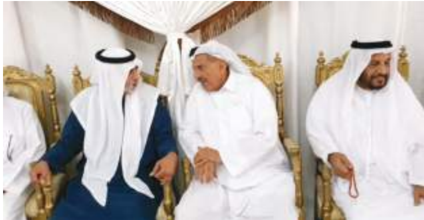
نهيان بن مبارك خلال تقديم واجب العزاء في وفاة حمامة خليفة المزروععي