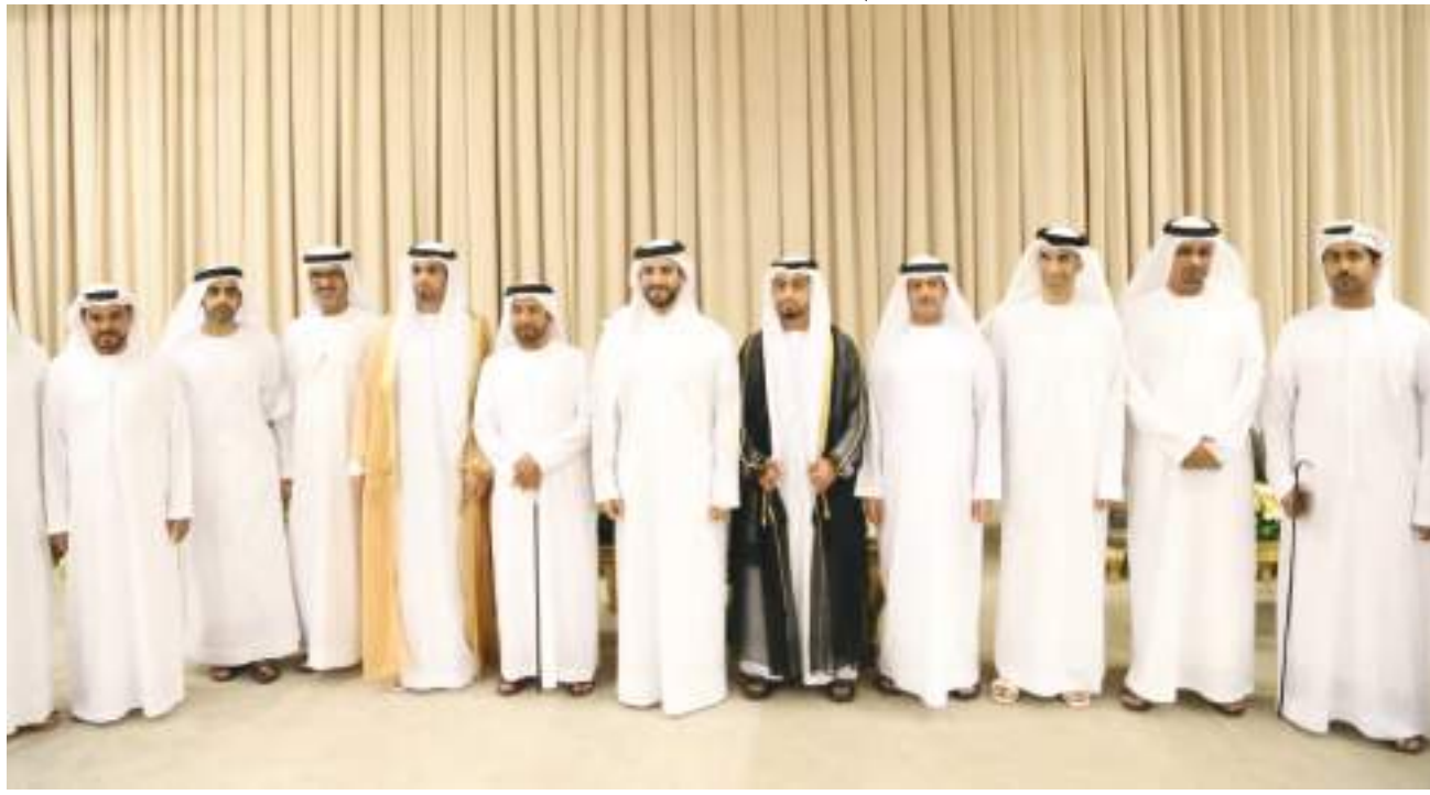
سلطان بن أحمد القاسمي في صورة تذكارية خلال حضوره أفراح الكعبي بالشارقة

كما حضر الحفل الذي أقيم بمركز الجواهر للمناسبات بالشارقة معالي الشيخ نهيان بن مبارك آل نهيان وزير التسامح والتعايش والشيخ محمد بن نهيان بن مبارك آل نهيان والشيخ ميثم بن صقر القاسمي نائب رئيس مكتب سمو الحاكم بكلياء والشيخ سالم بن عبدالرحمن القاسمي رئيس مكتب حاكم الشارقة والشيخ محمد بن حميد القاسمي رئيس دائرة الإحصاء والتنمية المجتمعية والشيخ ماجد بن سلطان القاسمي رئيس دائرة شؤون الضواحي والقرى ومعالي الدكتور ثاني بن أحمد الزيودي وزير دولة للتجارة الخارجية وسعادة اللواء سيف الزبي الشامسي القائد العام لشرطة الشارقة وسعادة عيسى الخزامي رئيس مجلس الشارقة الرياضي وسعادة خميس السويدي وعدد من كبار الشخصيات وكبار ضباط القوات المسلحة والشرطة وجمع غفير من الأهل والأصدقاء. وتخللت الحفل فقرات تراثية وشعبية.