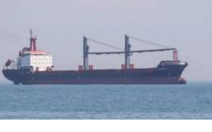
مصر، وهي تحمل ٤٥ ألف طن من النرة.

ميناة الدخيلة بالإسكندرية، شمالي مصر، وهي تحمل ٤٥ ألف طن من النرة. أما السفينة الثالثة، أفيفا، فسوف تغادر الميناء الأوكراني إلى ميناء كوشين الهندي، وعلى متنها ١٩١٠٠ طن من زيت عباد الشمس. وتم إرجاء مغادرة سفينتين تجاريتين إلى يوم الجمعة بسبب الأحوال الجوية. وتحمل السفينة «أوريس صوفي» ٥٩٠٠ طن من زيت عباد الشمس، ومن المقرر أن تنجز إلى تركيا. وتحمل السفينة «زلييك ستار» ٣٧٠٠ طن من البازلاء، وستتجه إلى تركيا.