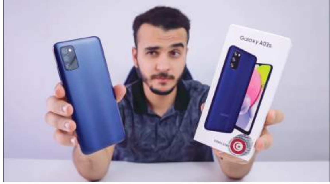
سول- (د ب أ):