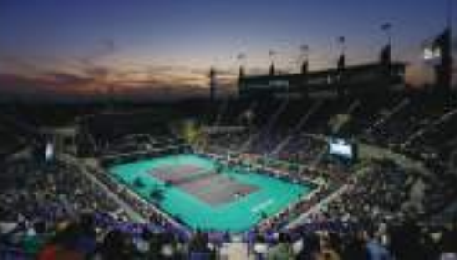
أبو ظبي - الوحدة: