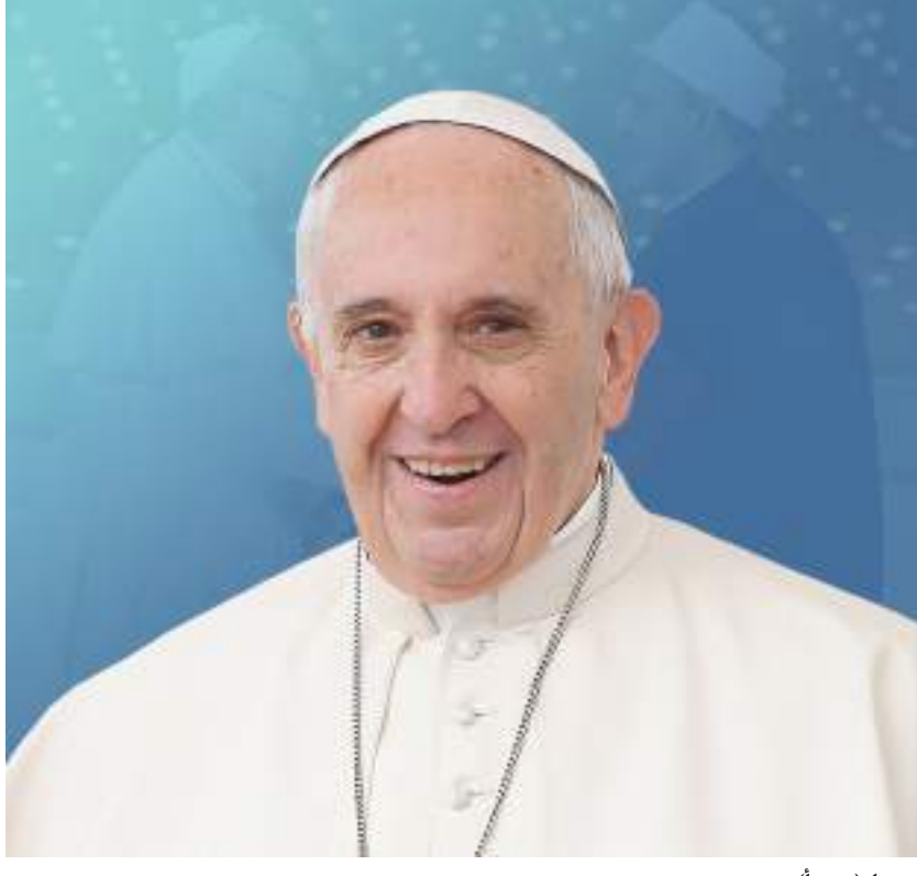
روما- (د ب أ):

وقال فرنسيس لـ «كيه بي إس» ، إنه لاحظ الكيفية التي نجت بها الدولتان من الحرب. وفعليا لم تنته حالة الحرب التي قسمت شبه الجزيرة إلى كوريتين ، شمالية وجنوبية . وأضاف « لقد عانينم من ويلات الحرب. وبالتالي أنتم تعلمون ما الذين تعنيه الحرب. عملوا باتجاه السلام. وأتوجه بباركتي وصلواتي لأن يحل السلام في الكوريتين». كان فرنسيس قد ألمح في الماضي لاستعداده لزيارة كوريا الشمالية. يذكر أن شبه الجزيرة الكورية تشهد توترا بسبب التجارب الصاروخية والنووية من جانب كوريا الشمالية والتي عرضتها لعقوبات دولية. وعرضت كوريا الجنوبية في وقت سابق من الشهر الجاري تقديم مساعدات لكوريا الشمالية مقابل تخلي الأخيرة عن الأسلحة النووية ، غير أن بيونج يانج رفضتها .