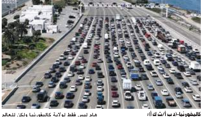
كاليفورنيا- (د ب أ/ت أ):

صوت مجلس موارد الهواء في ولاية كاليفورنيا الأمريكية يوم الخميس على قرار يلزم جميع السيارات والشاحنات الخفيفة التي يجري بيعها بحلول عام ٢٠٣٥ بأن تكون خالية من الانبعاثات. وذكرت صحيفة «لوس أنجليس تايمز» الأمريكية أن المجلس أشار إلى الحاجة الملحة لمعالجة التغير المناخي بالحد من تلوث الهواء. ووصفت لورين ساتشين، مستشارة المناخ لحاكم كاليفورنيا جافن نيوسوم، القرار بأنه «يوم هام ليس فقط لولاية كاليفورنيا ولكن للعالم بأسره». وتمثل هذه الخطوة منعطفًا تاريخيًا في المعركة التي استمرت عقودًا للحد من تلوث السيارات، وتحولًا هائلا للمستهلكين والصناعة والاقتصاد والبيئة. ويجبر القرار شركات صناعة السيارات التخلص التدريجي من السيارات التي تعمل بالبنزين والديزل، والسيارات الرياضية متعددة الأغراض (إس يو في)، والشاحنات الصغيرة والشاحنات نصف النقل لصالح السيارات التي تعمل بالبطاريات أو خلايا الوقود الصديقة للبيئة.