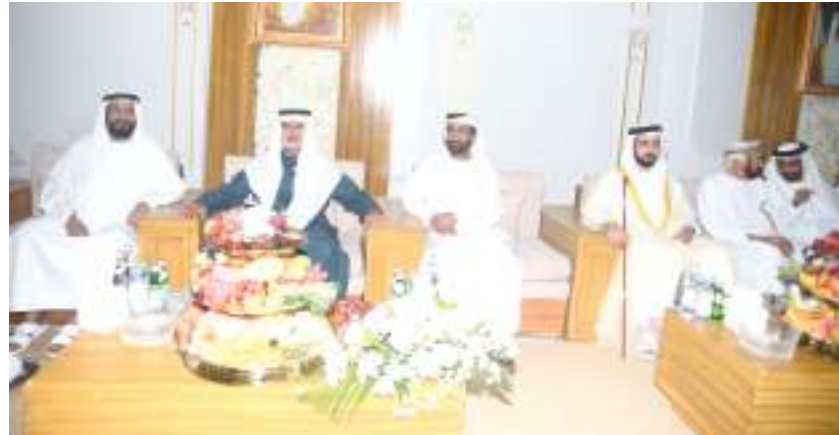
نهيان بن مبارك خلال حضوره أفراح آل حم