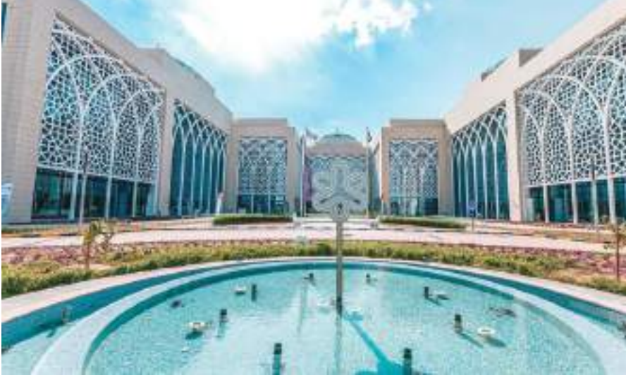
الشارقة - (الوحد):

تنطلق فعاليات النسخة الثالثة من قمة الشرق الأوسط للابتكار ونقل التكنولوجيا (MITT SUMMIT)، في ١٣ من أكتوبر/تشرين الأول القادم، بتنظيم مجمع الشارقة للبحوث والتكنولوجيا والابتكار، والتي تعبر الحدث المنخصص الأكبر في نقل التكنولوجيا والابتكار في المنطقة، بحضور ومشاركة عدد من أبرز العلماء وقادة التحول التكنولوجي في الوقت الذي يشهد فيه العالم ثورة صناعية رابعة تتميز باختراق التكنولوجيا الناشئة في عدد من المجالات، بما في ذلك الروبوتات، والذكاء الاصطناعي، وتكنولوجيا النانو، والتكنولوجيا الحيوية، وانتشرت الأشياء (IOT)، والطباعة ثلاثية الأبعاد، والمركبات المستقلة. وتجمع القمة عدداً كبيراً من المستثمرين وممثلي الحكومات والقطاع الخاص والأكاديميين ورجال الأعمال والعاملين من مختلف دول العالم ليصل بين الشارقة وعدد من المدن الكبرى حول العالم على مدار يوم كامل من المناقشات حول أفضل السبل لرسم ملامح مستقبل الابتكار وتعزيز أسس الاستدامة بمشاركة عدد كبير من المستثمرين الدوليين وممثلي الحكومات وممثلي القطاع الخاص، إضافة إلى عدد من الخبراء ورواد الأعمال والأكاديميين في مجالات