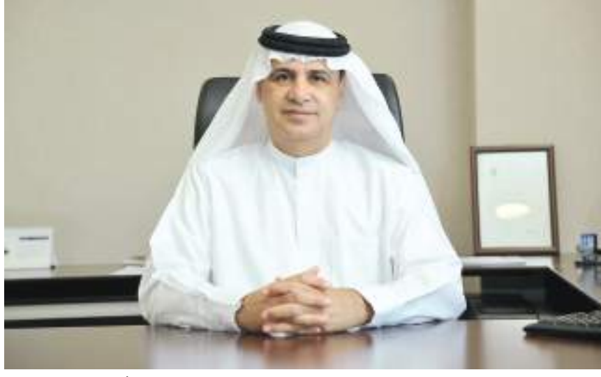
ديجا - (الوحد):

شركات الطيران، وسلامة وأمن الطيران، وتمويل واقتصاد الطيران، وتخطيط المطارات وإدارتها، وإدارة واستراتيجية الطيران، والتقدم التكنولوجي وتأثيره، والمرأة في مجال الطيران، وقانون الطيران، واستدامة الطيران. وشهدت دورات المؤتمر الثلاث السابقة تقديم أكثر من ٦٠ ورقة بحثية مهمة، تناولت مواضيع متنوعة ومحفزة تراوحت بين تحرير النقل الجوي، وتأثير قطار الاتحاد، وتأثير رضا الركاب على العلامة التجارية والمزيج التسويقي على قرارات الشراء، بالإضافة إلى مواضيع تقنية جادة ودراسات حالة وتبسيط النماذج الرياضية المعقدة، وسوف توفر الدورة الرابعة فرصاً أمام الحضور للاطلاع على أحدث الأبحاث الرائدة واتجاهات وتصورات الصناعة المستقبلية. وقال الدكتور أحمد العلي، مدير جامعة الإمارات للطيران: «شكّلت الجائحة حدثاً مفصلياً أحدث تغييراً جذرياً في صناعة الطيران. ويشكل المؤتمر المكان المناسب للاستماع إلى الخبراء حول كيفية