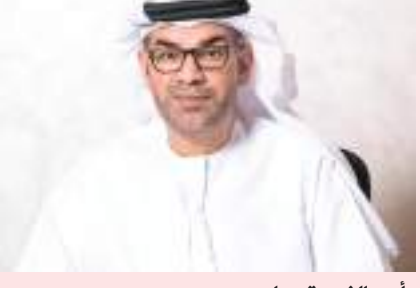
رأس الخيمة - وام:

تتعد «قمة رأس الخيمة للطلاقة» يومي ٤ و٥ أكتوبر المقبل في مركز الحمراء الدولي للمعارض والمؤتمرات في رأس الخيمة تحت رعاية صاحب السمو الشيخ سعود بن صقر القاسمي عضو المجلس الأعلى حاكم رأس الخيمة وبإستضافة دائرة بلدية رأس الخيمة. وحضر المؤتمر بدعم وزارة الطاقة والبنية التحتية ووزارة التغيير المناخي والبيئة والوكالة الدولية للطاقة المتجددة «إيرينا» إضافة إلى أكثر من ١٠ جهات حكومية في رأس الخيمة. وفي هذا الصدد عقد الاجتماع الأول للمجلس الاستشاري لقمة رأس الخيمة للطلاقة بشكل افتراضي والذي نظمته بلدية رأس الخيمة بحضور ممثلين عن وزارة الطاقة والبنية التحتية ودائرة الخدمات العامة برأس الخيمة والمؤسسات التابعة لها من مؤسسة الأشغال ومؤسسة إدارة المخلفات وهيئة تنمية السياحة في رأس الخيمة وهيئة رأس الخيمة للمواصلات وهيئة مناطق رأس الخيمة الاقتصادية «راکز» ووكالة النمسا العليا للطاقة «النمسا» و مكتب التنظيم والرقابة في دبي. وقال منذر محمد بن شكر الزعابي مدير عام دائرة بلدية رأس الخيمة إن هذا الحدث سيجتمع قادة حكوميين دوليين ومحلبيين ورجال أعمال من جاني العرض والطلب وخبراء وأكاديميين لمناقشة اتجاهات الصناعة والمبادرات والأولويات الخاصة بتحويل الطاقة وتنطلق إلى أبرز وأهم المناقشات القيمة وتأمل أن تعزز القمة التعاون بين الوكالات الدولية والهيئات الحكومية المحلية والقطاع الخاص بشأن الأهداف والمشروعات الملموسة.