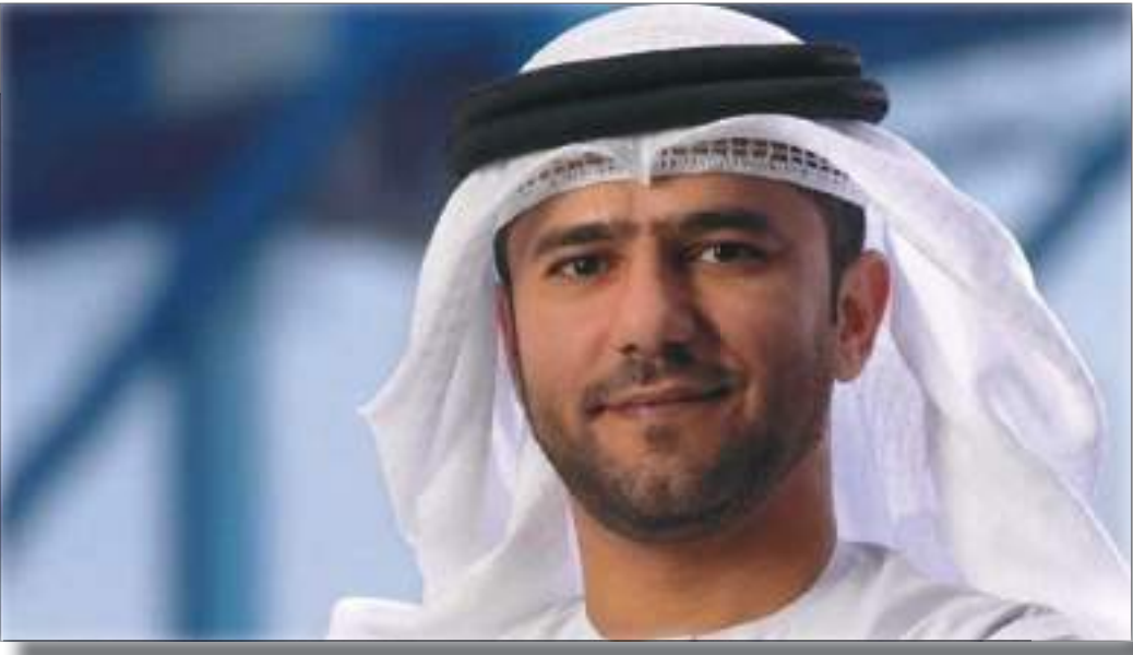
شرق إفريقيا، التي ستستفيد من استثماراتنا المشتركة مع مجموعة موانى أبوظبي».

وقعت مجموعة «موانى أبوظبي» اتفاقية مبدئية مع «موانى أداني» والمنطقة الاقتصادية الخاصة، أكبر مطور ومشغل للموانئ والخدمات اللوجستية المتكاملة في الهند، وذلك لإطلاق استثمارات استراتيجية مشتركة تهدف إلى تطوير مجموعة متكاملة من مرافق البنية التحتية والحلول اللوجستية في تنزانيا. يتضمن المشروع المشترك تطوير شبكة قطارات، وتوفير خدمات بحرية، وإدارة عمليات الموانئ، بالإضافة إلى تقديم خدمات رقمية متطورة، ومنطقة صناعية، وتأسيس أكاديميات تدريب بحري في الدولة الواقعة على الساحل الشرقي للقارة الإفريقية. ويهدف الطرفان بتوقيع هذه الاتفاقية المبدئية إلى تمهيد الطريق أمام سلسلة من الاستثمارات المحتملة على مستوى الدولة ودعم نمو المنظومة المتكاملة للقطاع البحري والخدمات اللوجستية وتطويرها. ما يؤهل تنزانيا لأن تصبح مركزاً رئيسياً لعمليات هذا القطاع في قارة أفريقيا. تحسين الإمكانيات وأشار الكابتن محمد جمعة الشامسي، العضو المنتدب والرئيس التنفيذي لمجموعة موانى أبوظبي، إلى أن التعاون مع موانى أداني والمنطقة الاقتصادية الخاصة سيعمل بشكل لافتح على تحسين إمكانيات تنزانيا وقدرتها على التحول إلى مركز تجاري رئيسي في القارة الإفريقية، لافتاً إلى أنها تتسجم مع رؤية القيادة الرشيدة لبناء مكانة رائدة لإمارة أبوظبي ضمن قطاعي الصناعة والخدمات اللوجستية على مستوى العالم. وقال الشامسي: «يسهم هذا التعاون في تمكيننا من مواصلة تطوير قدراتنا العالمية وتحسين شبكة الربط الخاصة بنا لتأمين المنتجات والبضائع إلى الأسواق بصورة أسرع وأكثر كفاءة، كما تؤدي استثماراتنا الاستراتيجية في تنزانيا لبناء مرافق بنية تحتية