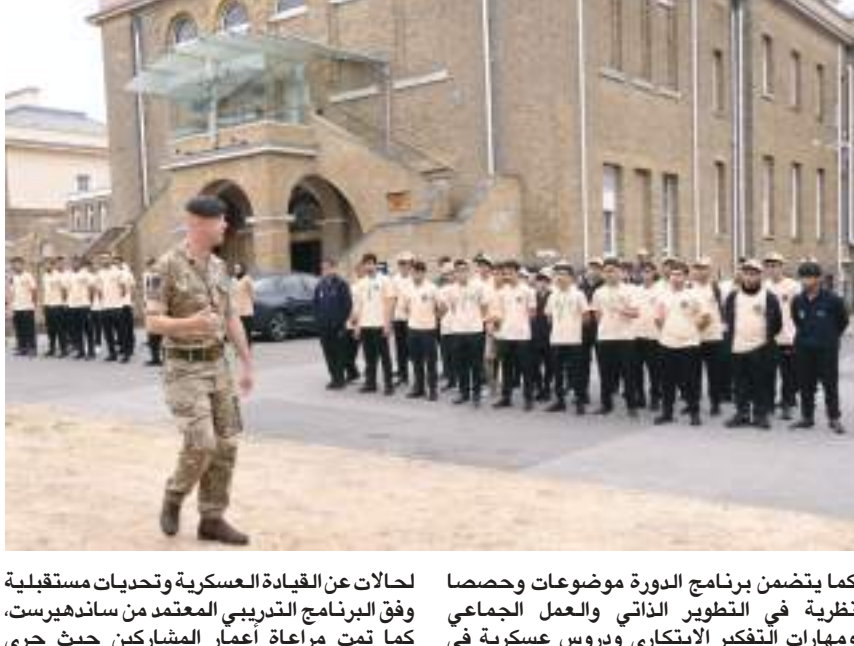
كما يتضمن برنامج الدورة موضوعات وحصصاً نظرية في التطوير الذاتي والعمل الجماعي ومهارات التفكير الابتكاري ودروس عسكرية في القيم والمعايير والمفاهيم العسكرية ودراسات

ويتلقى المشاركون بشكل يومي حصصاً نظرية في العلوم الصحية ومهارات تنمية القيادة والقيام بزيارات ميدانية إلى جانب تدريبات عسكرية تعزز الجانب البدني وترفع المهارات الجسدية للمشاركين، كما يطلعون على أفضل الممارسات في أكاديمية ساندهيرست العريقة من خلال زيارات وقاءات مع المسؤولين هناك.