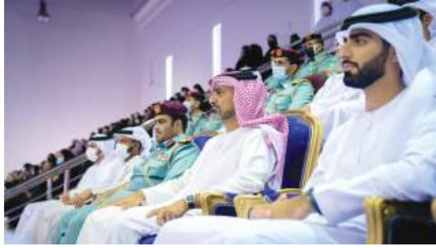
ولي عهد عجمان خلال حضوره حفل التخريج