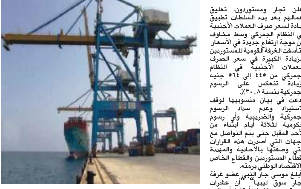
الخرطوم - (الوحد):