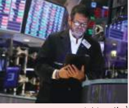
أبوظبي - وام:

ارتفعت مؤشرات أسواق الأسهم في بورصة وول ستريت الأمريكية خلال مستهل تعاملات يوم الخميس لتواصل مكاسبها للجلسة الثانية تواليًا. ووفقاً لبيانات الأسواق الأمريكية، صعد مؤشر «ستاندرد أند بورز ٥٠٠» بنسبة ٠.٠٤٪ أو ما يعادل ١.٧٨ نقطة ليصل إلى ٤١٥٨.٣٢ نقطة. وارتفع مؤشر «ناسداك» الذي تغلب عليه أسهم التكنولوجيا، بنحو ٤.٨٨ نقطة أو ما نسبته ٠.٣٨٪ وصولاً إلى ١٢٧١٩.٥٦ نقطة. في حين زاد مؤشر «داو جونز» الصناعي بنحو ٠.٠٤٪ توازي ١٤.٥ نقطة ليبلغ مستوى ٣٢٨٢٧.٨٢ نقطة. على صعيد متصل واصلت أسواق الأسهم الأوروبية مكاسبها بالتعاملات المتأخرة بعدما نما مؤشر «داكس» الألماني بنسبة ٠.٧٤٪، وصعد مؤشر «كالك ٤٠» الفرنسي بنحو ٠.٦٪، بينما ارتفع مؤشر «فوتسي ١٠٠» البريطاني بنسبة ٠.١٩٪. وعلو صعيد الأسواق الآسيوية ارتفع مؤشر نيكيا الياباني بنسبة ٠.٦٩٪ في ختام تعاملات اليوم، مواسلاً مكاسبه للجلسة الثانية على التوالي، بينما انخفض مؤشر تويكس الأوسع نطاقاً هامشياً بنسبة ٠.٠٢٪. في المقابل، ارتفعت الأسهم الصينية مع صعود مؤشر «إي إس ٤» المركب في بورصة شنغهاي بنحو ٠.٨٪، فيما ارتفع مؤشر هانج سينج الصيني بنسبة ٠.٠٦٪.