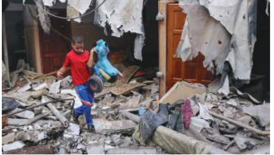
غزة/ القدس - (رويترز):

وقُتل ما لا يقل عن 44 شخصاً، بينهم 15 طفلاً، في عنف دام 56 ساعة، وكان قد بدأ عندما استهدفت غارات جوية إسرائيلية قيادياً كبيراً في الجهاد الإسلامي. وقالت إسرائيل إن تحركها كان ضربة استباقية لهجوم خططته الحركة المدعومة من إيران.