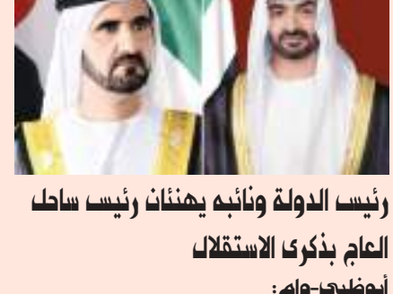
رئيس الدولة ونائبه يهنئان رئيس ساطح

وشغل رحمه الله منصب النائب الثاني لرئيس المجلس في الفصل التشريعي الرابع عشر، ومنصب وكيل اللجنة التنفيذية للشعبة البرلمانية الإماراتية في الفصل التشريعي الثالث عشر، كما رأس عدداً من لجان المجلس خلال مسيرته البرلمانية، وشغل منصب نائب رئيس الاتحاد البرلماني الدولي عن المجموعة العربية، ممثل المجموعة العربية في اللجنة التنفيذية للاتحاد، وهو حائز على جائزة التميز البرلماني العربي لعام ٢٠١٧م.