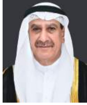
أبوظبي - القيوين - وام:

نعى ديوان صاحب السمو الشيخ سعود بن راشد المعلا عضو المجلس الأعلى حاكم أم القيوين المغفور له سعادة علي جاسم أحمد جاسم آل علي عضو المجلس الوطني الاتحادي ومدير عام شبكة أم القيوين الإذاعية الذي وافته المنية يوم الاثنين 8 أغسطس 2022م.