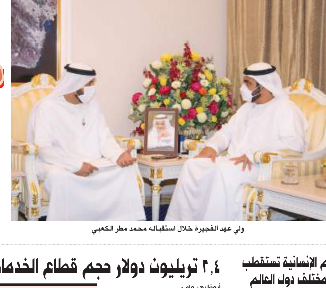
ولي عهد الفجيرة خلال استقباله محمد مطر الكعبي

استقبل سمو الشيخ محمد بن محمد الشرقي ولي عهد الفجيرة، في مكتبه بالديوان الأميري، سعادة الدكتور محمد مطر الكعبي رئيس الهيئة العامة للشؤون الإسلامية والأوقاف، والوفد المرافق.