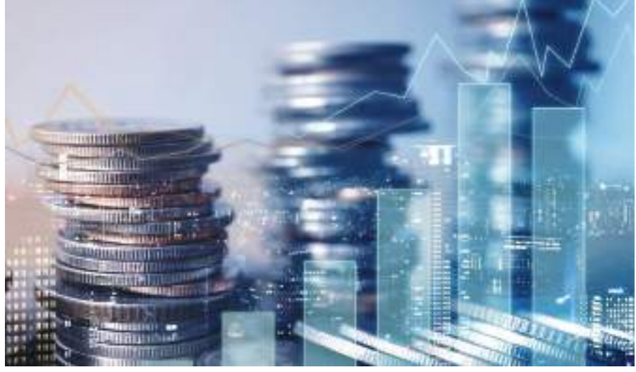
أبوظبي - وام:

الشركات المدرجة عن أرباح قوية في النصف الأول من العام الجاري. ونجح مؤشر فوتسي سوق أبوظبي العام في الصعود بنسبة 2.08% ليقفل عند 10136.19 نقطة متجاوزاً بذلك حاجز 10 آلاف نقطة ومحققاً أعلى مستوياته منذ 11 أبريل الماضي «تتمتع ص 8»