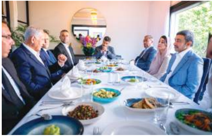
عبدالله بن زايد خلال لقائه نتنياهو في إسرائيل

الإسرائيلي شهد على مدار العامين الماضيين تطورا لافتا في عدة مجالات بما يدعم جهود البلدين لتحقيق التنمية والأزدهار لشعبيهما. حضر اللقاء معالي ريم بنت إبراهيم الهاشمي وزيرة دولة لشؤون التعاون الدولي ومعالي نورة بنت محمد الكعبي وزيرة الثقافة والشباب ومعالي أحمد بن علي محمد الصايغ وزير دولة وسعادة عمر غباش مساعد وزير الخارجية والتعاون الدولي للشؤون الثقافية والدبلوماسية العامة وسعادة محمد محمود آل خاجة سفير دولة الإمارات لدى دولة إسرائيل.