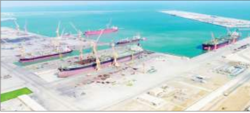
مسقط - (الوحدة):

أشار تقرير حديث نشرته مجلة «الدقم الاقتصادية» في عددها الأخير أنه يمكن للدقم بسطة عمان أن تحدث farka في النقل البحري العالمي خلال عامي (٢٠٢٢ و ٢٠٢٣) خاصة إذا ما تمكن الميناء من إطلاق الحوض الجاف الثاني ورفع سعة ساحة الحاويات الخاصة به إلى ١,٥ مليون على الأقل بنهاية العام الجاري. وأوضح التقرير أنه مع بدء تشغيل الميناء وحوض بناء السفن بشكل كامل، فإن الخطوة التالية للدقم كي تصبح مركزاً عالمياً للشحن العابري هي توسيع محطة الحاويات. حيث يمكن لمحطة التخزين حالياً التعامل مع حوالي ٢٠٠ ألف حاوية سنوياً، ولكن الهدف المنشود هو ١,٥ - ١,٧ مليون حاوية سنوياً. وقد تم بالفعل الانتهاء من جزء كبير من البنية الأساسية، وبما في ذلك قضبان الرفع وساحة الحاويات والمباني الإدارية وقد شارف بعضها على الانتهاء. ومع تزايد الطلب على خدمات الصيانة في الدقم، يتم العمل على إنشاء ورشة صيانة للسفن لتلبية للطلب المتنامي، علماً أن الحوض الجاف نجح في إصلاح وتجديد حوالي ١٠٠ سفينة من مختلف الفئات بين عامي (٢٠١٣ - ٢٠٢٢)، ومن المتوقع أن يتضاعف الرقم خلال العقد القادم. وقد تم في عام ٢٠٢١ إصلاح ١١٥ سفينة من مختلف دول العالم.