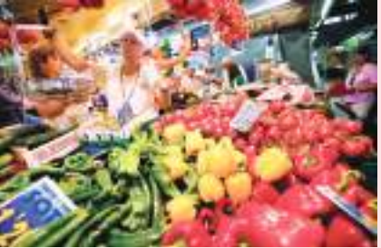
بروكسل - (د ب أ):

أظهرت بيانات مكتب الإحصاء الأوروبي (يوروستات) يوم الجمعة أن التضخم في منطقة العملة الأوروبية الموحدة ارتفع في أغسطس الماضي إلى مستوى قياسي غير مسبق، بالاتفاق مع تقديرات أوبية. وارتفع التضخم في أغسطس إلى ٩,١٪ مقابل ٨,٩٪ في الشهر السابق عليه، وجاءت هذه النسبة متفقة على تقديرات أولية نشرت في ٣١ أغسطس الماضي. كما زاد معدل التضخم الأساسي الذي يستثني أسعار الطاقة والغذاء والتبغ إلى ٤,٣٪ في أغسطس، بالاتفاق مع التقديرات. مقابل ٤٪ في يوليو الماضي. وبالمقارنة بشهر يوليو، ارتفع المؤشر المنسق لأسعار المستهلكين بنسبة ٠,٦٪ في أغسطس، فيما كانت التقديرات السابقة تشير إلى ارتفاعه بنسبة ٠,٥٪.