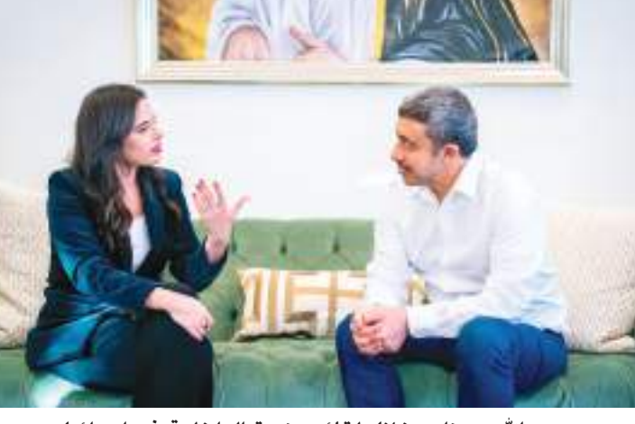
عبدالله بن زايد خلال لقائه وزيرة الداخلية في إسرائيل

و سعادة عمر غباش مساعد وزير الخارجية والتعاون الدولي للشؤون الثقافية والدبلوماسية العامة وسعادة محمد محمود آل خاجة سفير دولة الإمارات لدى دولة إسرائيل.