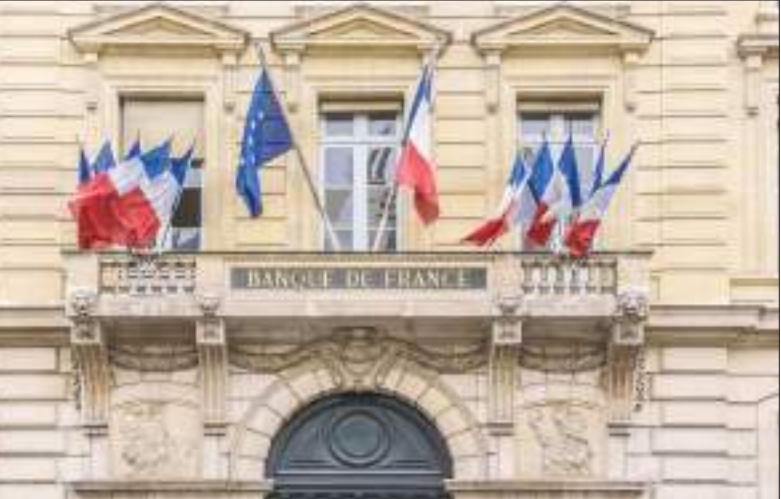
باريس - (د ب أ):

بالمئة في غضون عامين أو ثلاثة أعوام». وأظهرت بيانات مكتب الإحصاء الفرنسي أمس الخميس انخفاض معدل التضخم بنسبة أقل من المتوقع خلال شهر آب/أغسطس الماضي. وتراجع معدل التضخم في آب/أغسطس الماضي إلى ٥,٩٪، بعدما بلغ (أر) في تموز/يوليو الماضي. وكان المحللون قد توقعوا أن يبلغ معدل التضخم ٥,٨٪. وارتفعت أسعار البضائع المصنعة بنسبة ١,٨٪ خاصة المتعلقة بانتهاء فصل الصيف. كما ارتفعت أسعار الأغذية بنسبة ١,٧٪ ويرجع ذلك لارتفاع تكلفة أسعار المنتجات الطازجة من ناحية أخرى، تراجع أسعار الخدمات من ١,٣٪ إلى ٠,٣٪. وفي نفس الوقت، انخفضت أسعار الطاقة بنسبة ٣,٩٪.