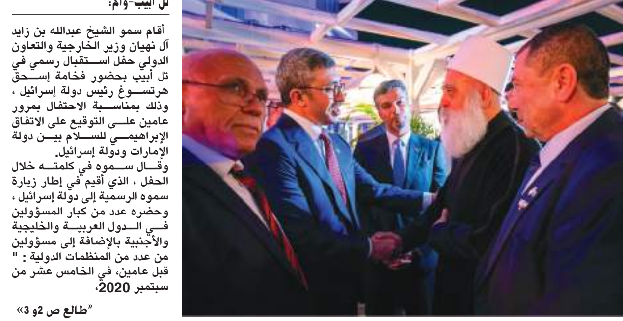
تل أبيب-وام: أقيم سمو الشيخ عبدالله بن زايد آل نهيان وزير الخارجية والتعاون الدولي حفل استقبال رسمي في تل أبيب بحضور فخامة إسحق هرتسوغ رئيس دولة إسرائيل، وذلك بمناسبة الاحتفال بمرور عامين على التوقيع على الاتفاق الإبراهيمي للسلام بين دولة الإمارات ودولة إسرائيل. وقال سموه في كلمته خلال الحفل، الذي أقيم في إطار زيارة سموه الرسمية إلى دولة إسرائيل، وحضره عدد من كبار المسؤولين في الدول العربية والخليجية والأجنبية بالإضافة إلى مسؤولين من عدد من المنظمات الدولية: " قبل عامين، في الخامس عشر من سبتمبر 2020،