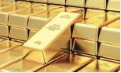
عواصم - (وام):

واصلت أسعار الذهب العالمية هبوطها خلال تداولات يوم الجمعة، مستمرة في التراجع عند أدنى مستوياتها خلال عامين. ووفقا لبيانات الأسواق العالمية، انخفضت أسعار المعدن الأصفر في المعاملات الفورية بنسبة ٠,٠٤٪ أو ما يعادل ٠,٦٤ دولارا لتصل إلى ١٦٦٣,٩ دولار للأونصة، وذلك بحلول الساعة «٩:٣٣ صباحا بتوقيت الإمارات». ونزلت العقود الآجلة للذهب لتسليم شهر ديسمبر بنسبة بلغت ٠,٣٪ تعادل ٥,١٥ دولار لتصل إلى ١٦٧٢,٢٥ دولار للأونصة. وعلى صعيد المعادن النفيسة الأخرى، تراجعت الفضة بنسبة ٠,٦٦٪ إلى ١٩,١٥ دولار للاونصة، وهبط البلاتين بنسبة ٠,٣٣٪ إلى ٨٩٩,٨ دولار، في حين ارتفع البلاديوم بنحو ٠,٠١٪ إلى ٢١٤٢,٠٢ دولار.