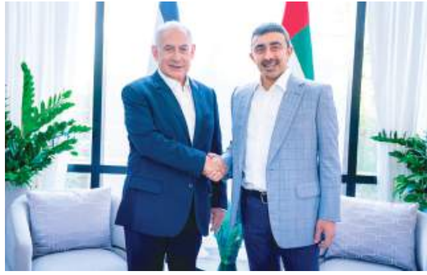
عبدالله بن زايد خلال لقائه نتنياهو في إسرائيل

البارزة التي أسهمت في التوقيع على الاتفاق الإبراهيمي للسلام بين دولة الإمارات ودولة إسرائيل عام ٢٠٢٠، مشيرا إلى أن البلدين قدما على مدار عامين نموجا متميزا للتعاون البناء والمثمر على الصعد كافة. من جانبه رحب معالي بنيامين نتنياهو بزيارة سمو الشيخ عبدالله بن زايد آل نهيان التي تتزامن مع الاحتفال بمرور عامين على التوقيع على الاتفاق الإبراهيمي للسلام بين دولة الإمارات ودولة إسرائيل. وأكد معاليه أن التعاون الثنائي الإماراتي