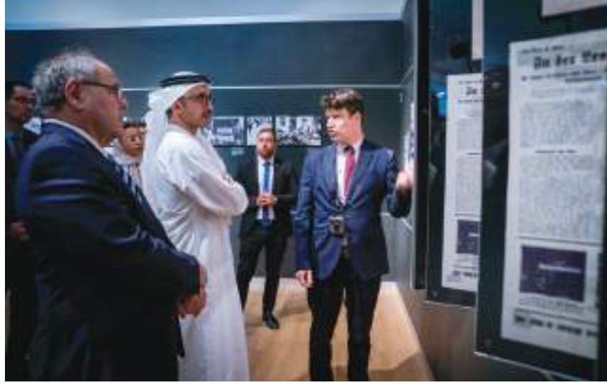
عبدالله بن زايد خلال زيارته «مجمع ياد فاشيم» في إسرائيل

عالمي توثيقي وبحثي وتعليمي لتخليد ذكرى الهولوكوست ، ويضم متاحف ومعارض وأنصبة تذكارية ومراكز بحثية وتعليمية ، بالإضافة إلى المكتبات والأرشيف. وأشاد سمو الشيخ عبدالله بن زايد آل نهيان بدور هذا المجمع التاريخي الذي يعكس أهمية العمل من أجل تعزيز ونشر قيم التسامح والتعايش بين الشعوب والعمل على إحلال السلام ودعم تطلعات الشعوب في الحياة الكريمة والرخاء.