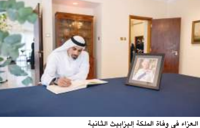
خالد بن محمد بن زايد خلال تقديم واجب العزاء في وفاة الملكة إليزابيث الثانية

عقود طويلة لخدمة وطنها وشعبها بكل تقان وإخلاص، حتى أضحت نموذجا يحتذى به في العطاء والالتزام بالقضايا الإنسانية، تاركة سجلا حافلا بالإنجازات سيبتزكره التاريخ وشعوب العالم بكل فخر واعتزاز. وعبر سموه عن تمنياته لجلالة الملك تشارلز الثالث، ملك المملكة المتحدة لبريطانيا العظمى وإيرلندا الشمالية، بدوام التوفيق والتقدم والأزدهار، واستمرار الشراكة المتميزة وعلاقة