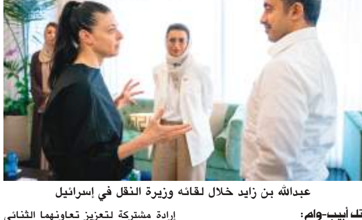
عبدالله بن زايد خلال لقائه وزيرة النقل في إسرائيل

إرادة مشتركة لتعزيز تعاونهما الثنائي في المجالات كافة، مشيرا إلى أن الاتفاق الإبراهيمي للسلام الذي تم توقيعه عام ٢٠٢٠ حفز البلدين على ترسيخ علاقات متميزة وشراكات مستدامة تدعم جهودهما لتحقيق الأزدهار الاقتصادي والتنمية الشاملة. من جانبه رحب معالي ميراف ميخائيلي بزيارة سمو الشيخ عبدالله بن زايد آل نهيان والوفد المرافق، مؤكدا أهمية تعزيز التعاون الثنائي الإماراتي الإسرائيلي في قطاع النقل باعتباره يشكل ركيزة أساسية لتحفيز النمو الاقتصادي في البلدين.