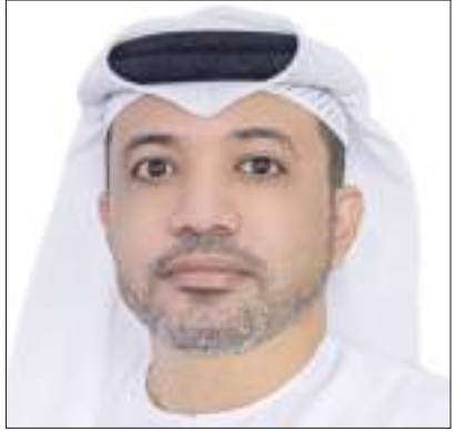
عجمان - (وام):-

موضحاً أن «مشروع المتابعة الذكية» من شأنه تقديم قيمة مضافة جديدة ونوعية، لاسيما فيما يتعلق بمتابعة المشاريع العقارية وذلك من خلال تقديم صور واضحة ومعلومات وبيانات دقيقة تسهل مهام فرق العمل في الدائرة وتتيح لهم إمكانية تنفيذ عمليات التفتيش والمتابعة بكفاءة عالية وفي وقت وجيز مقارنة بالأساليب التقليدية المتبعة. من جانبه أوضح المهندس عمر بن عمير المهيري مدير عام دائرة الأراضي والتنظيم العقاري أن استخدام طائرات من دون طيار سيستخدم على أوسع نطاق وسيشمل العديد من العمليات والإجراءات الأخرى لدعم الموظفين وتسهيل مهامهم اليومية من خلال الاستخدام الأمثل لأحدث التقنيات وأجهزة الذكاء الاصطناعي المتطورة. وأكد أن ما تشهده إمارة عجمان من تطور وازدهار يحتم على الدائرة مضاعفة جهودها وتكريس طاقاتها للارتقاء بالأداء ومواكبة هذا النمو.