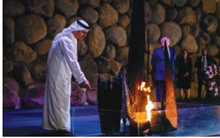
عبدالله بن زايد خلال زيارته «مجمع ياد فاشيم» في إسرائيل

وأكد سموه أن دولة الإمارات بقيادة صاحب السمو الشيخ محمد بن زايد آل نهيان رئيس الدولة «حفظه الله» حريصة على أداء دورها كمنارة عالمية لنشر قيم التسامح والتعايش والأخوة الإنسانية ، حيث تشكل هذه القيم ركائز أساسية لتحقيق التنمية والأزدهار المستدام في المجتمعات. وتقدم سموه بجنحة تقدير لرواح ضحايا الهولوكوست .. مشيدا بحرص مجمع ياد فاشيم على تخليد ذكراهم.