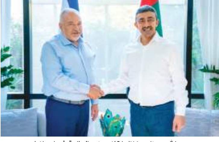
عبدالله بن زايد خلال لقائه وزير المالية في إسرائيل

و سعادة عمر غباش مساعد وزير الخارجية والتعاون الدولي للشؤون الثقافية والدبلوماسية العامة وسعادة محمد محمود آل خاجة سفير دولة الإمارات لدى دولة إسرائيل.