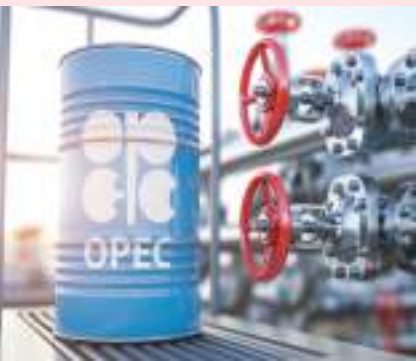
فيينا - (وام):

أعلنت منظمة الدول المصدرة للنفط «أوبك» أن سعر سلة خاماتها التي تضم متوسط أسعار ١٣ خاما من إنتاج الدول الأعضاء وصل إلى ٩٧,٣ دولار للبرميل الخميس. ونكرت «أوبك» - في نشرتها الصادرة يوم الجمعة أن المعدل السنوي لسعر السلة بلغ نحو ٦٩,٨٩ دولار للبرميل في العام ٢٠٢١، و٤١,٤٧ دولار للبرميل في ٢٠٢٠. وتتكون سلة أوبك المرجعية للخامات من ١٣ خاما يمثل كل منها نفط صادرات الأساس لكل دولة من البلدان الأعضاء في المنظمة.