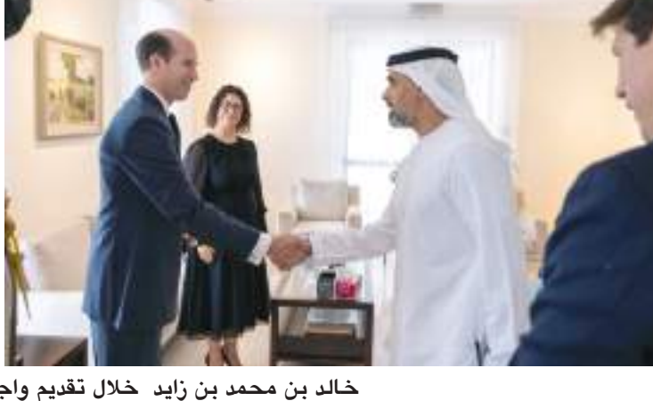
خالد بن محمد بن زايد خلال تقديم واجب العزاء في وفاة الملكة إليزابيث الثانية

عقود طويلة لخدمة وطنها وشعبها بكل تقان وإخلاص، حتى أضحت نموذجا يحتذى به في العطاء والالتزام بالقضايا الإنسانية، تاركة سجلا حافلا بالإنجازات سيبتزكره التاريخ وشعوب العالم بكل فخر واعتزاز. وعبر سموه عن تمنياته لجلالة الملك تشارلز الثالث، ملك المملكة المتحدة لبريطانيا العظمى وإيرلندا الشمالية، بدوام التوفيق والتقدم والأزدهار، واستمرار الشراكة المتميزة وعلاقة