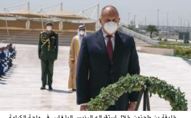
خليفة بن طحنون خلال استقباله الرئيس البلغاري في واحة الكرامة