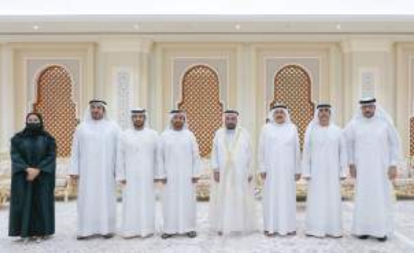
حاكم الشارقة خلال الاستقبال