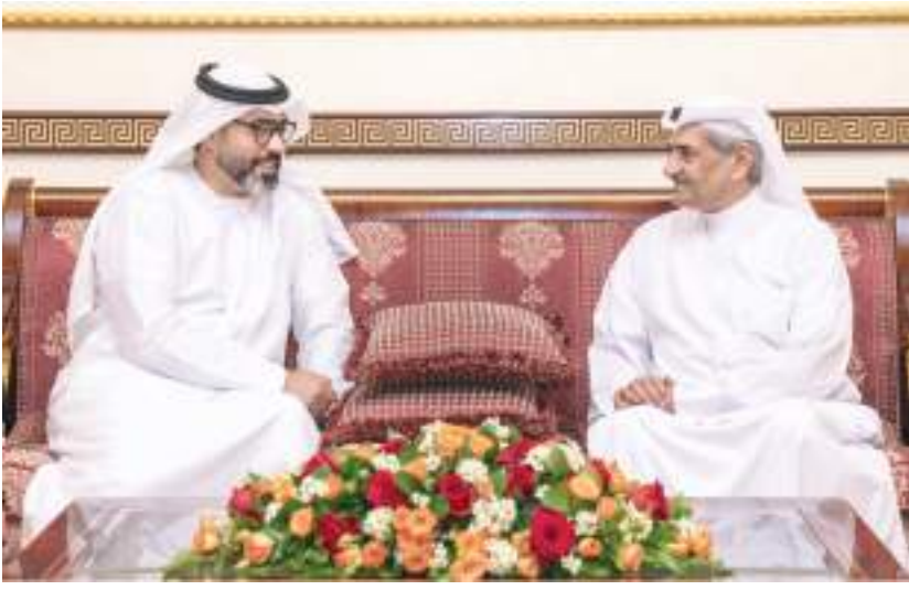
حاكم الفجيرة خلال استقباله سفير الدولة لدى جمهورية بنغلاديش