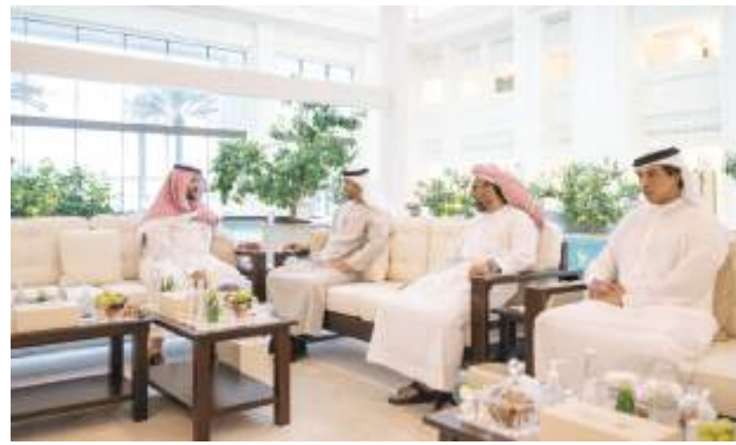
رئيس الدولة خلال مباحثاته مع الأمير خالد بن سلمان