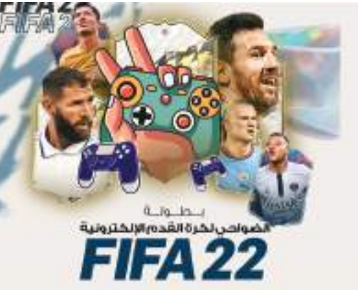
الشارقة - وام:

يطلق مجلس الشارقة الرياضي بطولة الضواحي لكرة القدم الإلكترونية بالتعاون مع دائرة شؤون الضواحي والقرى خلال الفترة من 30 سبتمبر الجاري إلى 2 أكتوبر المقبل بمشاركة 50 لاعبا من كل ضاحية .