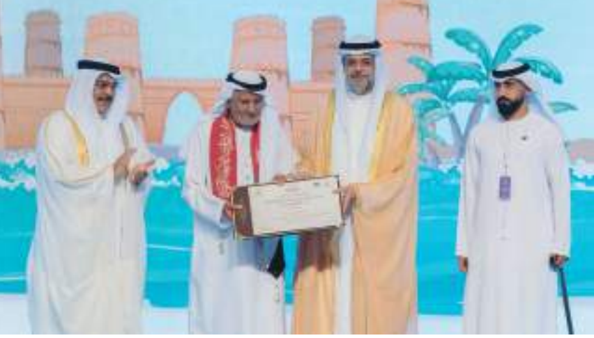
ولي عهد الشارقة خلال حضوره حفل الافتتاح

خليفة بن سالم بن نهيان. وبعد نهاية حفل الافتتاح تجول سمو الشيخ سلطان بن محمد بن سلطان القاسمي في أجنحة وأركان الملتقى، مطلعاً على المعرض المصاحب الذي تمحور حول شخصية الملاح والعالم الفلكي الإماراتي أحمد بن ماجد، واستمع إلى شرح مفصل حول ما يتضمنه الجناح من مقتنيات ومخطوطات وشروحات تبين دور ومكانة هذا الملاح الشهير. كما تفضل سموه بزيارة عدد من الأجنحة المتنوعة المشاركة في هذه الدورة من الملتقى، منها: مقهى الرواي، ومكتبة الملتقى، وهيئة البيئة والمحميات الطبيعية، وهيئة الشارقة للوثائق والأرشيف، ومشروع ثقافة بلا حدود، بالإضافة إلى المكتبة الوطنية، ونادي تراث الإمارات، ومركز حمدان بن محمد لإحياء التراث، والعديد من المرافق المتنوعة الأخرى. وتوقف سموه عند ركن /حكايات بحار/ حيث تابع سموه عرضاً لعدد من الأهازيج البحرية التراثية التي تشكل جزءاً من الذاكرة الشعبية البحرية في دولة الإمارات.