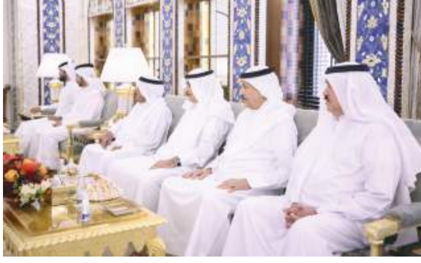
رئيس الدولة خلال مباحثاته مع ملك البحرين

توقع المركز الوطني للأرصاد أن يكون الطقس اليوم الخميس صحوًا بوجه عام وتظهر السحب المنخفضة صباحًا على الساحل الشرقي مع فرصة تكون بعض السحب الركامية الممطرة شرقًا وجنوبًا بعد الظهر... طيبًا ليلاً وصباح «الجمعة» مع احتمال تشكل الضباب الخفيف على بعض المناطق الساحلية، والرياح خفيفة إلى معتدلة السرعة وتنشط أحيانًا مثيرة للغبار. حركة الرياح: جنوبية شرقية - شمالية شرقية / ١٥ إلى ٣٠ تصل إلى ٤٠ كم/س. يكون الموج في الخليج العربي خفيفًا.