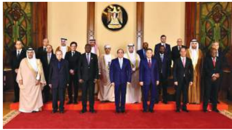
الرئيس المصري في صورة تذكارية خلال استقباله وزراء الإعلام العرب