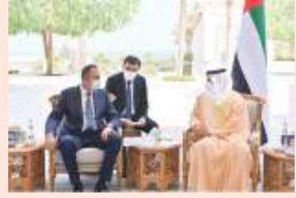
عبدالله بن زايد خلال تسلمه الرسالة