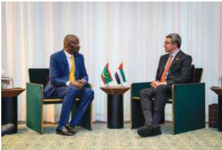
وسموه خلال لقائه وزير خارجية موريتانيا.