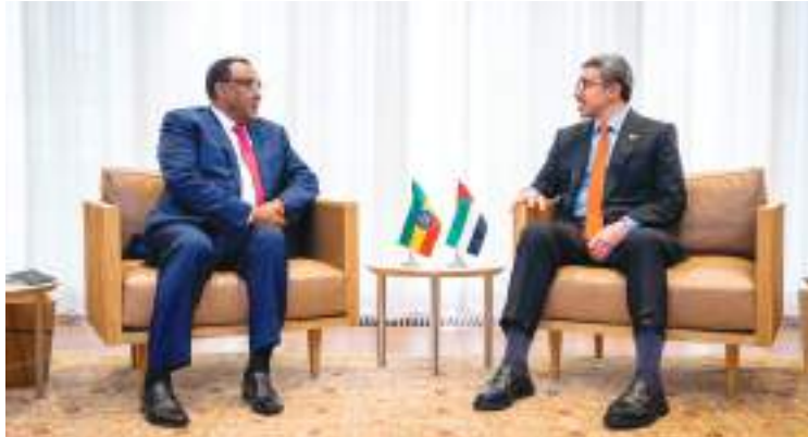
عبدالله بن زايد خلال لقائه وزير خارجية أنيويبا

فلاذيمير نوروف وزير خارجية أوزبكستان ومعالي ليفيا اجوستي وزيرة الدولة للشؤون الخارجية الاتحادية السويسرية ومعالي محمد سالم ولد مرزوق وزير الشؤون الخارجية والتعاون والموريتانيين في الخارج. وجرى خلال اللقاءات بحث آفاق التعاون الثنائي والشراكة بين دولة الإمارات وهذه الدول في عدة قطاعات ومنها الطاقة والطاقة المتجددة والأمن الغذائي والاقتصادية والتعليمية والسياحية والاستثمارية والثقافية. كما تم استعراض الجهود العالمية المبذولة في مجال مكافحة التغير المناخي خاصة مع استضافة دولة الإمارات لمؤتمر الدول الأطراف COP٢٨