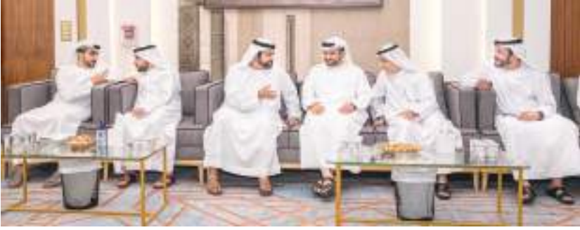
ولي عهد الفجيرة خلال تقديم واجب العزاء