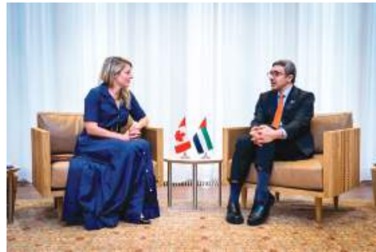
عبدالله بن زايد خلال لقائه وزيرة خارجية كندا