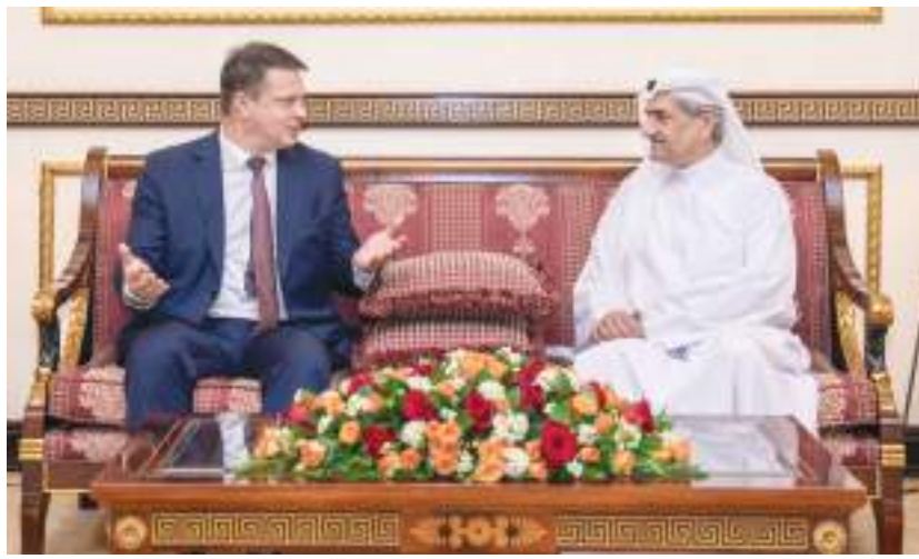
حاكم الفجيرة خلال استقباله السفراء