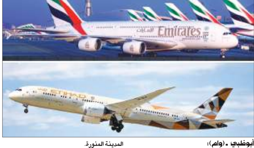
أبو ظبي - (وام) :

عززت الناقلات الوطنية دولة الإمارات رحلاتها إلى المملكة العربية السعودية على مدار السنوات الماضية في خطوة تستهدف مواكبة طلب العملاء والنمو المطرد لحركة الطيران بين البلدين في ظل العلاقات التاريخية المتجددة والروابط الاقتصادية والثقافية الراسخة التي تربط القبايتين والشعبين الشقيقين.