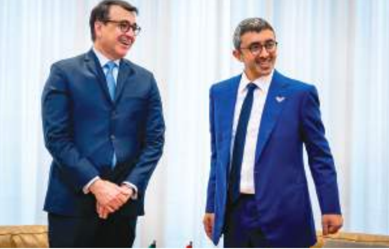
عبدالله بن زايد خلال مباحثاته مع وزير خارجية البرازيل