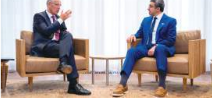
عبدالله بن زايد خلال لقائه الأمين العام لحلف «الناتو»