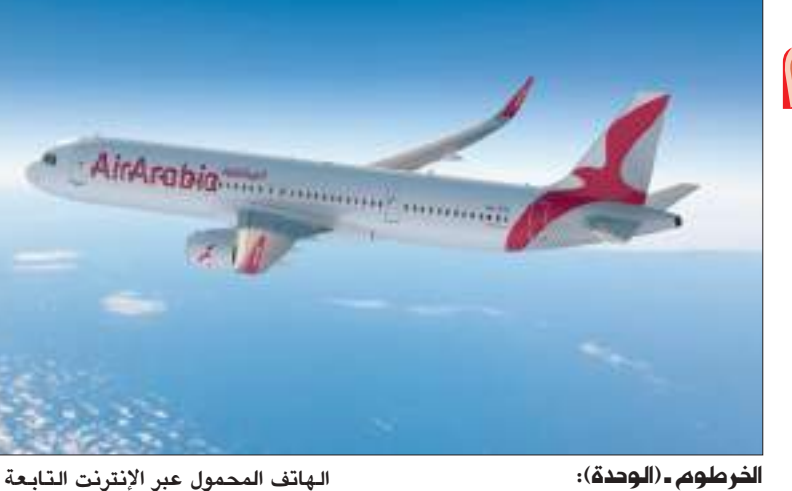
الخرطوم - (الوحدّة) :

أعلنت «العربية للطيران» و«مجموعة دال» أكبر تكتل تجاري في القطاع الخاص السوداني، أنهما تعتزمان إطلاق شركة طيران جديدة في السودان «العربية للسودان»، والتي تتخذ من مطار الخرطوم الدولي مقراً لها.