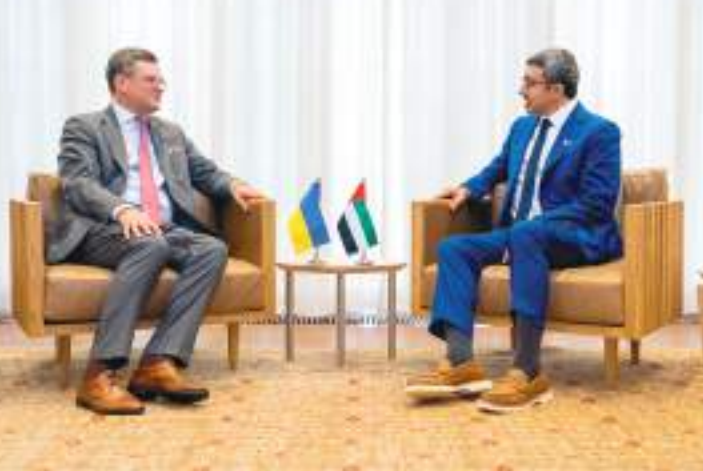
عبدالله بن زايد خلال مباحثاته مع وزير خارجية أوكرانيا

التقى سمو الشيخ عبدالله بن زايد آل نهيان وزير الخارجية والتعاون الدولي معالي دميتري كوليبا وزير خارجية أوكرانيا وذلك على هامش أعمال الدورة الـ ٧٧ للجمعية العامة للأمم المتحدة في نيويورك. جرى خلال اللقاء بحث العلاقات الثنائية بين دولة الإمارات وأوكرانيا وسبل تعزيزها في المجالات كافة لاسيما الأمن الغذائي والتبادل التجاري. كما استعرض الجانبان تطورات الأزمة في أوكرانيا، وأكد سمو الشيخ عبدالله بن زايد آل نهيان - في هذا الصدد - استعداد دولة الإمارات للمساهمة في دعم كافة الجهود الرامية لإعادة الاستقرار وإرساء السلام من خلال الحل الدبلوماسي المستدام. حضر اللقاء.. معالي ريم بنت إبراهيم الهاشمي وزيرة دولة لشؤون التعاون الدولي ومعالي مريم بنت محمد سعيد حارب المهيري وزيرة التغير المناخي