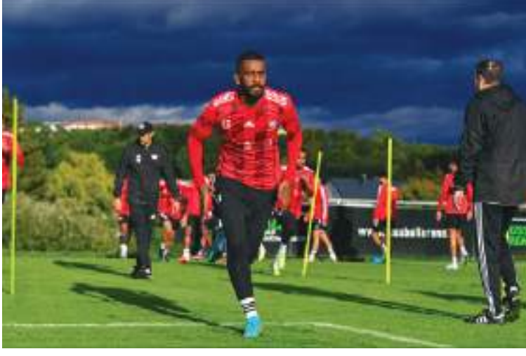
فيينا - وام:

المنتخب القوية، وتتخلل التجمعات المشاركة في بطولة خليجي 25 في يناير 2023، وبطولة غرب آسيا، وصولاً للمشاركة في نهائيات كأس آسيا 2023. وقال " تم وضع خطة طموحة من قبل اتحاد الكرة ولجنة المنتخبات الوطنية لإعداد المنتخب، بالتنسيق مع الجهاز الفني، من أجل ضمان أفضل إعداد لأنه مقبل على مشاركات مهمة، ونأمل أن يحقق خلالها النتائج المرجوة". وأضاف " البداية ستكون بمباراة الغد أمام منتخب باراغواي، وهي المواجهة الودية الأولى للأبيض في الموسم الحالي، كما سيلعب المنتخب ودية دولية ثانية يوم 27 الجاري أمام فنزويلا قبل العودة إلى البلاد، ونعلم جميعاً أن مثل هذه المباريات الودية هدفها الحصول على فوائد فنية بغض النظر عن النتائج".