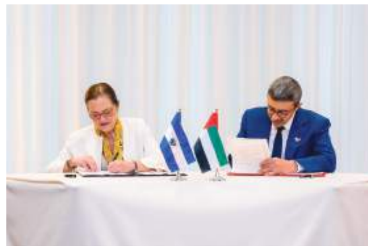
عبدالله بن زايد خلال لقائه وزيرة خارجية السلفادور

وتعزيز الجهود العالمية المبذولة لصون السلم والأمن الدوليين. وفي هذا الصدد، أكد سمو الشيخ عبدالله بن زايد آل نهيان، على أهمية تعزيز الشراكات العالمية والتعاون الدولي في مواجهة التحديات الحالية من أجل خلق فرص متنوعة لتحفيز النمو الاقتصادي في المجتمعات. كما جرى خلال اللقاءات بحث علاقات التعاون الثنائي والشراكة بين دولة الإمارات وهذه الدول في المجالات كافة ومنها الاقتصادية والاستثمارية