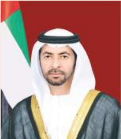
حمدان بن زايد