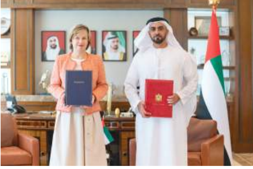
سيف بن زايد في صورة تذكارية خلال لقائه المدير التنفيذي لـ «اليوروبول»