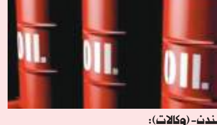
لندن - (وكالات) :

تراجعت أسعار النفط في المعاملات الآسيوية المبكرة يوم الخميس بعد أن رفع مجلس الاحتياطي الاتحادي (البنك المركزي الأمريكي) سعر الفائدة بدرجة كبيرة للسيطرة على التضخم، إذ ألقت المخاوف المرتبطة بالاقتصاد العالمي بظلالها على الطلب على الوقود مستقبلاً. وبحلول الساعة ٠١:٣٣ بتوقيت جرينتش انخفضت العقود الآجلة لخام برنت ١٦ سنتاً أو ٠,٢ بالمئة إلى ٨٩,٦٧ دولار للبرميل، في حين تراجعت العقود الآجلة لخام غرب تكساس الوسيط ١٥ سنتاً إلى ٨٢,٧٩ دولار للبرميل.