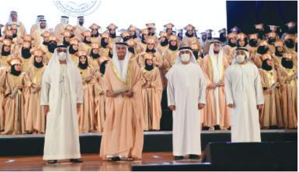
حامد بن زايد في صورة تذكارية خلال حضوره حفل تخريج طلبة جامعة محمد بن زايد للعلوم الإنسانية

شهد سمو الشيخ حامد بن زايد آل نهيان عضو المجلس التنفيذي لإمارة أبوظبي، احتفال جامعة محمد بن زايد للعلوم الإنسانية بتخريج دفعة جديدة من طلابها في برامج البكالوريوس والماجستير والدكتوراه ضمت ١٦٥ طالباً وطالبة.