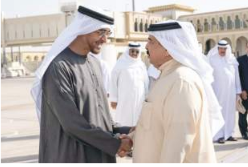
رئيس الدولة في مقدمة مودعي ملك البحرين