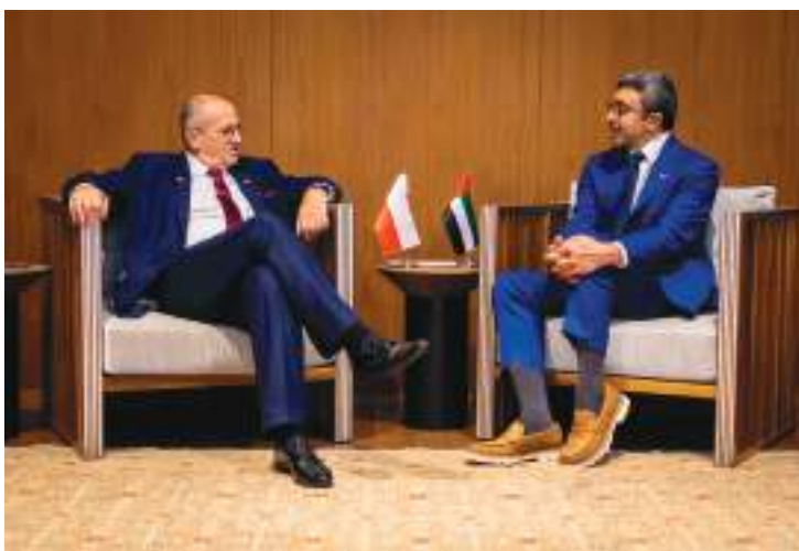
وسموه خلال لقائه وزير خارجية بولندا

كما التقى سموه، على هامش أعمال الدورة الـ ٧٧ من الجمعية العامة للأمم المتحدة، معالي جوانا الكساندرا وزيرة خارجية السلفادور، حيث جرى بحث العلاقات الثنائية بين البلدين وسبل تعزيزها وتطويرها على الصعد كافة. وعقب اللقاء، وقع سمو الشيخ عبدالله بن زايد آل نهيان ومعالي وزير خارجية السلفادور على مذكرة تفاهم بشأن المشاورات السياسية بين البلدين. كما وقع سموه ومعالي جوانا الكساندرا على مذكرة تفاهم بشأن إنشاء لجنة