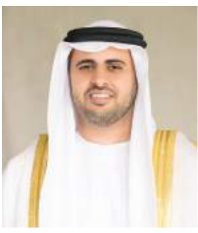
ذياب بن محمد بن زايد

وبين أن تأكيد أكثر من نصف شباب دول مجلس التعاون لدول الخليج العربية على أهمية اللغة العربية في حياتهم، هو تأكيد على المكانة المتميزة للغة العربية في تشكيل الثقافة الواعي لشباب المنطقة، كما أنها تبرز الارتباط الواسع بين العربية والموروث المعرفي والثقافي لدول المنطقة، والتي تستند في علاقاتها مع شعوب العالم على المبادئ والعادات والتقاليد العربية الأصيلة التي قامت عليها وتعد أحد المكونات الرئيسية لهويتها.