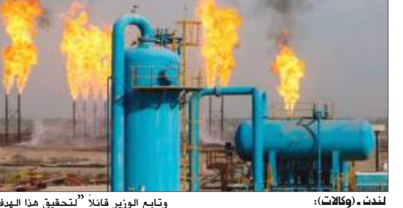
لندن - (وكالات) :

أتعت الحكومة البريطانية، الخميس، الحظر المفروض على ترخيص المحاجر الهيدروليكية لاستخراج الغاز الصخري منذ عام ٢٠١٩، وقال وزير العمل البريطاني جاكوب ريس موج، في تصريح صحفي، «في ضوء غزو الرئيس الروسي فلاديمير بوتين غير الشرعي لأوكرانيا، فإن تعزيز أمن الطاقة لدينا يمثل أولوية مطلقة». وأضاف موج: «كما قالت رئيسة الوزراء البريطانية ليز تراس، علينا التأكد بأن تصبح المملكة المتحدة مصدر كامل للطاقة بحلول عام ٢٠٤٠».