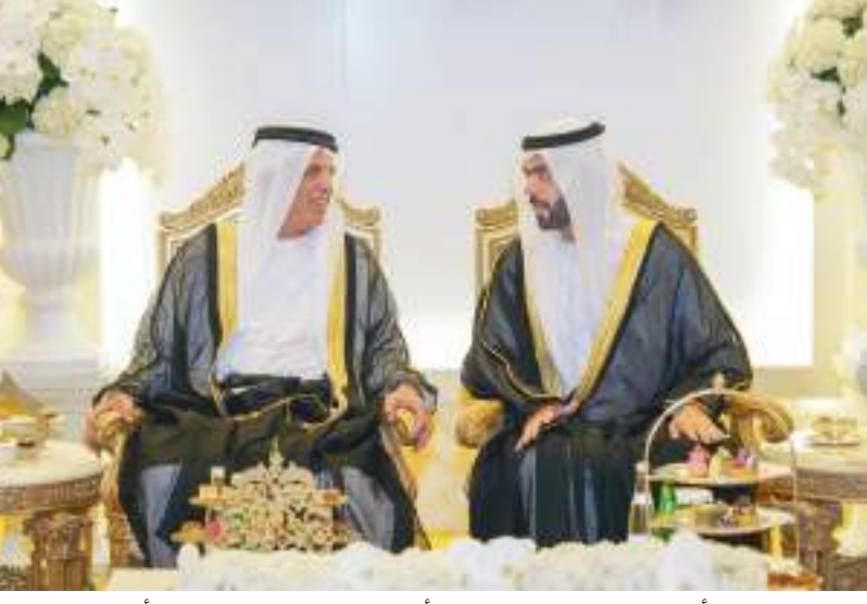
حاكم رأس الخيمة خلال حضوره أفراح غباش والفلاسي في أبوظبي