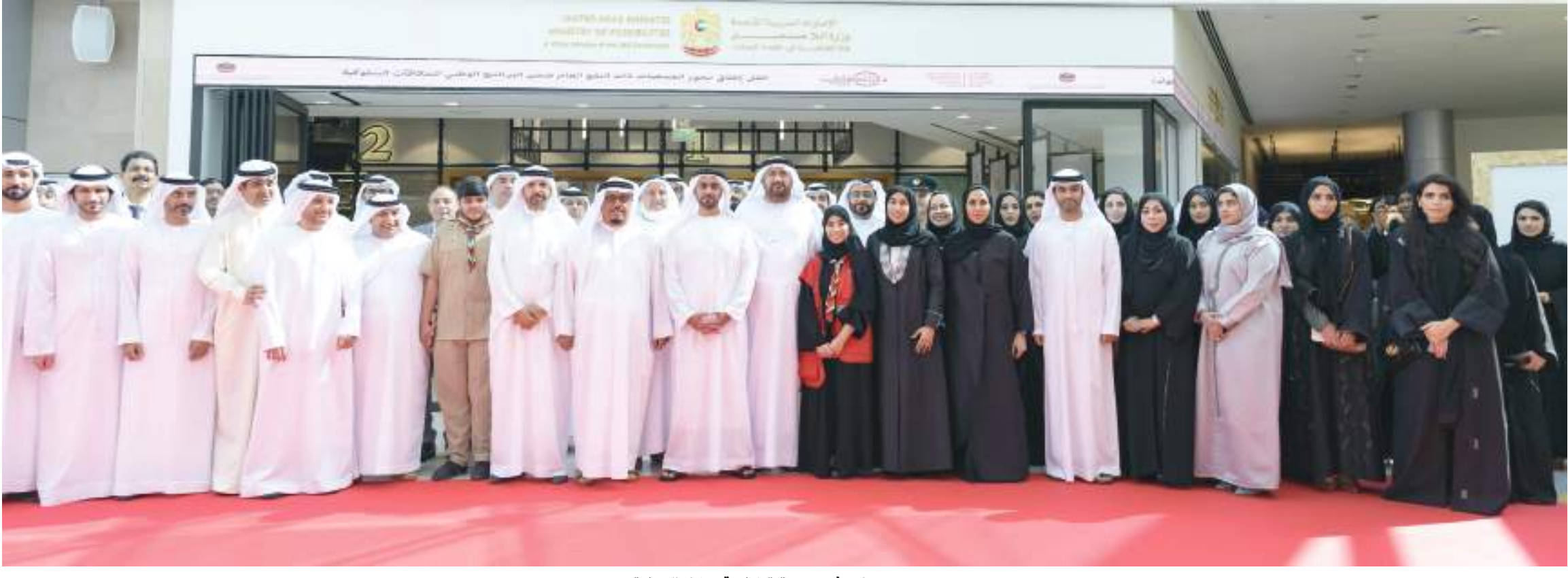
سيف بن زايد في صورة تذكارية خلال الزيارة