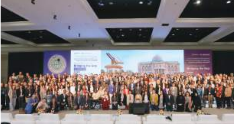
الشارقة / وام /