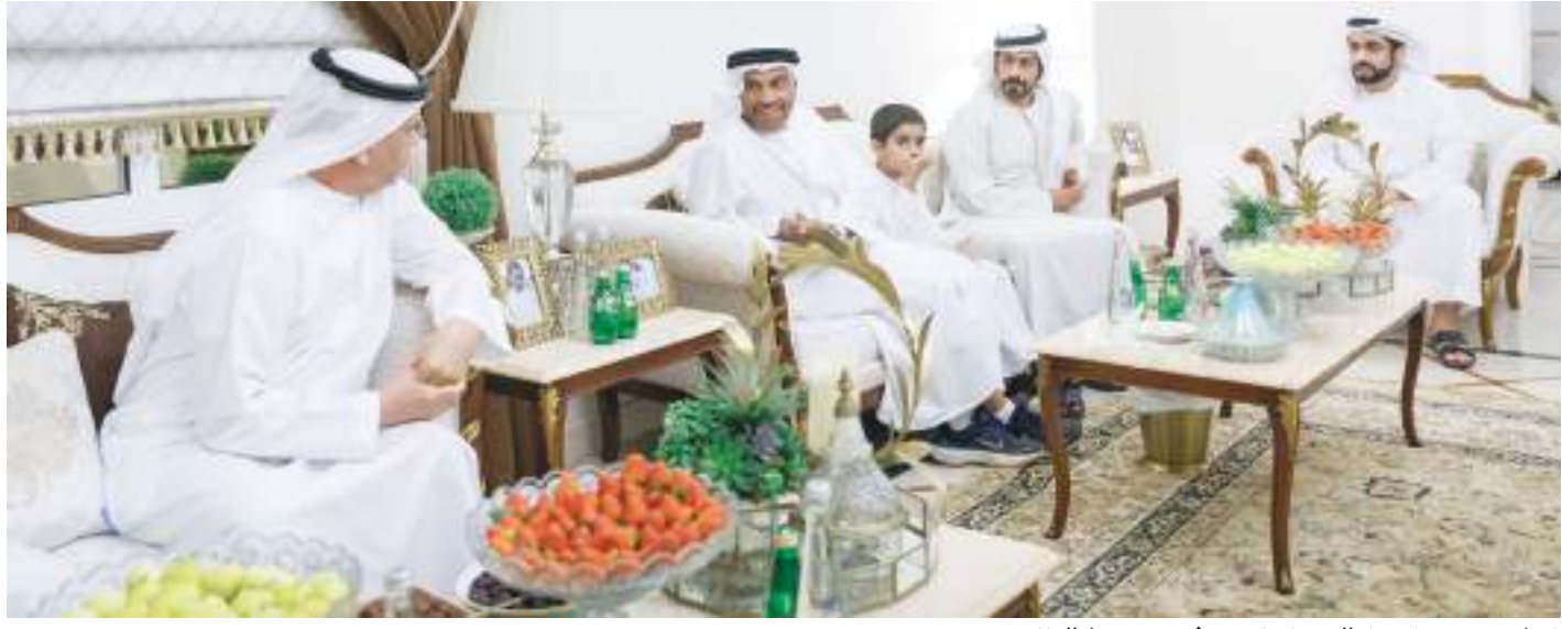
اختتم سلسلة زيارته في مدينة العين ..