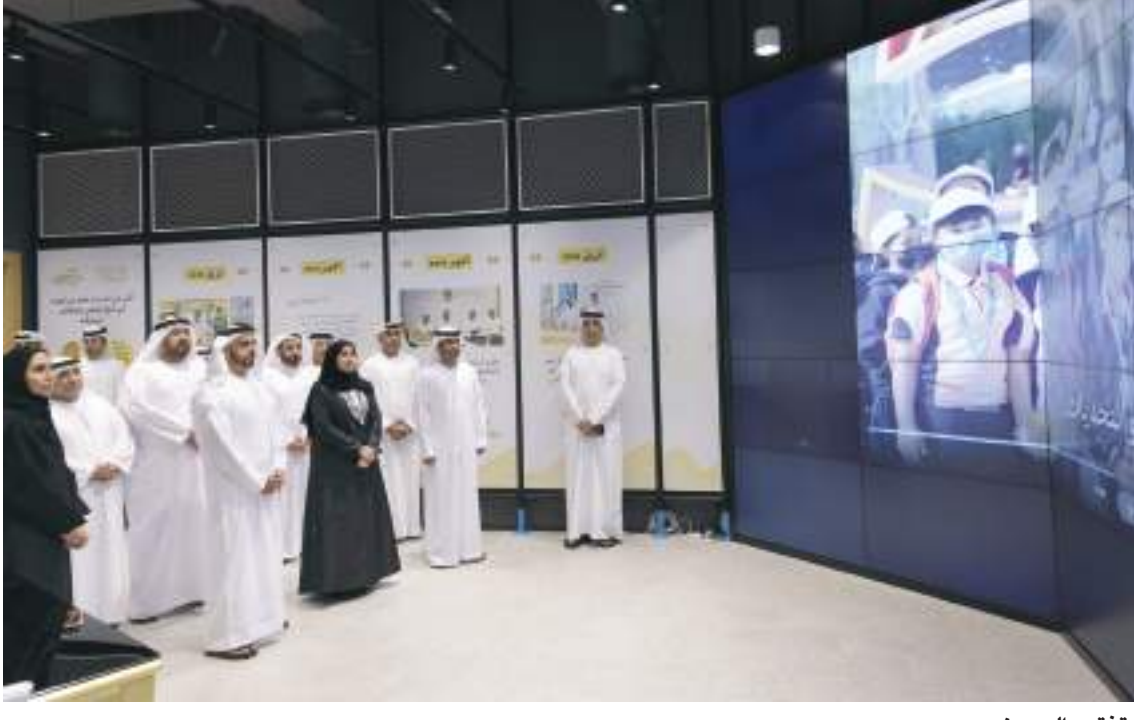
سيف بن زايد خلال تفقده المعرض