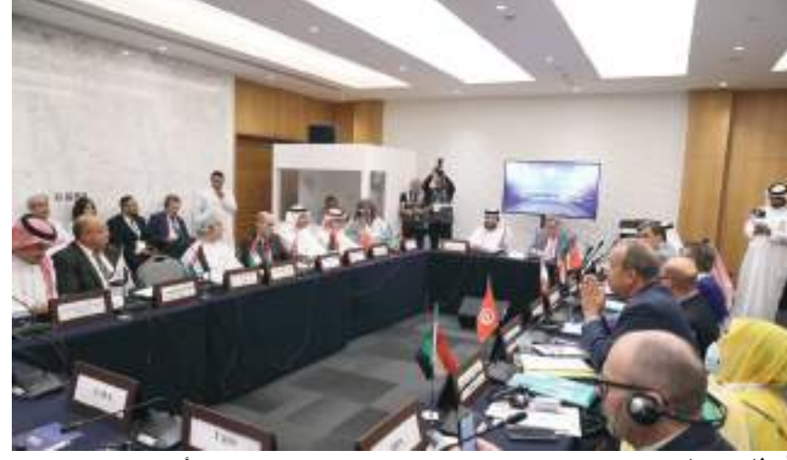
أبوظبي / وام /

على وجه الخصوص كما أن جهودنا كغريب عمل واحد في الدول العربية: تستدعي منا مواصلة التفكير والتخطيط والعمل سوياً في مواجهة التحديات ومناقشة القضايا المهمة التي ترتبط بصناعة القصة الخيرية ومصداقية الرسالة وأخلاقيات المهنة. وأشار إلى أهمية تعزيز العمل الإخباري المشترك، واستدامة التنسيق وتوحيد الجهود في إيصال الرسائل الإعلامية الهادفة لتلبية احتياجات مؤسساتنا الإعلامية المختلفة، وتنمية مجتمعاتنا، وتحقيق سعادة شعوبنا.