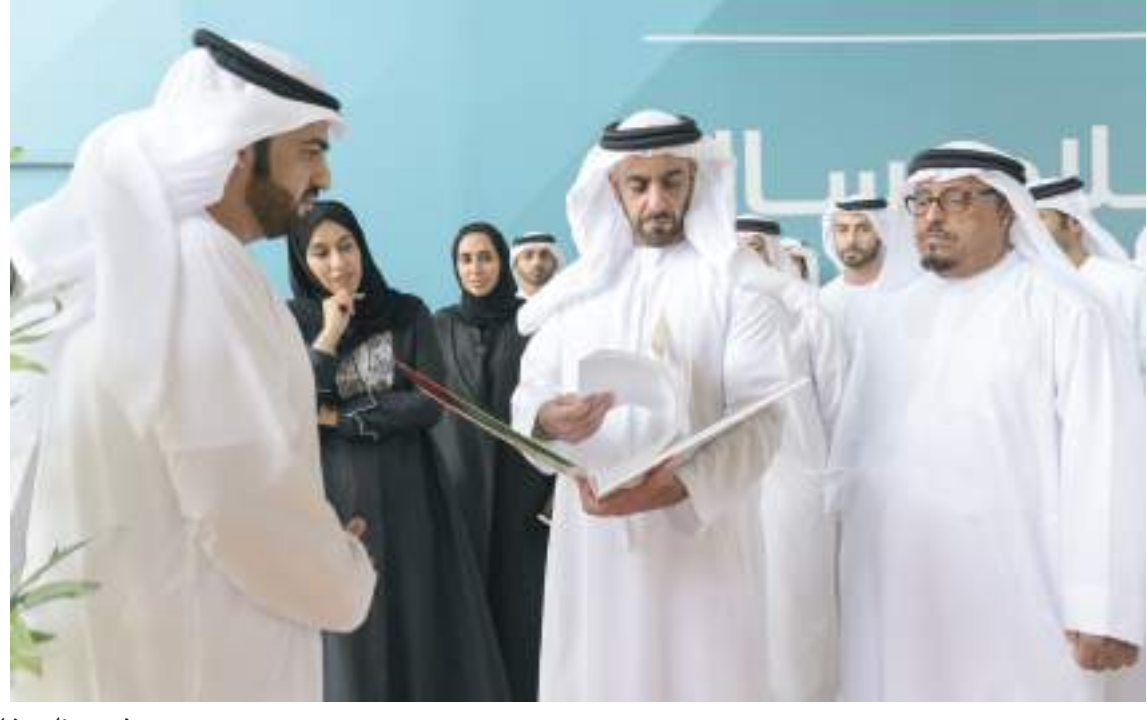
سيف بن زايد خلال تفقده المعرض