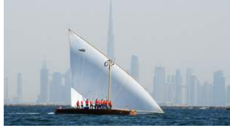
دبي - الوحدة:

على المراكز الأولى في الجولة الثانية والتي تمثل ختام منافسات هذه الفئة في الموسم الحالي حيث يتجدد الصراع على صدارة الترتيب العام لبطولة دبي 2022-2023. وشهدت عملية التسجيل في السباق المرتقب اقبالا كبيرا من قبل الملاك والنواخذة حيث سجلت القوارب حضوراً متميزاً في الجولة الأولى والإفتتاحية التي نظّمها نادي دبي الدولي للرياضات البحرية شهر أكتوبر الماضي بمشاركة زادت عن 80 قارباً اجبرت لمسافة تزيد عن 14 ميلاً بحرياً من عمق مياه الخليج العربي وحتى خط النهاية قبالة شواطئ جميرا.