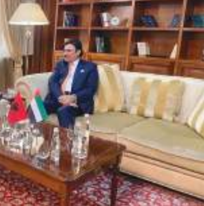
تيرانا / وام /

استقبل فخامة بيرم بيغاي، رئيس جمهورية ألبانيا، سعادة سليمان حامد المزروعى، سفير دولة الإمارات لدى الجمهورية اليونانية السفير غير المقيم لدى ألبانيا، وذلك في القصر الرئاسي في العاصمة «تيرانا»، في إطار انعقاد أعمال الأسبوع الثقافي. ونقل سعادته خلال اللقاء تحيات صاحب السمو الشيخ محمد بن زايد آل نهيان رئيس الدولة «حفظه الله»، وصاحب السمو الشيخ محمد بن راشد آل مكتوم نائب رئيس الدولة في مختلف المجالات، إضافة إلى عدد من المواضيع ذات الاهتمام المشترك.