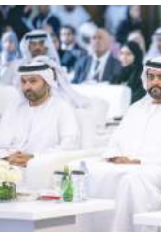
ولي عهد الفجيرة خلال حضوره فعاليات مؤتمر الفجيرة الدولي للفلسفة

أكد سمو الشيخ محمد بن حمد الشرقي ولي عهد الفجيرة دور العلوم الفلسفية في رفع الوعي الإنساني في المجتمعات البشرية وتشكيل هويتها الثقافية مشيراً إلى توجيهات صاحب السمو الشيخ حمد بن محمد الشرقي عضو المجلس الأعلى حاكم الفجيرة بتبني مشروعات جادة لتعزيز المعرفة والفكر وتحقيق أقصى فائدة منها.