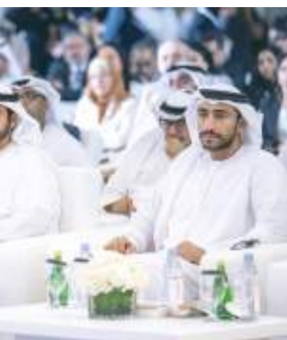
ولي عهد الفجيرة خلال حضوره فعاليات مؤتمر الفجيرة الدولي للفلسفة

أكد سمو الشيخ محمد بن حمد الشرقي ولي عهد الفجيرة دور العلوم الفلسفية في رفع الوعي الإنساني في المجتمعات البشرية وتشكيل هويتها الثقافية مشيراً إلى توجيهات صاحب السمو الشيخ حمد بن محمد الشرقي عضو المجلس الأعلى حاكم الفجيرة بتبني مشروعات جادة لتعزيز المعرفة والفكر وتحقيق أقصى فائدة منها.