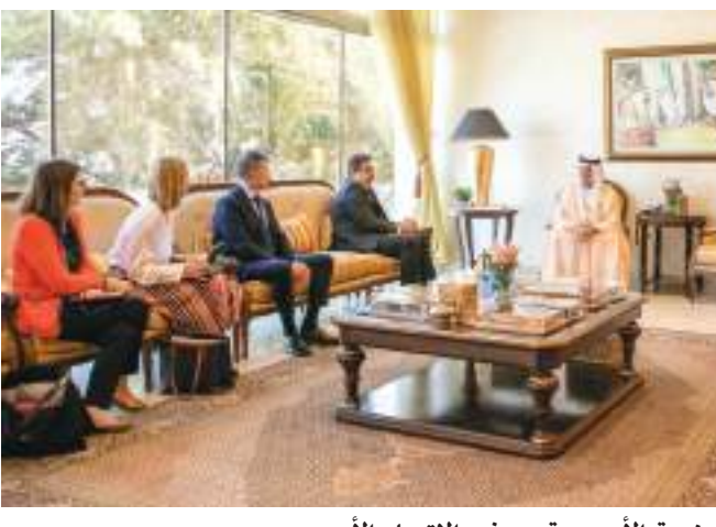
حاكم رأس الخيمة خلال استقباله نائب رئيس المفوضية الأوروبية وسفير الاتحاد الأوروبي

ورحب صاحب السمو حاكم رأس الخيمة بسعادة نائب رئيس المفوضية الأوروبية وسعادة السفير والوفد المرافق لهما وتبادل معهما الأحاديث حول تعزيز علاقات التعاون بين دولة الإمارات والاتحاد الأوروبي على مختلف الصعد.