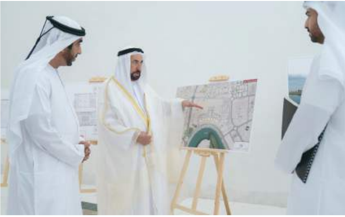
حاكم الشارقة خلال تفقده سير العمل في مشروع المباني الجديدة لجامعة كلباء