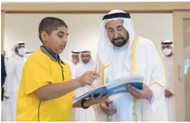
..وسموه خلال تجوله في مدرسة فيكتوريا الدولية

من ناحية أخرى افتتح صاحب السمو الشيخ الدكتور سلطان بن محمد القاسمي