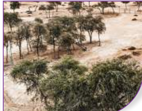
حصن المزرع في أمانة رأس الخيمة