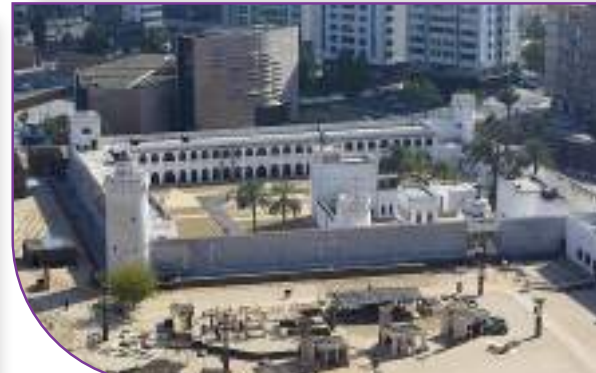
قصر الحصن في أبو ظبي

القاسمي، وهو عبارة عن مبنى كبير محصن له ثلاثة أبراج، هي الكبس والمحلوسة ومشرف، ويتكون من طابقين، فيهما حجرات كثيرة، استخدمت لأغراض متعددة.