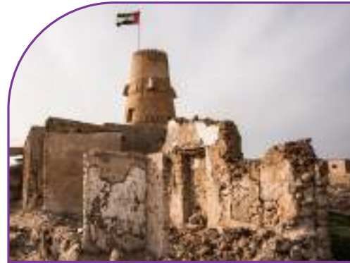
حصن قبيلة زعاب في جزيرة الحمراء