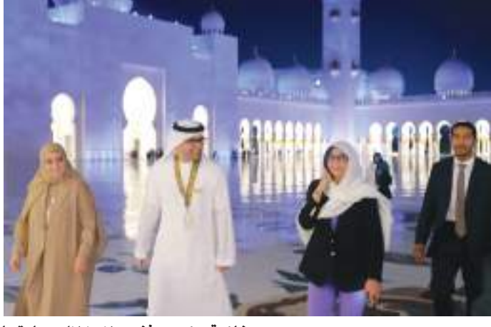
نائبة رئيس فنزويلا خلال زيارتها جامع الشيخ زايد الكبير في أبوظبي