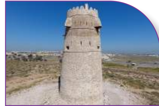
إحدى القلاع في جزيرة الحمراء

بقلم الشاعر والكتّاب أنور بن حمدان الزعابي