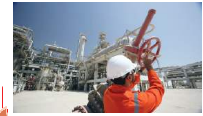
دبيجا - (وام):

أعلن مركز دبي للسلع المتعددة- المنطقة الحرة الرائدة على مستوى العالم والسلطة التابعة لحكومة دبي المختصة بتجارة السلع والمشاريع- عن إبرام شراكة مع «كومتك جولد» لرقمنة عملية تداول الذهب من خلال إصدار رموز مشفرة لتداولات المعدن الثمين مدعومة بسبائك ذهب مادية مسجلة في منصة «تريد فلو» التابعة للمركز. وتعد منصة «تريد فلو» التابعة لمركز دبي للسلع المتعددة منصة إلكترونية لتسجيل ملكية السلع المخزنة في مرافق لتسهيل بولة الإمارات العربية المتحدة. وسيتم إنشاء رموز «كومتك جولد» (CGO) على شبكة البلوك تشين (XDC XINFIN PROTOCOL) بناءً على إيداع سبائك الذهب المادية الموجودة في الخزائن المعتمدة من مركز دبي للسلع المتعددة. وسيتم دعم كل سبيكة ذهبية بضمان من «تريد فلو» مما يجمع بين السهولة المتزايدة لتداول الأصول المرزمة والأمان الإضافي والشفافية وتخصيص الأصول الحقيقية التي توفرها ضمانات المنصة. ويمثل كل رمز مشفر جراماً واحداً من الذهب وبالتالي سيتمكن المستثمرون