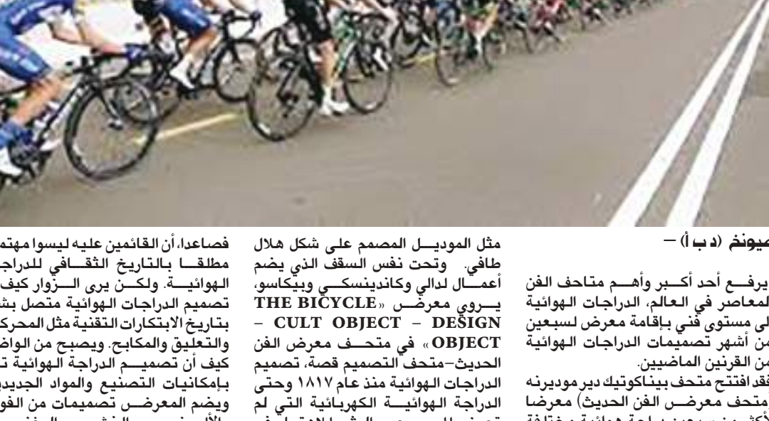
ميونخ (د ب أ) -

يرفع أحد أكبر وأهم متاحف الفن المعاصر في العالم، الدراجات الهوائية إلى مستوى فني بإقامة معرض لسبعين من أشهر تصاميم الدراجات الهوائية من القرنين الماضيين.