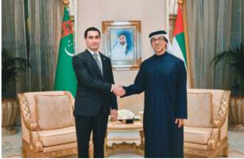
منصور بن زايد خلال لقائه رئيس تركمانستان

أبوظبي- وام: التقى سمو الشيخ منصور بن زايد آل نهيان نائب رئيس مجلس الوزراء وزير ديوان الرئاسة فخامة سردار بردي محمديف رئيس جمهورية تركمانستان الصديقة، يوم الاثنين، في مقر إقامة قصر الإمارات في أبوظبي، بحضور سمو الشيخ نياز بن محمد بن زايد آل نهيان عضو المجلس التنفيذي لإمارة أبوظبي. ورحب سمو الشيخ منصور بن زايد آل نهيان