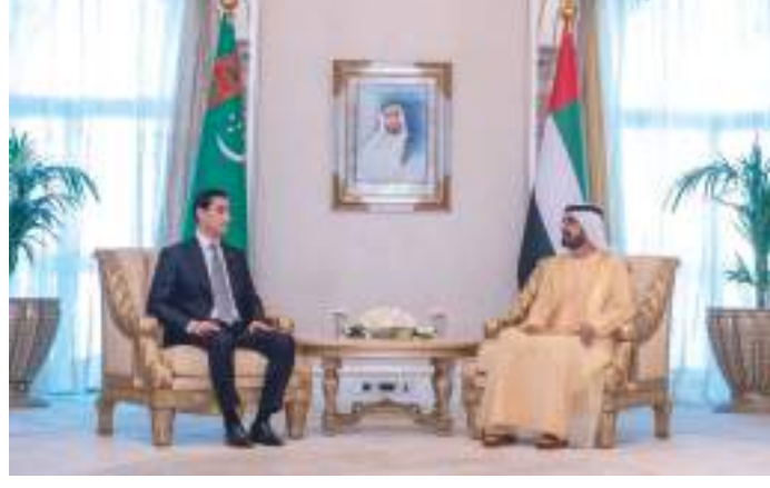
محمد بن راشد خلال مباحثاته مع رئيس تركمانستان

استقبل صاحب السمو الشيخ محمد بن راشد آل مكتوم نائب رئيس الدولة رئيس مجلس الوزراء حاكم دبي «رعاه الله» يوم الإثنين في قصر الإمارات بأبوظبي فخامة سردار بردي محمدوف رئيس جمهورية تركمانستان الصديقة، والوفد المرافق، بحضور سمو الشيخ حمدان بن محمد بن راشد آل مكتوم ولي عهد دبي. تم خلال اللقاء بحث العلاقات الثنائية وسبل تعزيز التعاون بين دولة الإمارات وجمهورية تركمانستان في مختلف المجالات، لاسيما على صعيد التبادل التجاري والسيادي بين البلدين، ومتطلبات الارتقاء بالتعاون الاستثماري وتهيئة المجال أمام القطاع الخاص لدى الجانبين لكي يكون شريكاً في تعزيز تلك الروابط