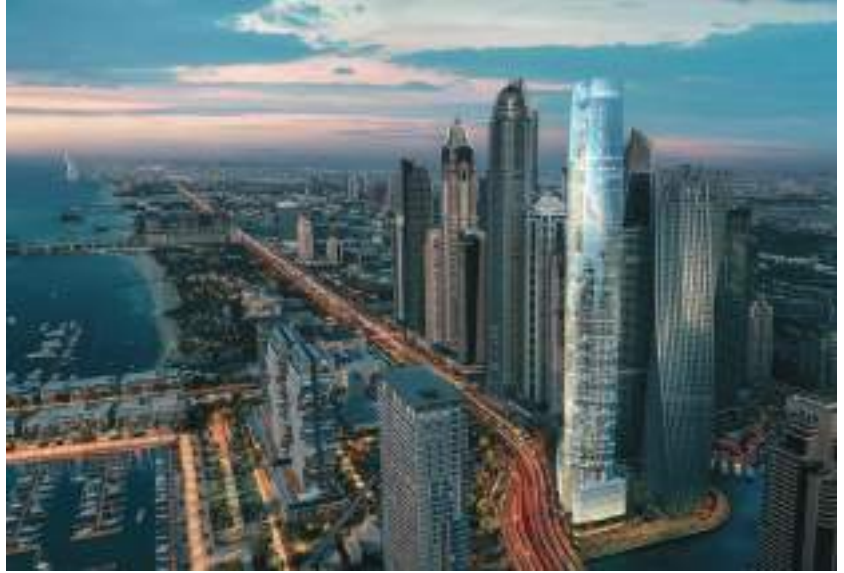
دبيجا - (وام):

بقيمة ١٥ مليون درهم في منطقة ند الشبا الأولى. وتصدرت منطقة الجبة الخامسة المناطق من حيث عدد المبيعات إذ سجلت ٤٣ مبيعة بقيمة ١٣٤ مليون درهم وتلتها منطقة اليفرة ٢ بتسجيلها ٧ مبيعات بقيمة ٧ ملايين درهم وثالثة في ند الشبا الأولى بتسجيلها ٥ مبيعات بقيمة ٤٣ مليون درهم. وفيما يتعلق بأهم مبيعات الشقق والفلل جاءت مبيعة بقيمة ٣٧ مليون درهم بمنطقة نخلة جميرا كأهم المبيعات تلتها مبيعة بقيمة ٣٣ مليون درهم في منطقة نخلة جميرا وأخيرا مبيعة بقيمة ٣٢ مليون درهم في منطقة نخلة جميرا.