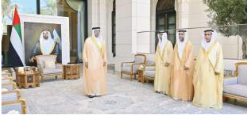
أمام منصور بن زايد القضاة وأعضاء النيابة العامة بأبوظبي خلال أداء اليمين القانونية

أبوظبي- وام: أقيمت اليوم، في قصر الوطن، وعبر سمو الشيخ منصور بن زايد آل نهيان، عن فخره واعتزازه بانضمام دفعة جديدة من الكوادر المواطنة إلى أعضاء السلطة القضائية، ليؤدوا مهامهم ومسؤولياتهم بكفاءة وفعالية في تحقيق العدالة وحفظ الحقوق، في ظل منظومة قضائية رائدة ومتطورة تدعم توجهات حكومة أبوظبي، وتسهم بشكل فاعل في تعزيز مكانتها التنافسية على المستوى العالمي. وأكد سموه، دعم القيادة الحكيمة لدولة الإمارات برئاسة صاحب السمو الشيخ محمد بن زايد آل نهيان رئيس الدولة "حفظه الله"، للمبادرات التطويرية الهادفة إلى توفير خدمات قضائية أفضل الخدمات العالمية المقدمة في القطاع العدلي والقضائي، اعتماداً على الكوادر الوطنية المؤهلة والمربية، مع الاستفادة من التقنيات الحديثة والوسائل الذكية والمبتكرة. ووجه سموه، أعضاء السلطة القضائية الجسد، إلى العمل بجد وتفانٍ من أجل رفعة الوطن واستدامة الريادة والتميز في مختلف القطاعات، مع التمسك بمبدأ سيادة القانون والعدالة الناجزة، مستفيدين من البنية الرقمية في دائرة القضاء، ودورها في تسهيل إنجاز الأعمال، بما ينعكس بدوره على كفاءة النظام القضائي في إمارة أبوظبي. حضر مراسم اليمين القانونية، سعادة المستشار يوسف سعيد العبري، وكيل دائرة القضاء في أبوظبي، وسعادة المستشار علي محمد البلوشي النائب العام لإمارة أبوظبي، والمستشار على الشاعر الظاهري، مدير إدارة التفقيش القضائي.