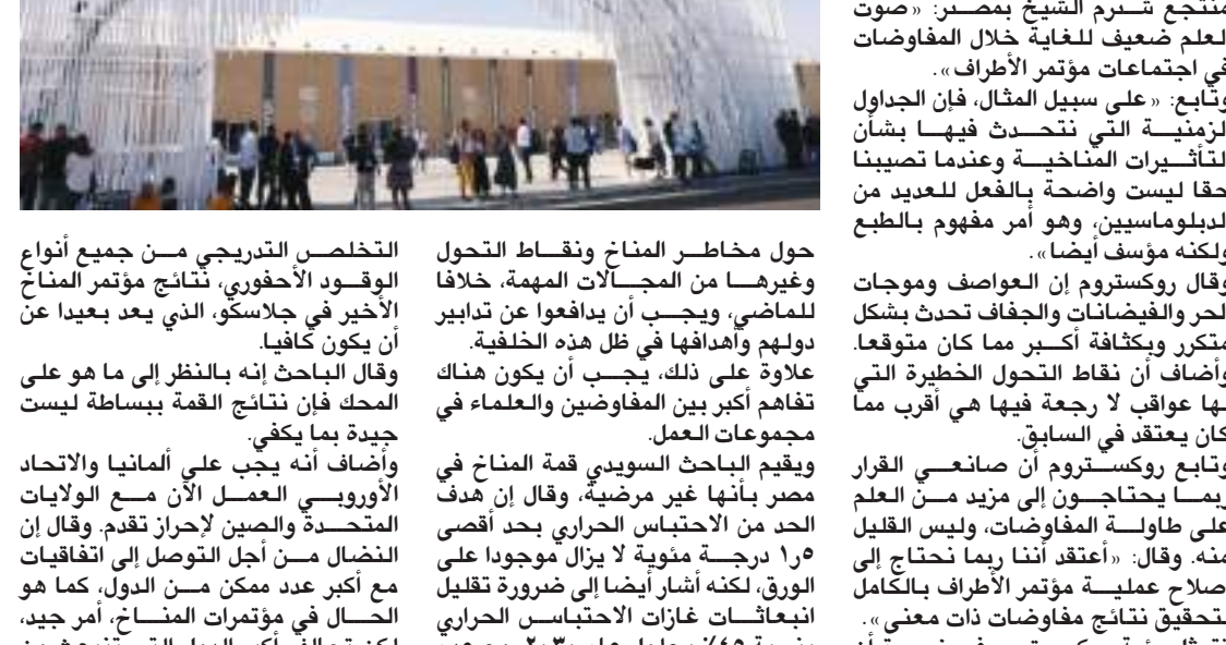
شوم الشيخ (مصر) نوفمبر (د ب أ) -

أكد الباحث الشهير في مجال المناخ يوهان روكستروم أهمية الإنصات أكثر إلى العلم في كفضاح المجتمع العالمي ضد أزمة المناخ.