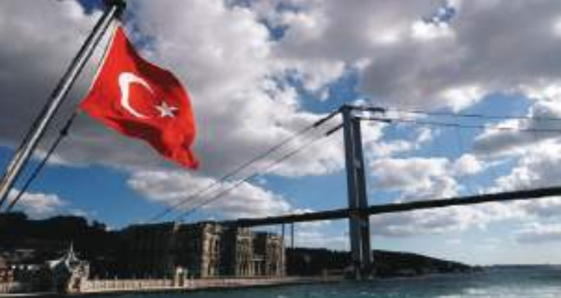
أنقرة - (وكالات):

قال من الالتزام السياسي لتطوير منهجها ضد غسل الأموال وتمويل الإرهاب، واتخذت خطوات بهذا الصدد. وأكد نباتي أن تركيا تعتبر متوافقة على نطاق واسع مع جميع معايير دوليا سيفتخ ضد بلدنا لا أساس لها وتضير أيضا بسعة تركيا، وغير وارد على الإطلاق مسألة فتح تحقيق مالي ضد بلدنا أو وضعها على القائمة السوداء لمجموعة العمل المالي. وأردف: «نحب أن يعتبر التقرير الذي أعده ممثل حزب سياسي وينسبه تقريبا للنشرة الإعلامية للتنظيمات الإرهابية، أنه تعبير عن الانزعاج من كفاخ بلانما ضد الإرهاب في كافة الهجالات والنجاحات التي حققتها في هذا الكفاخ».