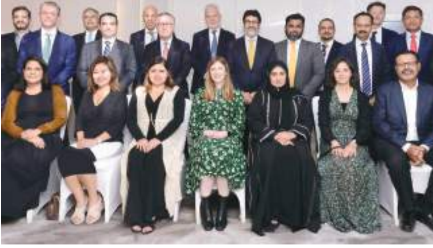
الدولية جزءاً مهماً في التنمية الاجتماعية والاقتصادية لأي بلد. وبصفتنا عضواً في نادي التحالف التجاري والشريك المصرفي الحضري في الجمعية العمومية لهذا العام في

ويتماشى دور بنك دبي الإسلامي بصفته مضيفا للجمعية العمومية لنادي التحالف التجاري وواحدًا من الأعضاء المنتسبين له، مع التزام البنك بتعزيز وتحفيز التجارة الدولية من خلال قسم العمليات المصرفية التابع لقطاع الخدمات المصرفية للشركات. وقال الدكتور عدنان شلوان، الرئيس التنفيذي لمجموعة بنك دبي الإسلامي: «تعد التجارة