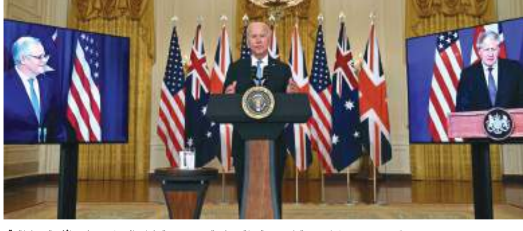
تبادل المعلومات الاستخباراتية، والتعاون في مجال الأمن السيبراني وتأمين سلاسل التوريد في كلا البلدين.

ويأتي تنفيذ هذا التمرين في إطار الخطط التدريبية السنوية التي تنتهجها البحرية السلطانية العمانية، وخطط التمارين البحرية المشتركة مع القوات الصديقة، وفي كل ما من شأنه إدامة مستويات الجاهزية لأسطول البحرية السلطانية العمانية ومنتسبيها في مختلف التخصصات البحرية، وبما يتماشى والمهام الوطنية المنوطة بها.