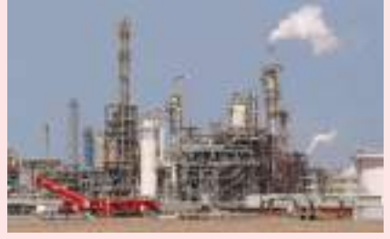
الكويت - (وكالات):

وقالت عدة مصادر بقطاع النفط يوم الاثنين إن مصفاة الزور الكويتية أرسلت أول عطاء لبيع زيت الوقود منخفض الكبريت على شركة نطق كبرى. وبيعت الشحنة بعلاوة نحو ١٧ دولارا للطن فوق أسعار سنغافورة على أساس التسليم على ظهر السفينة (فوب). وكانت المصفاة قد طرحت ١٠٠ ألف طن من المنتج للشحن بين يومي ٢٨ و٢٩ نوفمبر تشرين الثاني في عطاء أغلق يوم ١٨ نوفمبر تشرين الثاني. ولم يتضح ميناء التسليم حتى الآن، على الرغم من قول مصادر بالقطاع إن الشحنة إما ستوجه إلى آسيا أو ساحل الخليج بالولايات المتحدة. والشركة الكويتية للصناعات البترولية المتكاملة (كبيك) هي شركة تابعة لمؤسسة البترول الكويتية. ولم ترد أي منها حتى الآن على طلبات للتعقيب.