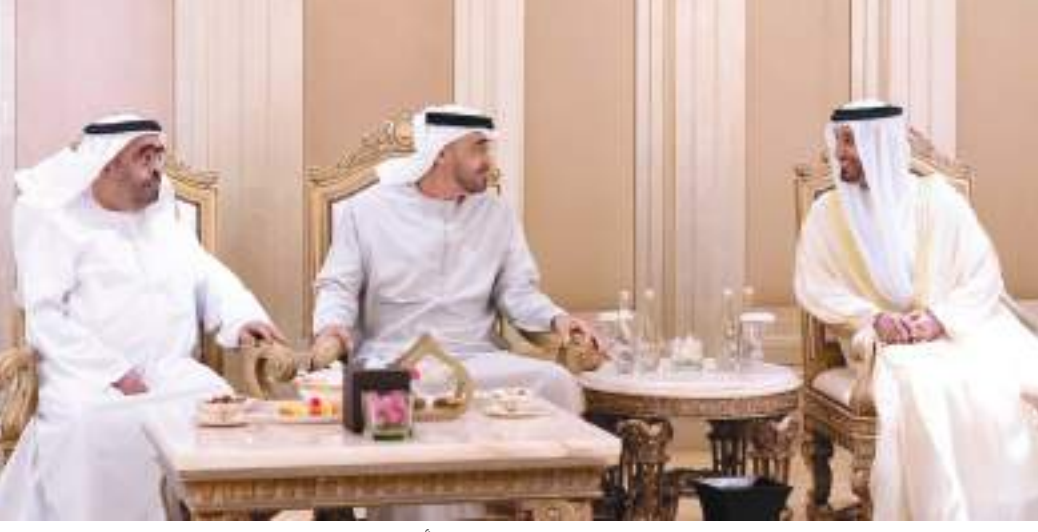
محمد بن زايد خلال حضوره حفل زفاف أحمد سلطان الظاهري

حضر صاحب السمو الشيخ محمد بن زايد آل نهيان رئيس الدولة «حفظه الله» حفل الاستقبال - الذي أقامه يوم الاثنين في فندق قصر الإمارات - سلطان سرور الظاهري بمناسبة زفاف أخيه أحمد إلى كريمة الشيخ سيف بن محمد بن بطي آل حامد. كما حضر الحفل .. صاحب السمو الشيخ سعود بن صقر القاسمي عضو المجلس الأعلى حاكم رأس الخيمة وسمو الشيخ محمد بن سعود بن صقر القاسمي ولي عهد رأس الخيمة والفريق سمو الشيخ سيف بن زايد آل نهيان نائب رئيس مجلس الوزراء وزير الداخلية وسمو الشيخ منصور بن زايد آل نهيان نائب رئيس مجلس الوزراء وزير ديوان الرئاسة وسمو الشيخ الدكتور سلطان بن خليفة آل نهيان مستشار صاحب السمو رئيس الدولة وسمو الشيخ حمدان بن محمد بن زايد آل نهيان ومعالى الشيخ نهيان بن مبارك آل نهيان وزير التسامح والتعايش. وهناً صاحب السمو رئيس الدولة