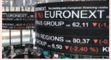
لندن - (وكالات):

تراجعت الأسهم الأوروبية في بداية التعامل يوم الاثنين إذ قادت القطاعات الحساسة للعوامل الاقتصادية مثل شركات التعدين والشركات الصناعية الخسائر وسط مخاوف من تأثير ارتفاع الإصابات بكوفيد-١٩ في الصين. وهبط المؤشر ستوكس ٦٠٠ الأوروبي ٠,٢ في المئة بحلول الساعة ١٠:١١ بتوقيت جرينتش بعد أن سجل خامس ارتفاع أسبوعي له على التوالي يوم الجمعة. وانخفضت الأسهم الآسيوية ١,٣ في المئة جراء شعور المستثمرين بقلق من التداعيات الاقتصادية للقيود الجديدة لكوفيد-١٩ في الصين بعد أن حدثت المنطقة الأكثر اكتظاظا بالسكان في بكين السكان على أن يلزموا منازلهم مع ارتفاع الإصابات بكوفيد-١٩. وانخفضت أسهم شركات التعدين والسفر والترفيه والسلع الصناعية والخدمات ما بين ٠,٥ في المئة و١,٤ في المئة مما أدى إلى خسائر بين القطاعات الأوروبية.