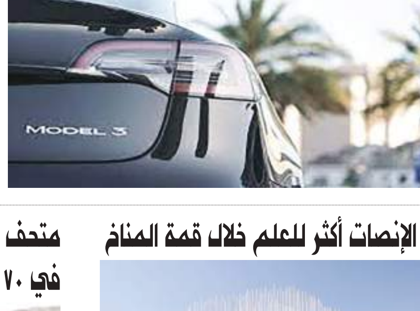
واشنطن (د ب أ) -

استدعت شركة السيارات الكهربائية الأمريكية/تسلا/ أكثر من ٣٢١ ألف سيارة في الولايات المتحدة لإصلاح مشاكل تتعلق بتشغيل الإضاءة الخلفية لبعض سياراتها. وهي إخطار للإدارة الوطنية للسلامة على الطرق السريعة، قالت تسلا إن عملية الاستدعاء تشمل بعض السيارات من طراز ٣ لعام ٢٠٢٣، وطراز واي للفترة بين عامي ٢٠٢٠-٢٠٢٣.