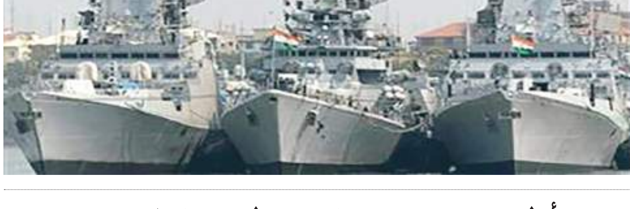
مسقط (د ب أ) -

نفذت مجموعة من سفن أسطول البحرية السلطانية العمانية في منطقة الباطنة البحرية ومنطقة الوسطى البحرية، وبمشاركة أطقم من سفن القوات البحرية في الهند، وبإستناد من عدد من طائرات سلاح الجو السلطاني العماني فعاليات التمرين البحري المشترك (نسيم البحر ٢٠٢٢). ووفق وكالة الأنباء العمانية الإثنان، تستمر فعاليات التمرين حتى ٢٤ من الشهر الجاري، ويشتمل على العديد من التطبيقات العسكرية البحرية بين السفن والأطقم المشاركة وفقاً للخطة المرسومة لفعاليات التمرين.