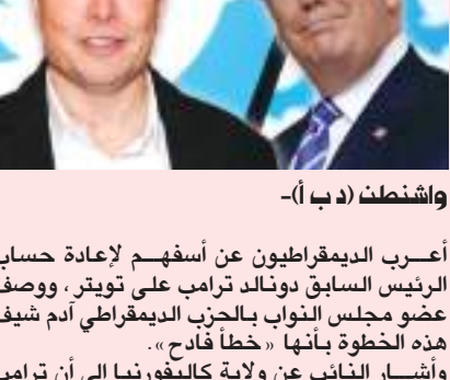
واشنطن (د ب أ) -

أعرب الديمقراطيون عن أسفهم لإعادة حساب الرئيس السابق دونالد ترامب على تويتر، ووصف عضو مجلس النواب بالجزء الديمقراطي آدم شيف هذه الخطوة بأنها «خطأ فادح».