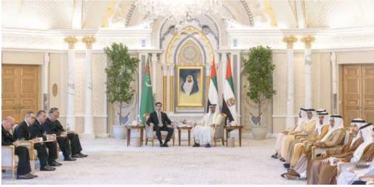
رئيس الدولة خلال استقباله رئيس تركمانستان بحضور سيف بن زايد ومنصور بن زايد

فقد كان في الاستقبال .. الفريق سمو الشيخ سيف بن زايد آل نهيان نائب رئيس مجلس الوزراء وزير الداخلية و سمو الشيخ منصور بن زايد آل نهيان نائب رئيس مجلس الوزراء وزير ديوان الرئاسة و سمو الشيخ حمدان بن محمد بن زايد آل نهيان ومعالى الشيخ محمد بن حمد بن طحون آل نهيان مستشار الشؤون الخاصة في ديوان الرئاسة ومعالى محمد بن هادي الحسيني وزير الدولة للشؤون المالية ومعالى ريم بنت إبراهيم الهاشمي وزيرة دولة لشؤون التعاون الدولي ومعالى سهيل بن محمد فرج فارس المزروعى وزير الطاقة والبنية التحتية ومعالى سارة بنت يوسف الأميري وزيرة دولة للتعليم العام والتكنولوجيا المتقدمة ومعالى مريم بنت محمد سعيد حارب المهيري وزيرة التغير المناخي والبيئة ومعالى الدكتور ثاني بن أحمد الزيودي وزير دولة للتجارة الخارجية ومعالى أحمد بن علي محمد الصايغ وزير دولة