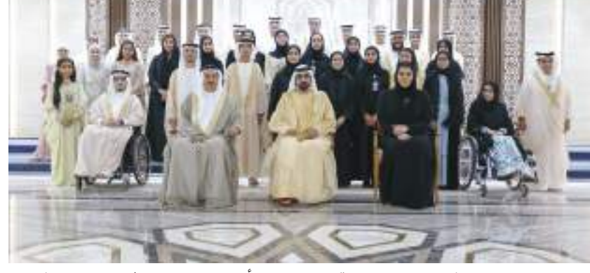
محمد بن راشد في صورة تذكارية خلال لقائه أعضاء البرلمان الإماراتي للطفل

التقى صاحب السمو الشيخ محمد بن راشد آل مكتوم نائب رئيس الدولة رئيس مجلس الوزراء حاكم دبي «رعاه الله» أعضاء البرلمان الإماراتي للطفل، على هامش افتتاح سموه لدور الانعقاد العادي الرابع من الفصل التشريعي السابع عشر للمجلس الوطني الاتحادي في مقر المجلس بأبوظبي. وحرص سموه على تجانب أطراف الحديث مع الأطفال المشاركين في الجلسة الثالثة للبرلمان الإماراتي للطفل، والمخصصة لمناقشة موضوع الصحة النفسية للأطفال، مشجعاً سموه إياهم على الاستفادة من هذه