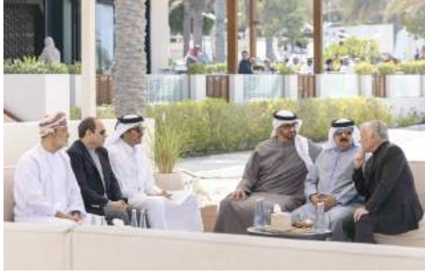
رئيس الدولة خلال لقائه مع إخوانه قادة دول مجلس التعاون والأردن ومصر في أبوظبي