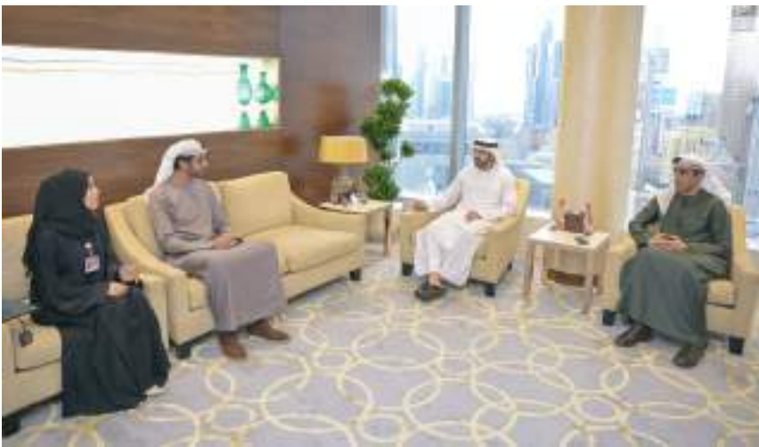
ولي عهد دبي خلال اعتماده نتائج دراسات سعادة متعاملي وموظفي حكومة دبي

وأطلع سمو الشيخ حمدان بن محمد بن راشد آل مكتوم، ولي عهد دبي رئيس المجلس التنفيذي على نتائج دراسة مؤشر سعادة موظفي حكومة دبي التي استعرضها برنامج دبي للتميز الحكومي. فقد حقق مؤشر سعادة الموظفين لحكومة دبي نسبة ٨٨٪، وحصلت مؤسسة محمد بن راشد للإسكان أعلى نسبة بلغت ٩٥،٠٪. جدير بالذكر أن برنامج دبي للتميز الحكومي ينظم دراسة لقياس مؤشر السعادة لمتعاملي حكومة دبي منذ عام ٢٠٠٤ وقد حقق المؤشر نمواً إيجابياً مطرداً مقارنة بأفضل الممارسات على الصعيد العالمي.. كما أن فريق البرنامج قام بتحديث الدراسة وإدخال عدد من التعديلات التطويرية على استبيان الدراسة وفق أفضل الممارسات في مجال جودة وتميز الخدمات وتحسين تجربة المتعاملين مع استمرار دمج نتائج مؤشر السعادة اللحظي للخدمات المقدمة من خلال المواقع الإلكترونية والتطبيقات الذكية، والتي يتولى قياسه هيئة دبي الرقمية، في نتائج دراسة المؤشر العام لسعادة متعاملي حكومة دبي التي يجريها البرنامج، الأمر الذي يعزز من قيمة المؤشر وإسهامه في تحسين جهود حكومة دبي في تحقيق سعادة المتعاملين عبر كل قنوات تقديم الخدمات.