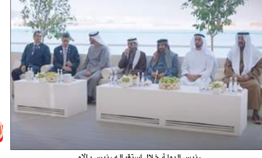
رئيس الدولة خلال استقباله رئيس بالاو

أبوظبي-وأم: استقبل صاحب السمو الشيخ محمد بن زايد آل نهيان رئيس الدولة «حفظه الله» يوم الأربعاء فخامة سورانجل ويبس جونبور رئيس جمهورية بالاو والصديقة الذي يزور البلاد حالياً الجانزور، أسبوع أبوظبي للاستدامة». ويبحث الجانبان خلال اللقاء الذي جرى في قصر البحر في أبوظبي: علاقات الصداقة والتعاون بين البلدين وفرص تطويرها خاصة في المجالات التنموية والاقتصادية والاستثمارية بما يحقق مصالحهما المتبادلة. حضر مجلس قصر البحر. سمو الشيخ طحون بن محمد آل نهيان ممثل الحاكم في منطقة العين وسمو الشيخ سيف بن محمد آل نهيان وسمو الشيخ هزاع بن زايد آل نهيان نائب