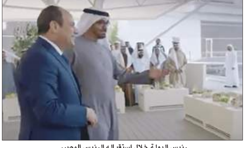
رئيس الدولة خلال استقباله الرئيس المصري

أبوظبي-وأم: استقبل صاحب السمو الشيخ محمد بن زايد آل نهيان رئيس الدولة «حفظه الله» يوم الأربعاء في مجلس قصر البحر أخاه فخامة عبدالفتاح السيسي رئيس جمهورية مصر العربية الشقيقة. بحضور صاحب السمو الشيخ حميد بن راشد النعيمي عضو المجلس الأعلى حاكم عجمان. وتبادل سموه مع أخيه الرئيس عبد الفتاح السيسي الأحاديث الأخوية الودية التي تعبر عن خصوصية العلاقات التي تجمع البلدين الشقيقين ومثانتها وما تستند عليه من أسس راسخة من المحبة والأخوة. حضر مجلس قصر البحر. سمو الشيخ طحون بن محمد آل نهيان ممثل الحاكم في منطقة العين وسمو الشيخ سيف بن محمد آل نهيان