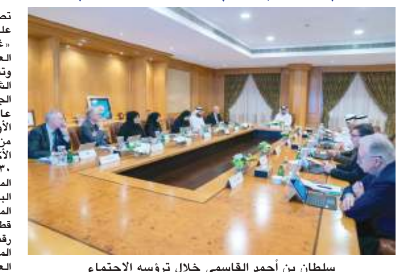
سلطان بن أحمد القاسمي خلال ترؤسه الاجتماع

الأداء المتميز للاعتماد الأكاديمي الوطني والدولي لبرامج الجامعة، وأعداد الطلبة المسجلين بالبرامج وجدوى البرامج المطروحة واستقطاب وتعيين أعضاء للهيئة الأكاديمية. وكان الدكتور حميد مجول النعيمي مدير جامعة الشارقة قد قدم تقريراً شاملاً، تناول فيه كافة ما يتعلق بأعمال الجامعة خلال الفترة الماضية، والإنجازات التي حققتها، إلى جانب المقترحات المستقبلية