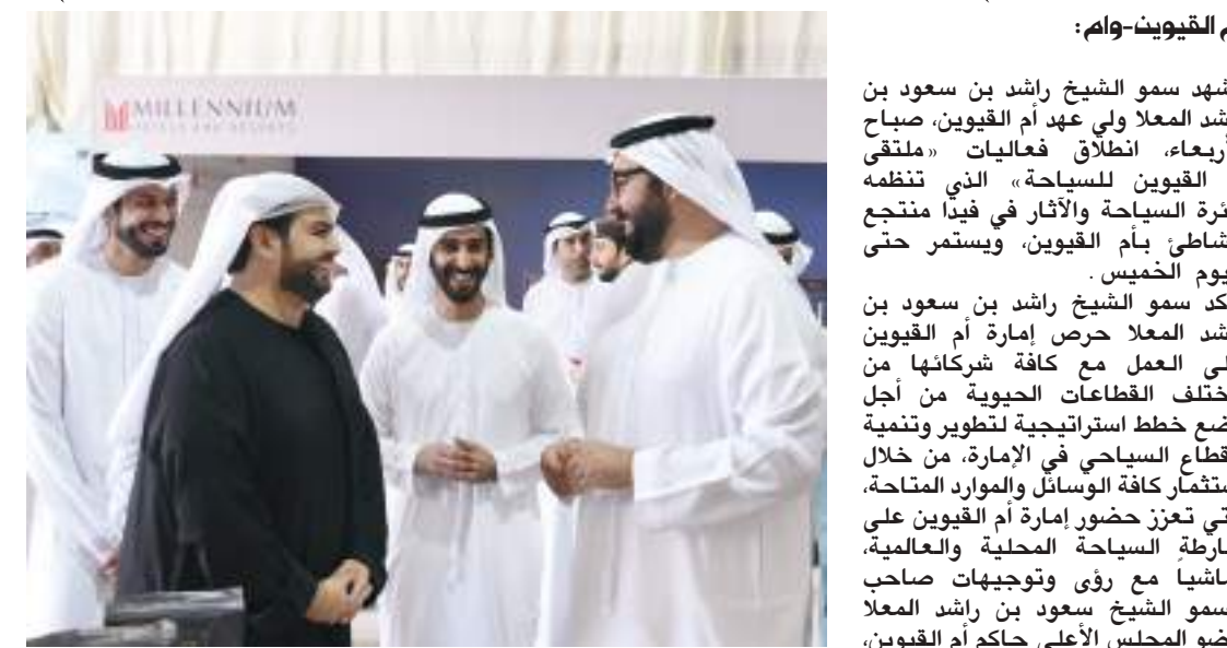
ولي عهد أم القيوين خلال حضوره انطلاق الفعاليات

شهد سمو الشيخ راشد بن سعود بن راشد المعلا ولي عهد أم القيوين، صباح الأربعاء، انطلاق فعاليات «ملتقى أم القيوين للسياحة» الذي تنظمه دائرة السياحة والآثار في فيدا منتجع الشاطئ بأم القيوين، ويستمر حتى اليوم الخميس. وأكد سمو الشيخ راشد بن سعود بن راشد المعلا حرص إمارة أم القيوين على العمل مع كافة شركائها من مختلف القطاعات الحيوية من أجل وضع خطط استراتيجية لتطوير وتنمية القطاع السياحي في الإمارة، من خلال استثمار كافة الوسائل والموارد المتاحة، التي تعزز حضور إمارة أم القيوين على خارطة السياحة المحلية والعالمية، تماشياً مع رؤى وتوجيهات صاحب السمو الشيخ سعود بن راشد المعلا عضو المجلس الأعلى حاكم أم القيوين، حيث أصبحت الإمارة تحظى بالمشاريع التنموية النوعية خاصة في ما يرتبط بقطاع السياحة البيئية. وقدم سمو ولي عهد أم القيوين بجولة في أروقة المعرض المصاحب للملتقى، وأطلع على أجنحة الجهات الحكومية والقطاع وشركات السياحة والسفر، كما تعرف سموه على أبرز ما تقدمه تلك الجهات من مشاريع ومبادرات سياحية ومدى انعكاسها على الإمارة واقتصادها وأشاد سمو الشيخ راشد بن سعود بن