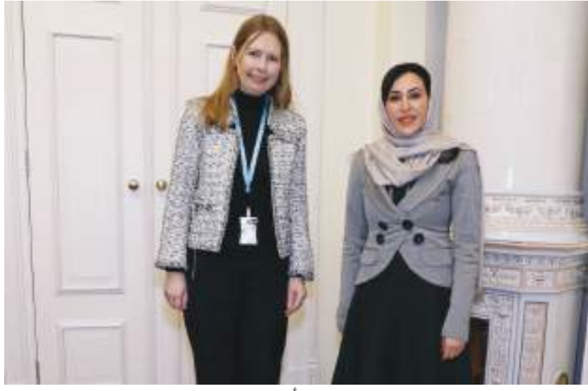
سفيرة الدولة خلال تقديم نسخة من أوراق اعتمادها للخارجية النرويجية