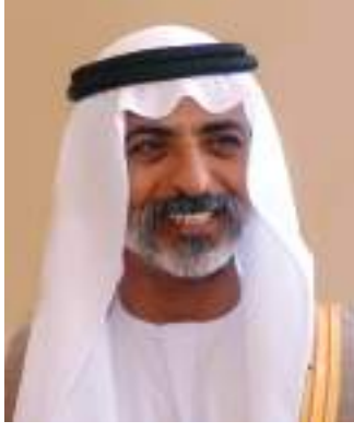
نهيان بن مبارك

وقال القرقاوي إن هناك عدداً من الجلسات النقاشية المتخصصة يديرها ويشارك بها عدد من الخبراء العالميين والإماراتيين من القطاعات الخاص والحكومي.. مؤكداً أن الجلسات تركز بشكل أساسي ريادة الأعمال وصناعة الفرص، إضافة إلى بحوث حول فرص العمل في القطاع الخاص. وأوضح أن اليوم المفتوح يضم مناظرات ومسابقات لتوظيف الشباب المشاركة مع اختيار المشاريع والأفكار المتميزة التي يقدمها الحضور من أبناء وبنات الإمارات، لدراسة تمويلها من قبل الصندوق وشركائه، ودورة تدريبية « العمل الرقمي الحر» إضافة إلى معرض الشركاء وقصص النجاح، وخلق وظائف جديدة عبر الأعمال الناشئة وريادة الأعمال وعبر القرقاوي عن اعتزازه بالمشاركة الواسعة والجهود المخلصة التي قدمها شركاء صندوق الوطن خلال فترة الإعداد لهذا اليوم المفتوح، متمنياً دورهم الوطني المخلص في رعاية ودعم أبناء وبنات الوطن، وتعزيز قدراتهم من أجل مستقبل أكثر إشراقاً لهم ولمجتمعاتهم.. مؤكداً أن الدعوة عامة لجميع فئات المجتمع لاسيما الشباب وطالب الجامعات للحضور لأرض المعارض بأبوظبي والمشاركة في أنشطة اليوم المفتوح والتعرف على ما يقدمه من رؤى وأفكار ومبادرات.