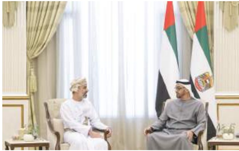
محمد بن زايد خلال استقباله رئيس مجلس الشورى العماني