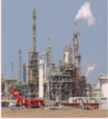
سنغافورة - (وكالات):

قالت مصادر بقطاع النفط الكويتي يوم الخميس إن الكويت طرحت عطاء على ثلاث شحنات من زيت الوقود منخفض الكبريت للتحميل بين فبراير شباط وأبريل نيسان من مصفاة الزور. وهذا هو سادس عطاء على زيت الوقود منخفض الكبريت من المصفاة الجديدة منذ أن بدأت التصدير في نوفمبر تشرين الثاني الماضي. وتعرض المصفاة ثلاث شحنات تزن الواحدة منها ١٠٠ ألف طن من زيت الوقود منخفض الكبريت الذي به نسبة كبريت تبلغ ٠,٥ في المئة في عطاء يُغلق اليوم الخميس. وومي المقرر أن يتم تحميل الشحنة الأولى بين يومي الأول والثاني من فبراير شباط، بينما من المقرر أن يتم تحديد مواعيد تحميل الشحنات الثانية والثالثة في مارس آذار وأبريل نيسان. وقالت مصادر إن المصفاة ألغت في وقت سابق عطاء لبيع شحنة وقود للطائرات يتم تحميلها منتصف فبراير شباط دون إبداء أسباب.