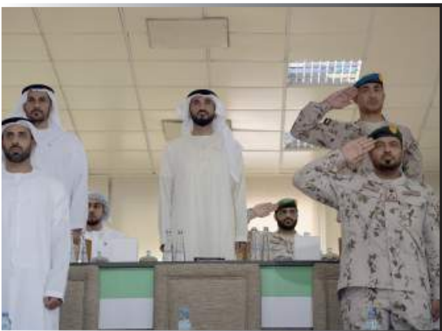
«القوات البحرية» في قوية بين المشاركين، الذين أشاد بها الحضور في اليوم المركز الثالث، بعد منافسة قدموا مستويات مميزة، الختامي.

شهد سمو الشيخ نهيان بن زايد آل نهيان رئيس مجلس أمناء مؤسسة زايد بن سلطان آل نهيان للأعمال الخيرية والإنسانية رئيس مجلس أبوظبي الرياضي، الحفل الذي نظّمته وزارة الدفاع في ختام منافسات بطولة «محمد بن زايد آل نهيان السادسة للجوجيتسو 2023» إلى جانب المنافسات الختامية التي أقيمت في أجواء مميزة. أقيم الحفل بحضور سعادة مطر سالم الظاهري، وكيل وزارة الدفاع وعدد من كبار الضباط، وجاء فريق «القوات البرية» في المركز الأول، ليتوج بدرع التفوق، وفريق «حرس الرئاسة» في المركز الثاني، وفريق