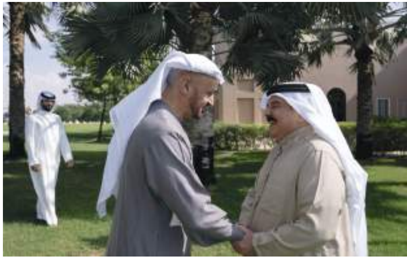
ملك البحرين خلال استقباله رئيس الدولة في مقر إقامته