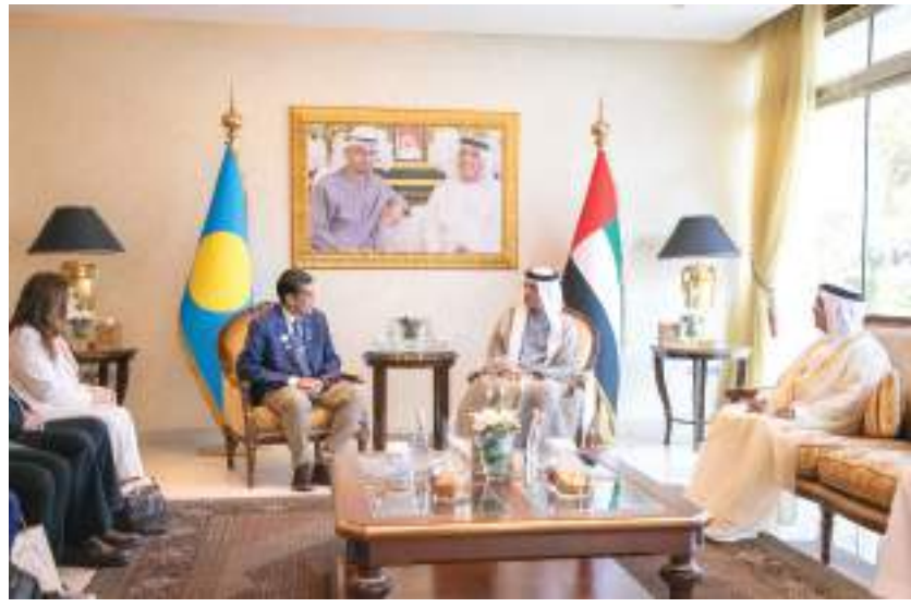
حاكم رأس الخيمة خلال استقباله رئيس جمهورية بالاو