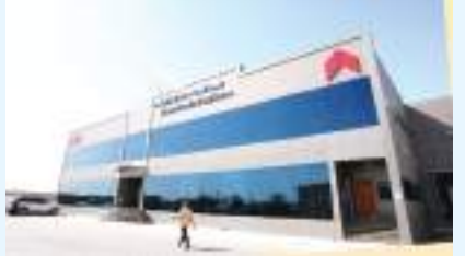
دبجيا - (الوقدة) :