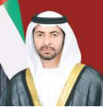
حمدان بن زايد

تنظم جمعية الصحفيين الإماراتية خلال الفترة من ٢٠ وحتى ٢٦ مارس الجاري رحلة لآداء مناسك العمرة لعدد من أعضائها بمكرمة من سمو الشيخ حمدان بن زايد آل نهيان ممثل الحاكم في منطقة الظفرة .