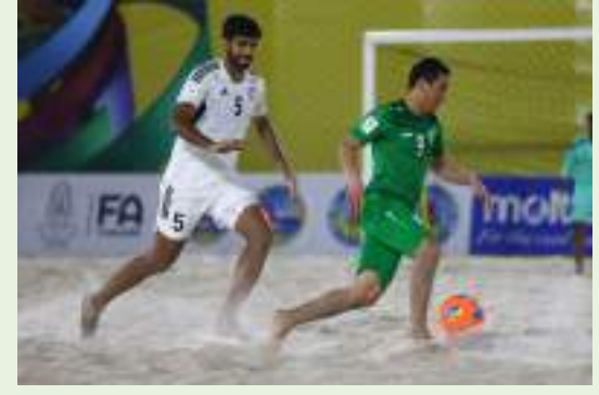
بتايا - وام:

حقق منتخب الإمارات لكرة القدم الشاطئية فوزه الأول في مستهل مشواره ببطولة كأس آسيا 2023، وتغلب على منتخب أوزبكستان بأربعة أهداف دون رد، في المباراة التي جمعت بينهما اليوم الخميس، ضمن مباريات الجولة الأولى لحساب المجموعة الثانية في البطولة التي تستضيفها مدينة بتايا التايلاندية.