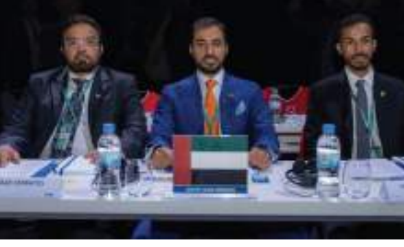
كيجالجا - وام:

شارك الشيخ راشد بن حميد النعيمي رئيس اتحاد الإمارات لكرة القدم على رأس وفد في اجتماع الجمعية العمومية للاتحاد الدولي لكرة القدم "كونجرس الفيفا الـ 73" الذي عقد أمس الجمعة في العاصمة الرواندية كيجالجا.