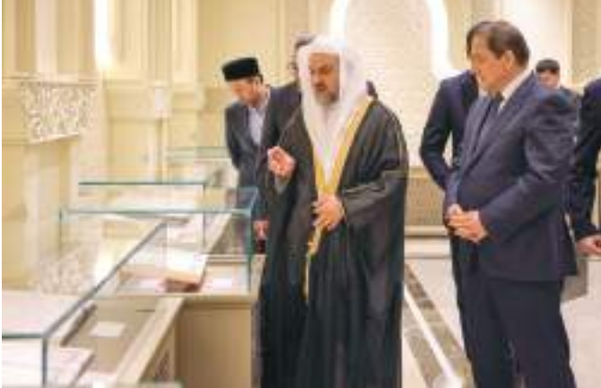
خلال زيارة الوفد الأوزبكي إلى مجمع القرآن الكريم في الشارقة

ودوران رستم مقصدوف النائب الأول لوزير الشؤون الدينية وجمال الدين حيدر همراقوف نائب المفتي العام لأوزبكستان وعزمت باباقل تاشوف نائب رئيس لجنة العلاقات الدولية ولجنة العلاقات الودية مع الدول الأجنبية ومحمد عالم محمد صديق مدير جامعة طشقند الإسلامية ومظفر