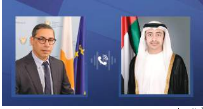
أبو ظبي- وام:

تمنياته لمعالیه التوفيق والسداد في مهام عمله الجديد، مشيداً بالعلاقات الاستراتيجية المتميزة بين البلدين.