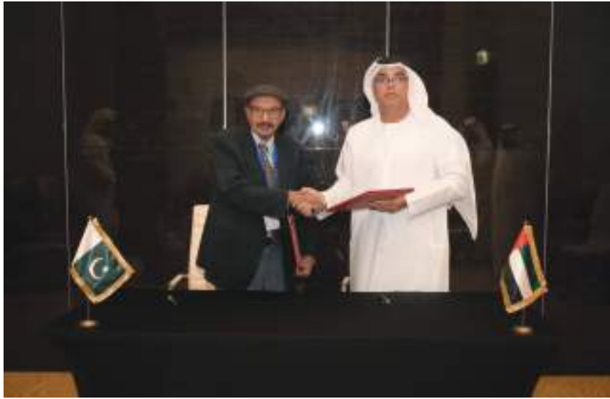
خلال التوقيع على مذكرة التفاهم

كما سيعمل الطرفان على تعزيز التعاون لدعم مركز الإنذار المبكر بالتسونامي في صورة برمجيات نمذجة مصممة خصيصاً لدعم عمليات التنبؤ بالتسونامي والتعاون في مجال الهيدرولوجيا وتوقع حدوث الفيضانات بما في ذلك تبادل بيانات الرادارات، وتبادل البيانات الزلزالية بشكل آني لعدد من محطات رصد الزلازل الواقعة في جنوب باكستان وشمال دولة الإمارات العربية المتحدة لرصد الزلازل في بحر العرب وبحر عمان والتي قد ينتج عنها تولد موجات تسونامي، والتعاون في مجال الزلازل والذي يتمثل في دراسة الأنشطة الزلزالية التي لديها القدرة على توليد موجات تسونامي في بحر العرب وبحر عمان، والتعاون في مجال البحوث العلمي والتي يتمثل في تبادل البيانات والدراسات والأبحاث العلمية ذات العلاقة بموضوع هذه المذكرة.