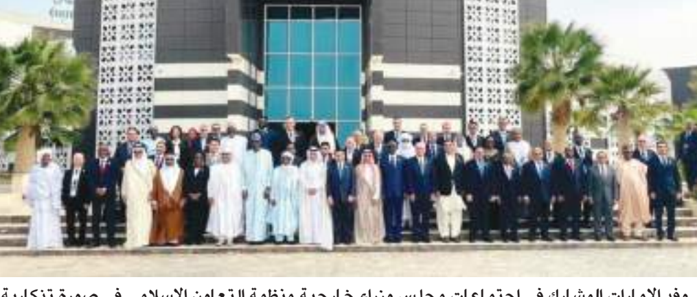
وفد الإمارات المشارك في اجتماعات مجلس وزراء خارجية منظمة التعاون الإسلامي في صورة تذكارية

المتحدة الإطارية بشأن تغير المناخ COP٢٧ الذي استضافته جمهورية مصر العربية في نوفمبر الماضي، مشيراً إلى أن دولة الإمارات تنطلق إلى أن يكون مؤتمر الأطراف القادم COP٢٨ الذي تستضيفه الدولة في مدينة إكسبو دبي في نوفمبر ٢٠٢٣، جامعاً لكافة الجهات المعنية، من حكومات وقطاع خاص وشباب ومنظمات المجتمع المدني لتحقيق الأهداف الدولية والعمل المناخي وتحول الطاقة. وقدم معاليه الدعوة إلى جميع الدول الأعضاء المشاركة في COP٢٨ بما يخدم مستقبل استقرار وازدهار جميع الدول والتغلب على التحديات المناخية والبيئية القائمة. وشارك في الاجتماع سعادة الشيخ نهيان بن سيف آل نهيان سفير الإمارات العربية المتحدة لدى المملكة العربية السعودية الشقيقة ومنذوب الدولة لدى منظمة التعاون الإسلامي، وسعادة يعقوب المحسن مساعد الوزير لشؤون المنظمات الدولية في وزارة الخارجية والتعاون الدولي، وسعادة غانم المهيري سفير دولة الإمارات لدى الجمهورية الإسلامية الموريتانية.