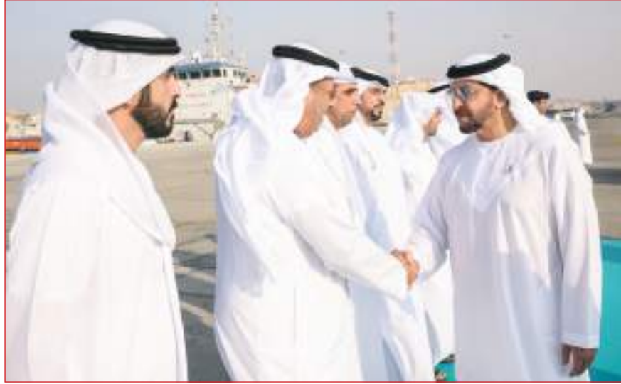
حمدان بن زايد خلال تدشين ميناء مغرق بمدينة الظنة

خلال العام الماضي من تحقيق مكانة متميزة بين الموانئ العالمية من خلال المدونة الدولية (ISPS CODE) لأمن السفن ومرافق الموانئ (ISPS CODE) الصادرة عن وزارة الطاقة والبنية التحتية ومنذ ذلك الوقت طور ميناء مغرق علاقات مع شركات النفط والغاز العالمية مما ساهم في جعله وجهة للنقلات الأساسية للبضائع والنفط والبتروكيماويات حيث تم استلام أول شحنة دولية في مغرق في أغسطس ٢٠٢٢. وخلال التدشين تعرف سموه على أبرز مشاريع موانئ منطقة الظفرة ومن ضمنها تطوير موانئ السلع والمرافق والظنة والعمليات البحرية الجديدة في جزيرة الفياح حيث تشكلت هذه المشاريع جزءاً من الخطة التطوير الرئيسية التي تنفذها مجموعة موانئ أبوظبي في منطقة الظفرة وتحت إشراف سموه. وأثنى سمو الشيخ حمدان بن زايد آل نهيان على جهود مجموعة موانئ أبوظبي في تطوير بنية تحتية اقتصادية وتجارية عالمية المستوى لترسيخ مكانة إمارة أبوظبي المتميزة مؤكداً سموه دعم القيادة الرشيدة للمشاريع التنموية في منطقة الظفرة لما تشكله من أهمية استراتيجية لدولة الإمارات. وقال سموه « من شأن مشاريع كهذه أن تسهم ليس فقط في تطوير منطقة الظفرة وموانئها البحرية والمجمعة بل تنعكس أيضاً على المنطقة بأكملها حيث تنعش القطاعات الاقتصادية والتجارية وتسهم في جذب استثمارات إليها ..»