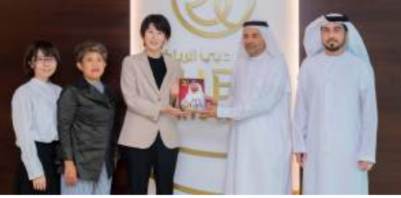
دبي / وام /

أعلنت أسطورة السباحة والبطلة الأولمبية اليابانية ري كانييتو إقامتها معسكراً تدريبياً للسباحين اليابانيين بمشاركة سباحين من الإمارات في مجمع حمدان الرياضي بدبي خلال الفترة المقبلة.