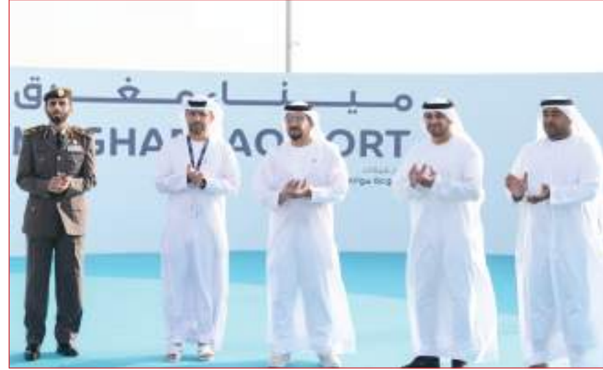
حمدان بن زايد خلال تدشين ميناء مغرق بمدينة الظنة