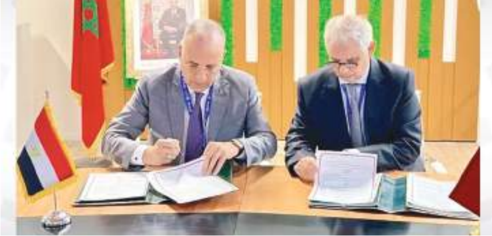
ديجا: (وكالات) :

وقعت المملكة المغربية وجمهورية مصر مذكرة تفاهم في مجال التسيير المستدام للموارد المائية، وذلك في إطار فعاليات مؤتمر المناخ ببدي (كوب٢٨). وتشمل مجالات التعاون، بحسب وكالة المغرب العربي للأنباء، محور تنمية واستخدام التقنيات الحديثة لإعادة استغلال مياه الأمطار والفيضانات، وتصميم وإنشاء وتسيير السدود والمنشآت المائية، وتنمية واستخدام التقنيات الحديثة لمعالجة مياه الصرف الفلاحي، والتكيف مع تأثير التغيرات المناخية على