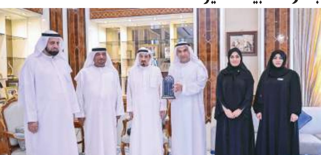
حاكم عجمان خلال استقباله وفد «بيت الخير»

ويكون لموج في الخليج العربي خفيفاً إلى متوسط، ويحدث المد الأول عند الساعة ١٢:٢٣ والمدم الثاني عند الساعة ٢:٤٥، والجزر الأول عند الساعة ٢:٠١ والجزر الثاني عند الساعة ٦:٤٠. وفي بحر عمان يكون الموم خفيفاً ويحدث المد الأول عند الساعة ٠٨:٤٧، والمد الثاني عند الساعة ٢٢:٤٩ والجزر الأول عند الساعة ١٥:٣٨ والجزر الثاني عند الساعة ٤:٣٤.