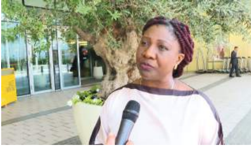
ديجا