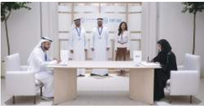
ذياب بن محمد بن زايد خلال حضوره توقيع الاتفاقية