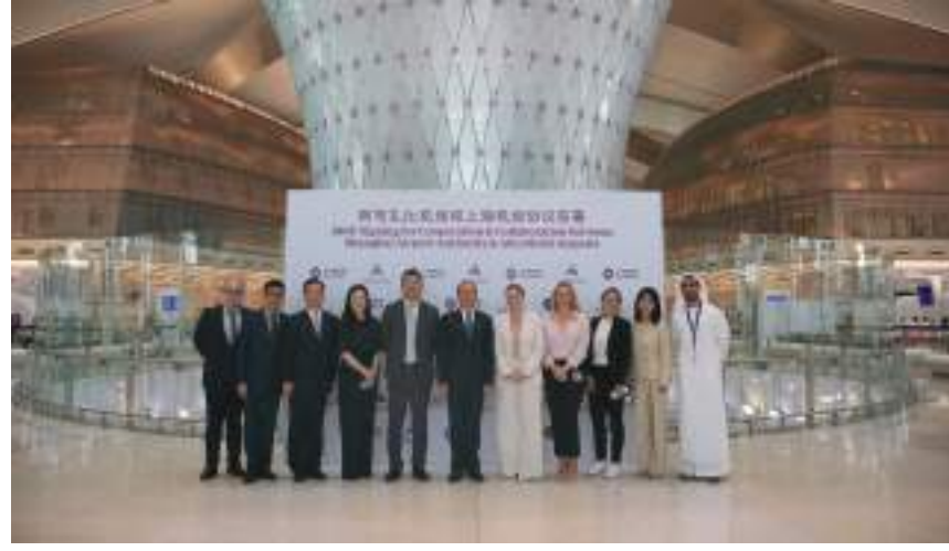
أبوظبي: (وام) :

السياحة ضمن مختلف الجهات الرئيسية في مدينتي أبوظبي وشنغهاي. لهيئة مطار شنغهاي AVINEX.. « يسعدنا اليوم أن نتعاون مع «مطارات أبوظبي» لشبكة خطوط المطارين وتكسيب المسافرين عجلة النمو مع في تعزيز أوجه التآزر بين من الوصول إلى وجهاتهم المنشودة والارتقاء بالعمليات التشغيلية بفعالية، فضلا عن دفع عمليات النمو في حركة المسافرين والرحلات الدولية بطاقتها الكاملة. ويسرنا كذلك انطلاق عمليات مبنى المسافرين A الجديد في مطار أبوظبي الدولي، في خطوة تعزز أسس التعاون في ما بيننا. وإننا نأمل أن تتوجه المزيد من شركات الطيران الصينية إلى الإمارات مع شركة «الاتحاد للطيران» من خلال هذا المبنى الجديد، حيث نحرض على مواصلة العمل مع شركات الطيران لتحقيق أهدافنا المشتركة. ونتطلع إلى إيجاد منظومة مشتركة للتعاون على صعيد العمليات المركزية، بما يسهم في ازدهار قطاع الطيران والاحتفاء بثمرة تعاوننا معا». تجدر الإشارة إلى أن هذه الاتفاقية تهدف إلى تعزيز التعاون المستمر بين الطرفين والوقوف على أوجه التآزر والعمل المشترك، للإسهام في إيجاد منظومة نقل جوي مشتركة وفعالة تتيح تبادل أفضل الممارسات وتبنيها بكفاءة