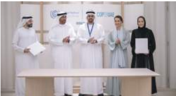
ذياب بن محمد بن زايد خلال حضوره توقيع الاتفاقية

ويتضمن البرنامج مبادرة أولى تهدف إلى تعليم وتمكين فئات متنوعة بما فيها طلاب المدارس والجامعات وموظفي الحكومة والقطاع الخاص وشرائح المجتمع كافة حول الكربون، بما يساعدهم على فهم وقياس كيفية تخفيض البصمة الكربونية وسنسخى هذه الشراكة إلى الوصول خلال عام ٢٠٢٤ إلى ١٠٠ مدرسة في دولة الإمارات.