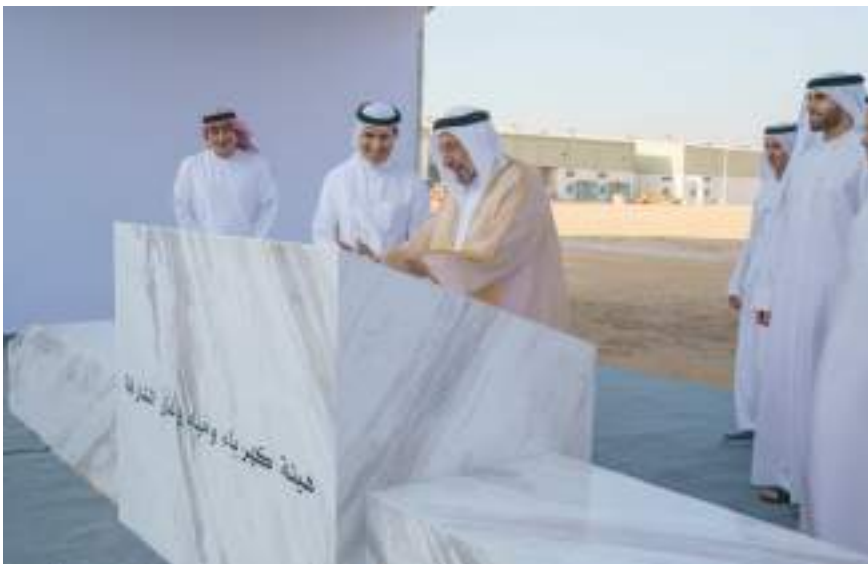
حاكم الشارقة خلال وضع حجر أساس المشروع

أكد صاحب السمو الشيخ الدكتور سلطان بن محمد القاسمي عضو المجلس الأعلى حاكم الشارقة، أن المشاريع الحيوية والمرتبطة باحتياجات الناس اليومية مثل الكهرباء والمياه والغاز، مستمرة ومتواصلة في كافة مدن الإمارة لتحقيق الاكتفاء الذاتي والتخزين المستقبلي، مشيراً إلى أهمية المحافظة على المياه وعدم الإسراف في استخدامها.