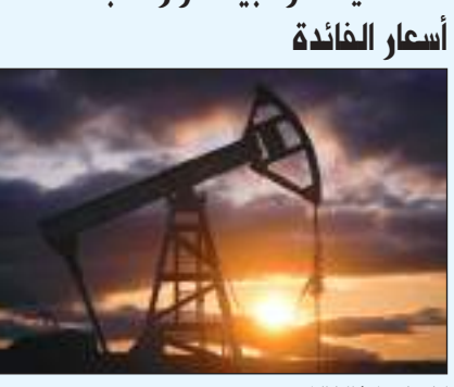
لندن: (وكالات) :

استقرت أسعار النفط يوم الثلاثاء قبيل الإعلان عن قرارات مهمة بشأن سياسات أسعار الفائدة وبيانات التضخم. وبحلول الساعة ١٠:٠٣ بتوقيت جرينتش، استقرت العقود الآجلة لخام برنت تسليم فبراير شباط عند ٧٦,٠٣ دولار للبرميل، في حين ارتفعت العقود الآجلة لخام غرب تكساس الوسيط الأمريكي تسليم يناير ثلاثة سنتات إلى ٧١,٣٥ دولار للبرميل. وجرت تسوية كلا العقدين على ارتفاع طفيف يوم الاثنين، إذ ارتفع خام برنت ١٩ سنتا إلى ٧٦,٠٣ دولارا للبرميل وارتفع خام غرب تكساس الوسيط تسعة سنتات إلى ٧١,٣٢ دولارا.