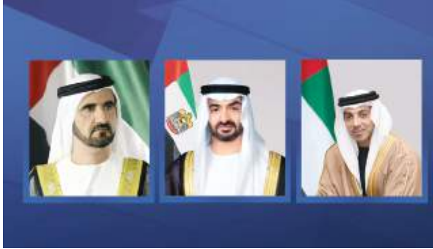
أبوظبي-وام: الكبير آل سعود.

بعث صاحب السمو الشيخ محمد بن زايد آل نهيان رئيس الدولة «حفظه الله»، برقية تعزية إلى أخيه خادم الحرمين الشريفين الملك سلمان بن عبدالعزيز آل سعود ملك المملكة العربية السعودية الشقيقة، عبر فيها عن خالص تعازيه وصادق مواساته في وفاة صاحب السمو الأمير بندر بن محمد بن سعود الكبير آل سعود. كما بعث صاحب السمو الشيخ محمد بن راشد آل مكتوم نائب رئيس الدولة رئيس مجلس الوزراء حاكم دبي «رعاه الله»، وسمو الشيخ منصور بن زايد آل نهيان نائب رئيس الدولة نائب رئيس مجلس الوزراء، رئيس ديوان الرئاسة، برقيتي تعزية مماثلتين إلى خادم الحرمين الشريفين.