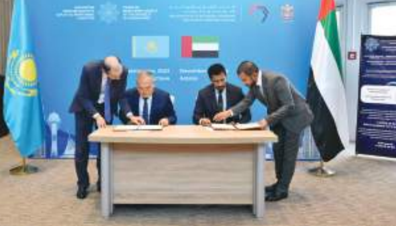
خلال التوقيع على الاتفاقية

الإرهاب، إن توقيع مذكرة التفاهم يضيء الطابع الرسمي على التزام الدولتين بحماية نزاهة النظام المالي العالمي، مشيراً إلى أن المشاركة الاستراتيجية الفعالة والتعاون مع الأطراف الدولية النظيرة أمر ضروري في مكافحة الجرائم المالية وهو جزء أساسي من استراتيجية دولة الإمارات.