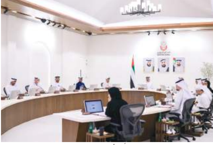
حمدان بن محمد خلال حضوره جانبياً من أعمال اليوم الختامي للدورة الثانية من المنتدى

الهوية الوطنية، والثقافة التراثية الإماراتية الأصيلة التي تتوارثها الأجيال، ما يضمن غرس القيم والعادات وتقاليد السنع الإماراتي في نفوس جيل المستقبل لمواصلة