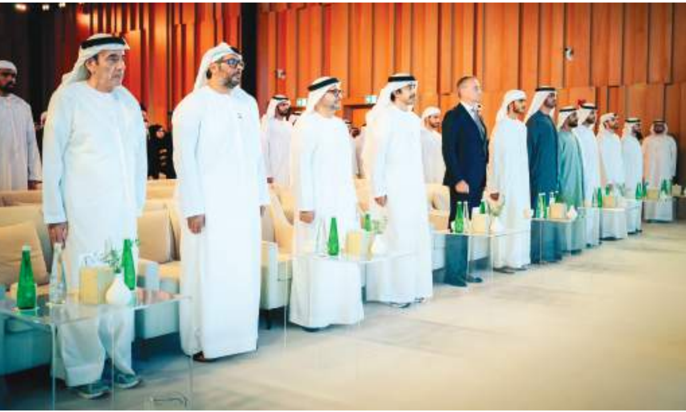
عبدالله بن زايد في صورة تذكارية خلال حضوره حفل التخرج

توقع المركز الوطني للأرصاد أن يكون الطقس اليوم السبت غائماً جزئياً ومغبراً أحياناً نهراً، وتظهر السحب المنخفضة على بعض المناطق الساحلية والغربية نهراً يصبح رطباً على بعض المناطق الداخلية الغربية ليلاً وصباح غد الأحد، والرياح خفيفة إلى معتدلة السرعة تنشط أحياناً حركة الرياح شمالية غربية - شمالية شرقية / إلى ٢٥ تصل إلى ٣٥ كم/س. الموج في الخليج العربي متوسط إلى خفيف.. ويحدث المد الأول عند الساعة ١٤:١٩ والمد الثاني عند الساعة ٠٥:٠٠ والجزر الأول عند الساعة ٠٨:٠٣ والجزر الثاني عند الساعة ٢١:٥٧.