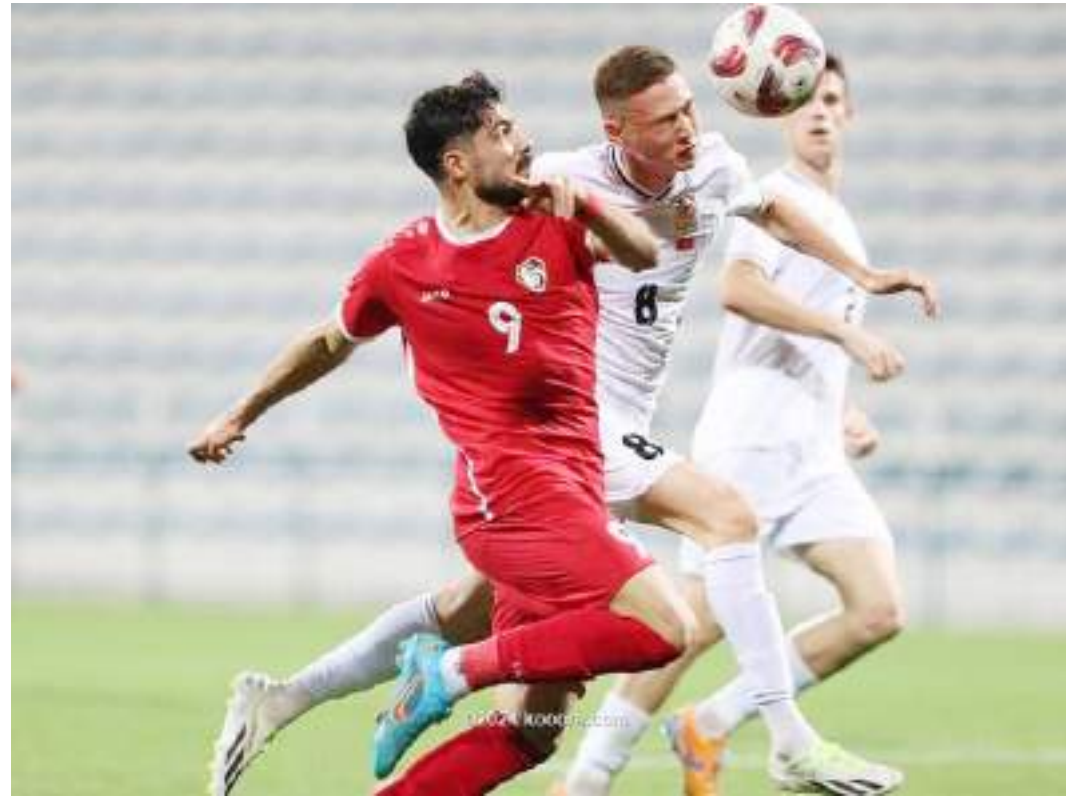
الدوحة (د ب أ) -

يستضيف ملعب «أحمد بن علي» بالريان، مواجهة بين منتخبي الهند وأوزبكستان، اليوم الخميس، ضمن منافسات الجولة الثانية بالمجموعة الثانية بكأس أمم آسيا لكرة القدم. وكان المنتخب الأوزبكي، قد تعادل سلبيا مع نظيره السوري في المواجهة الأولى له في مشواره بالبطولة، فيما خسر المنتخب الهندي بثنائيسة نظيفة أمام منتخب أستراليا أحد المنتخبات المرشحة بقوة لنيل لقب البطولة.