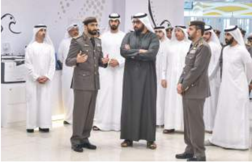
ولي عهد أم القيوين خلال الزيارة