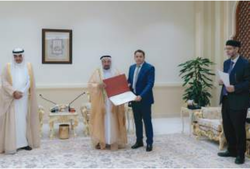
حاكم الشارقة خلال تكريم الفائزين

اتسع نطاق اهتمامها في جميع البلاد العربية والإسلامية، مشيراً إلى أنها غدت تشجع الباحثين واللغويين على بذل المزيد من الجهود البحثية، وترقية الفكر اللغوي العربي، مهنتا الفائزين بالجائزة التي استحوها عن جدارة واستحقاق.