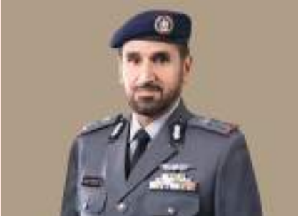
اللواء ركن طيار فارس خلف المزروعى

قائد عام شرطة أبوظبي نجا يوم الشرطة العربية: منظومتنا متكاملة لتعزيز الأمن والأمان