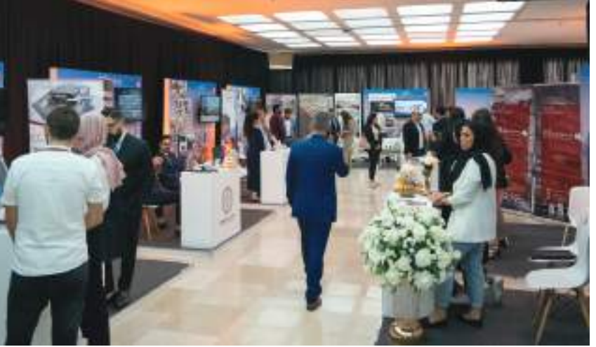
خلال فعاليات المعرض