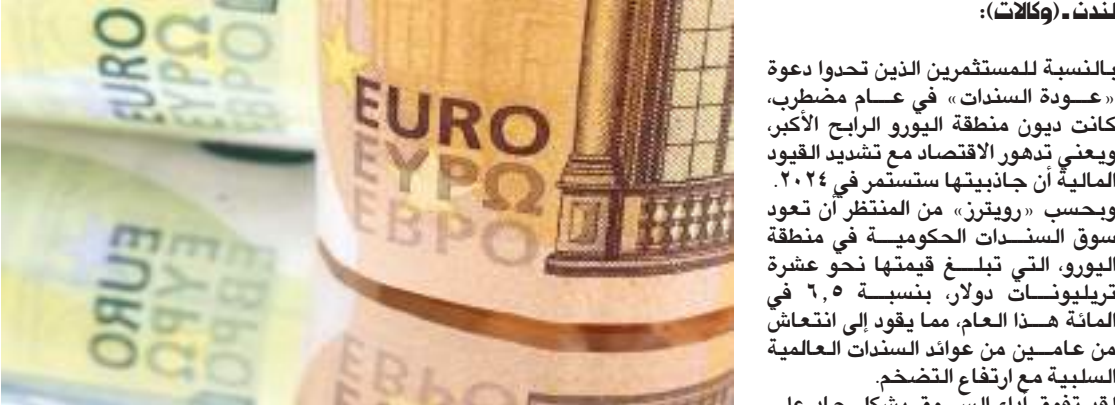
لندن - (وكالات):

بالنسبة للمستثمرين الذين تحددوا دعوة «عودة السندات» في عام مضطرب، كانت ديون منطقة اليورو الخيار الأكبر، ويعني تدهور الاقتصاد مع تشديد القيود المالية أن جاذبيتها ستستمر في ٢٠٢٤. وبحسب «رويتزر»، من المتوقع أن تعود سوق السندات الحكومية في منطقة اليورو، التي تبلغ قيمتها نحو عشرة تريليونات دولار، بنسبة ٦,٥ في المائة هذا العام، مما يقود إلى انتعاش من عامين من عوائد السندات العالمية السلبية مع ارتفاع التضخم. لقد تفوق أداء السوق بشكل حاد على سندات الخزينة الأمريكية، بزيادة ٣,٥ في المائة هذا العام، وسندات المملكة المتحدة، بزيادة ٢,٤ في المائة. وعادت السندات الإيطالية، التي كانت في بؤرة المخاوف بشأن تأثير الزيادات القياسية في أسعار الفائدة، بنحو ٩ في المائة، وبالنسبة لبعضهم، هذه مجرد البداية.