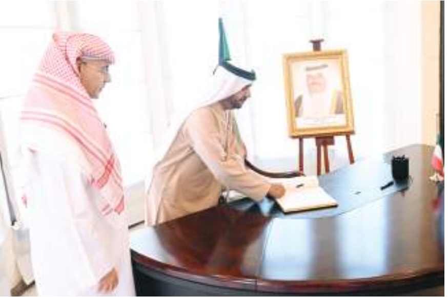
خلال تقديم واجب العزاء في وفاة الشيخ نواف الأحمد

الدولة، عن صادق تعازيهم ومواساتهم لأشقائهم في دولة الكويت، مشيدين بدور الفقيد الراحل في تعزيز أواصر الأخوة وتنمية العلاقات بين البلدين الشقيقين؛ كما دونوا عبارات التعزية والمواساة في سجل التعازي بمقر السفارة الكويتية سائلين الله العلي القدير أن يتغمّد الشيخ نواف الأحمد الجابر الصباح بالرحمة والمغفرة، وأن ينعم على دولة الكويت الشقيقة بدوام الأمن والرخاء.