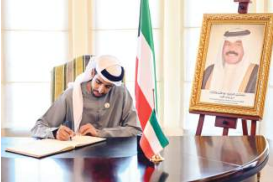
سرور بن محمد وعدد من الوزراء وكبار المسؤولين

وأعرب سمو الشيخ سرور بن محمد آل نهيان، وأصحاب المعالي الوزراء وكبار المسؤولين في