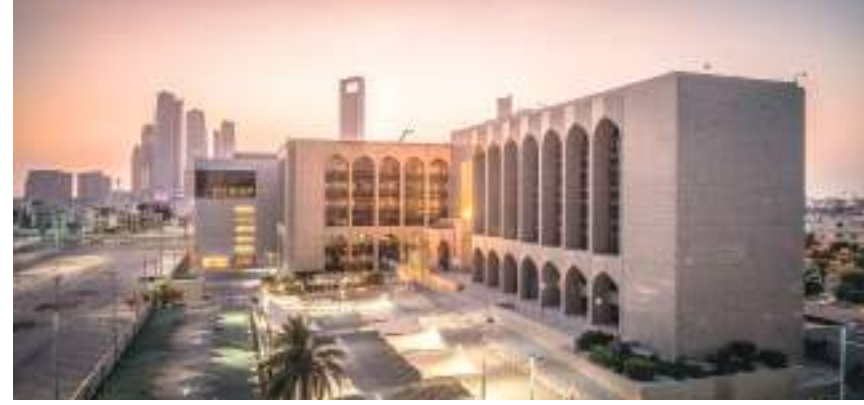
أبو ظبي - (وام):

ارتفعت الميزانية العمومية لمصرف الإمارات المركزي على أساس سنوي بنحو ٣,٣٪ في نهاية أكتوبر الماضي، وفق أحدث إحصائيات المصرف المركزي. وأوضح المصرف المركزي، في تقرير الميزانية العمومية لشهر أكتوبر ٢٠٢٣، أن ميزانيته العمومية ارتفعت إلى ٦,٦٤٧ مليار درهم بنهاية أكتوبر الماضي مقابل نحو ٤,٨٦,١٧ مليار درهم في أكتوبر ٢٠٢٢. بزيادة تعادل ١,٦١,٥ مليار درهم خلال ١٢ شهراً. وزادت الميزانية العمومية للمصرف المركزي خلال الفترة أشهر الأولى من العام الجاري بنسبة ١٧,٢٪، أو ما يعادل ٩٥,١ مليار درهم مقارنة بنحو ٥٥,٢ مليار درهم في نهاية ديسمبر من العام ٢٠٢٢. وارتفعت الميزانية العمومية للمصرف المركزي