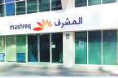
دبي - (الوحدة):

أقرت عمومية بنك المشرق تأسيس برنامج صكوك متوافق مع الشريعة الإسلامية بقيمة ٢,٥ مليار دولار. وبحسب إفصاح لسوق دبي المالي، قال البنك إن البرنامج ينص على إصدار أدوات متوافقة مع الشريعة عبر النافذة الإسلامية للبنك تحت برنامج الصكوك من حين لآخر، ويجوز قيد أو السماح بتداول الأدوات في سوق المال أو أي منصة تداول أو من دون القيد وبشروط وأحكام الإصدار التي يقرها مجلس الإدارة.