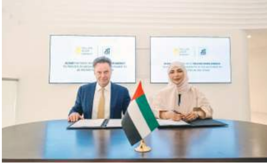
خلال التوقيع على عقد الشراكة

وبالاعتماد على حلول الطاقة الشمسية الكهروضوئية الموجودة على أسطح المباني والمرائب والمساحات الأرضية، سيتم توليد ٣٤ ميجاوات من الطاقة النظيفة، ما سيسهم في