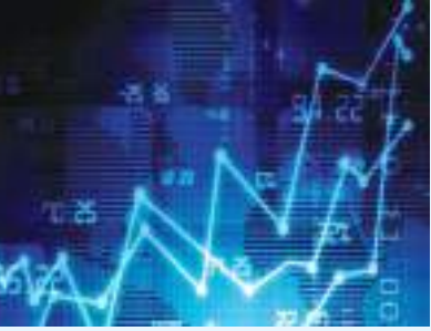
ديجا - (وام):

شهد سوق أبو ظبي للأوراق المالية، يوم الثلاثاء، تنفيذ صفقتين كبيرتين مباشرتين على سهم «ألفا فليجا» بحسب بيانات السوق، تم تنفيذ الصفقة على عدد ١٣٩,١ مليون سهم بقيمة ٣,٥٩٧ مليار درهم بسعر تنفيذ ٢٥,٨٦ درهم للسهم الواحد. والصفقات الكبيرة المباشرة هي صفقات يتم تنفيذها خارج سجل الأوامر ولا تؤثر على سعر إغلاق سهم الشركة المعنية ولا على مؤشر الأسعار، كما أنها لا تؤثر على أعلى وأدنى سعر تم تنفيذه خلال الجلسة وخلال آخر ٥٢ أسبوعاً.