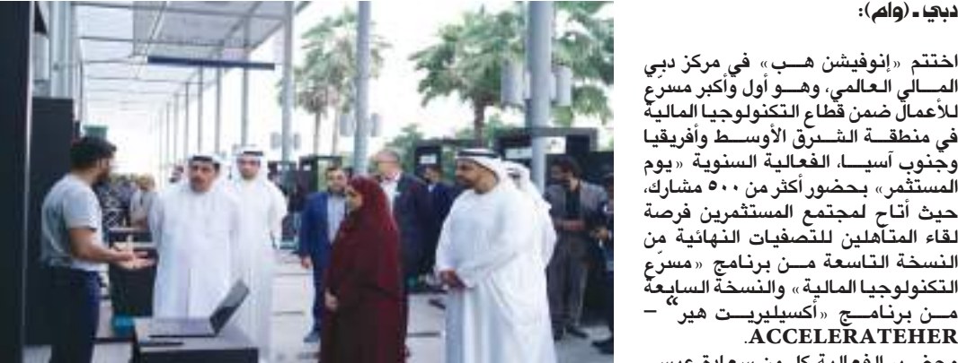
ديجا - (وام):