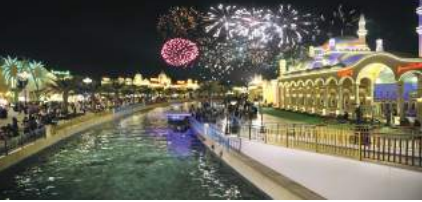
ديجا - (الوحدة):

أعلنت القرية العالمية، أحد أهم المنتزهات الثقافية في العالم والوجهة العائلية الأولى للثقافة والترفيه والتسوق في المنطقة، احتفالاتها المتميزة بحلول العام الجديد مع ضيوفها هذا العام، حيث تدعو العائلات والضيوف للانضمام إليها ومشاركتها احتفالات رأس السنة الجديدة سبع مرات، والتي ستكون مترامنة مع احتفالات سبع دول من أنحاء العالم بدخول العام الجديد. وستطلق احتفالات القرية العالمية من المسرح الرئيس بإطلاق عروض الألعاب النارية المذهلة التي ستضيء أفق الوجهة، بداية بالعد التنازلي لدخول العام الجديد في الصين في تمام الساعة ٨ مساءً، ومن تاييلند في تمام الساعة ٩ مساءً، وبنغلاديش في تمام الساعة ١٠ مساءً، والهند في تمام الساعة ١٠:٣٠ مساءً، وباكستان في تمام الساعة ١١ مساءً، فيما ستجري أضخم الاحتفالات حينما تشير الساعة إلى منتصف الليل في الإمارات، وأخيراً مع تركيا في الساعة ١١ من منتصف الليل. وإلى جانب الفعاليات والعروض الترفيهية المتميزة والألعاب النارية الساحرة، يمكن للضيوف استكشاف أكثر من ٩٠ ثقافة من جميع أنحاء العالم، والاستمتاع بتجارب تسوق متميزة في أكثر من ٣,٥٠٠ متجر للتسوق، وما يزيد على ٢٥٠ منفاً متنوعاً لتناول الأماكولات، والعروض الفنية التي يقدمها فنانون من أكثر من ٤٠ دولة، إضافة إلى أكثر من ١٩٥ من جولات الكروب الشيقية والألعاب والوجهات الترفيهية المتنوعة، والتي تتبع جميعها للضيوف تجارب عائلية غامرة تأخذهم في رحلة بيديعة إلى عالم أكثر روعة. وتفتح القرية العالمية أبوابها في تمام الساعة ٤ مساءً، ومدت ساعات العمل حتى الساعة ١ بعد منتصف الليل في الفترة الممتدة من ٢٤ وحتى ٣٠ ديسمبر، وحتى الساعة ٢ بعد منتصف الليل يوم الأحد ٣١ ديسمبر ٢٠٢٣.