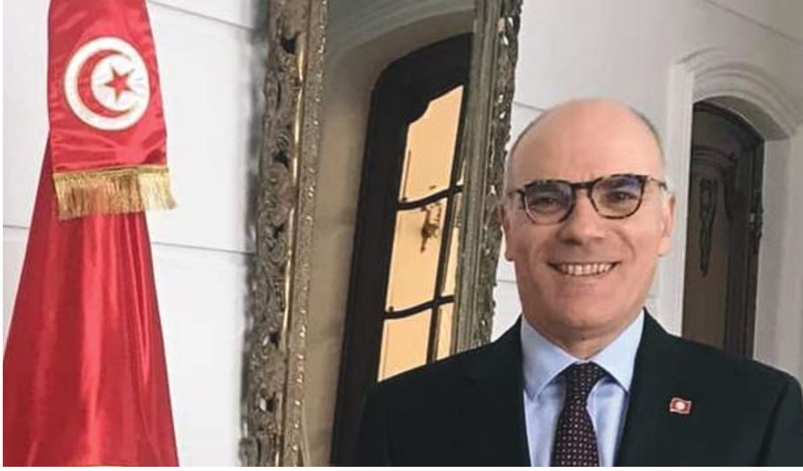
بقطاع غزة نتيجة العدوان الجبان للكيان الغاصب. واتفق الوزيران على مواصلة التشاور والتنسيق الوثيق في مختلف المحافل الإقليمية والدولية بشأن التعاطي مع مستجدات الأوضاع في فلسطين.

وأكد أهمية تكثيف المجموعة الدولية، وفي مقدمتها الدول العربية، لتحركاتها لمنع تفاقم الوضع الكارثي الذي ألم