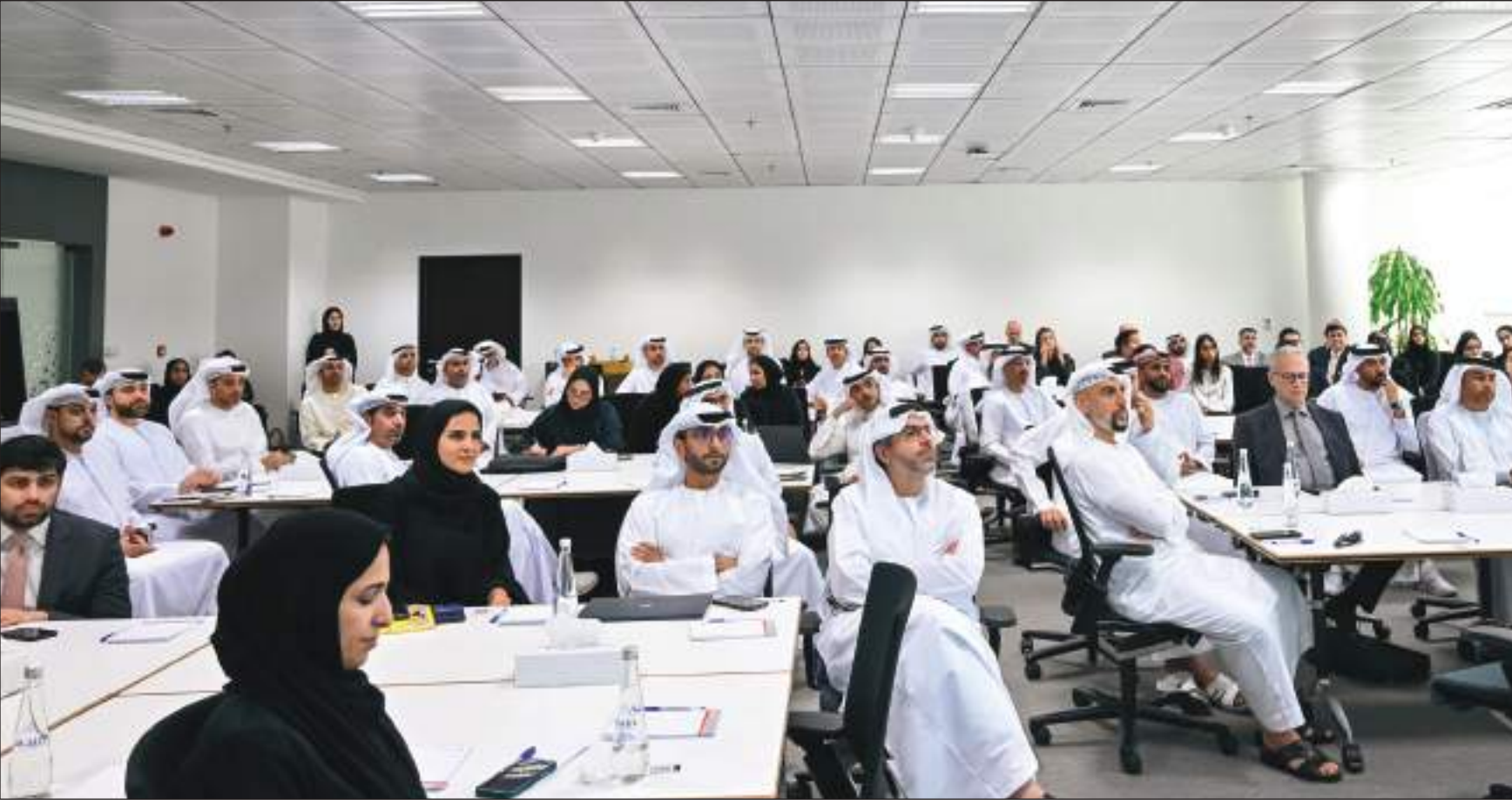
أبوظبي - (وام) :

نظمت دائرة التنمية الاقتصادية بأبوظبي ورشة عمل لمناقشة سبل تعزيز التنمية المستدامة في منطقة العين بمشاركة مجموعة من الجهات الحكومية الاتحادية والمحلية وشركات القطاع الخاص والمعنيين. وناقش المشاركون في ورشة العمل أفضل الطرق لتحسين الشراكات بين القطاعين العام والخاص ووضع الخطط الاستراتيجية لدفع النمو المستدام وزيادة الفرص في قطاع الأعمال وتنمية المواهب في منطقة العين. بحث المشاركون في ورشة العمل كيفية تطوير الفرص في قطاع الأعمال فضلاً عن الخطط التي يمكنها المساهمة في استحداث المزيد من