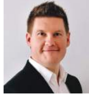
دبي - (وام) :

بلغت قيمة التصرفات العقارية في دائرة الأراضي والأملاك في دبي يوم الاثنين أكثر من 3,35 مليار درهم. فقد شهدت الدائرة تسجيل 715 مبيعة بقيمة 2,28 مليار درهم، منها 62 مبيعة أراض بقيمة 624,87 مليون درهم و653 مبيعة شقق وفضل بقيمة 1,65 مليار درهم. وجاءت أهم مبيعات الأراضي بقيمة 103,74 مليون درهم في منطقة سبخ شعيب 2 تليها مبيعة بقيمة 47,42 مليون تليها مبيعة بقيمة 46,36 مليون درهم في منطقة نخلة جبل علي. وتصدرت منطقة نخلة جبل علي المناطق من حيث عدد المبيعات إذ سجلت 19 مبيعة بقيمة 43,51 مليون درهم تلتها منطقة الحبية الخامسة بتسجيلها 11 مبيعة بقيمة 28,53 مليون درهم وثالثة في نخلة جبل علي بتسجيلها 6 مبيعات بقيمة 177,16 مليون درهم. وفيما يتعلق بأهم مبيعات الشقق والفلل جاءت مبيعة بقيمة 78,63 مليون درهم بمنطقة نخلة جميرا كاهم المبيعات تلتها مبيعة بقيمة 39,74 مليون درهم في منطقة الخليج التجاري وأخيراً مبيعة بقيمة 39,16 مليون درهم في منطقة الخليج التجاري. وتصدرت منطقة البرشاء جنوب الرابعة المناطق من حيث