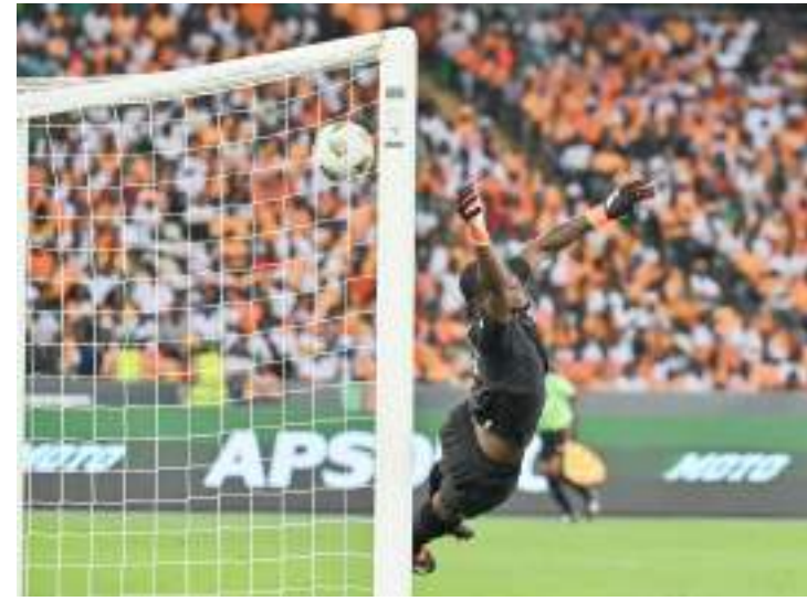
أبيدجان / وام /