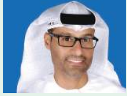
أبوظبي - (وام) :

يشارك مجلس الأمن السيبراني لحكومة دولة الإمارات العربية المتحدة في فعاليات معرضي يومكس وسيمتكس 2024 اللذين يعقدان برعاية سمو الشيخ هزاع بن زايد آل نهيان، نائب حاكم إمارة أبوظبي. وتشمل مشاركة مجلس الأمن السيبراني في المعرضين إقامة جناح خاص بالتعاون مع مؤسسة اتصالات يقدم خلاله عرضاً شاملاً لأنشطته وبرامجه، إضافة إلى عقد عدد من الجلسات الحوارية والورش التدريبية حول مختلف جوانب الأمن السيبراني. وقال الدكتور محمد الكويتي، رئيس مجلس الأمن السيبراني، إن المشاركة في المعرضين تأتي في إطار حرص المجلس على تعزيز التعاون مع الجهات المحلية والإقليمية والدولية المعنية بالأمن السيبراني، إضافة إلى تسليط الضوء على تأمين المنظومات غير المأهولة وما تعتمد عليه من نداء اصطناعي وتقنيات حديثة.